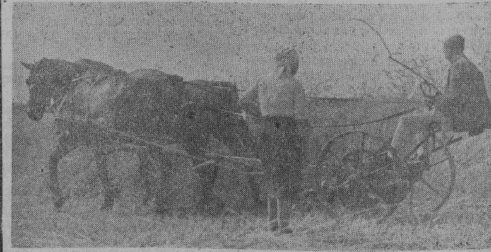
Германские солдаты помогают русским крестьянам собрать урожай.