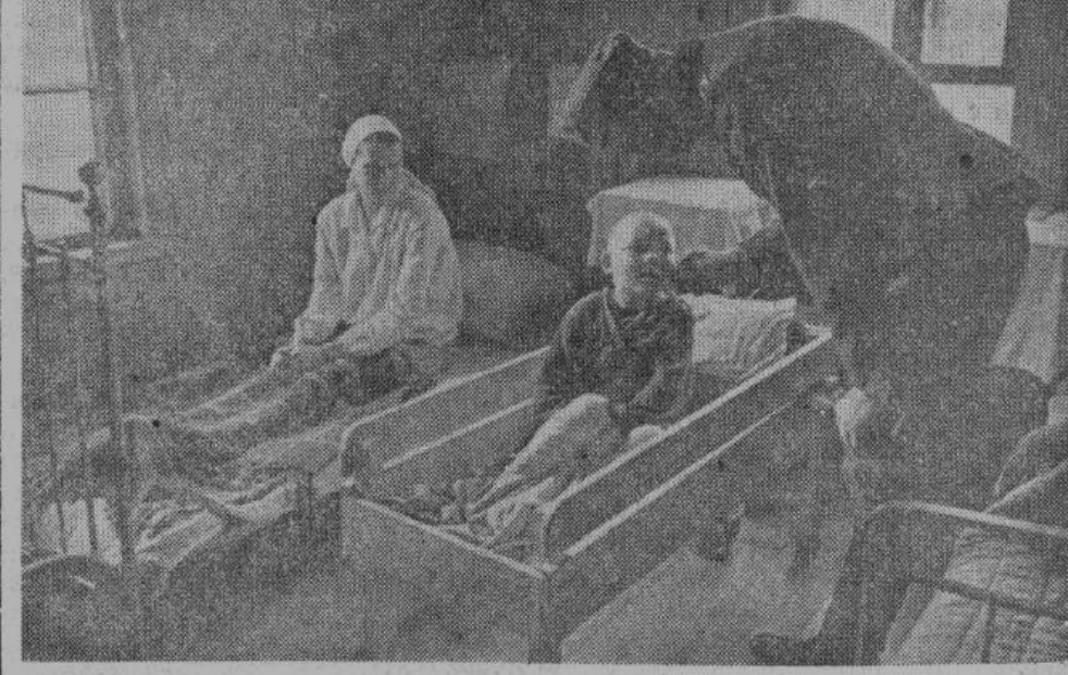
Больница для гражданского населения. Германский военный врач инспектирует палаты и осведомляется о состоянии больных.