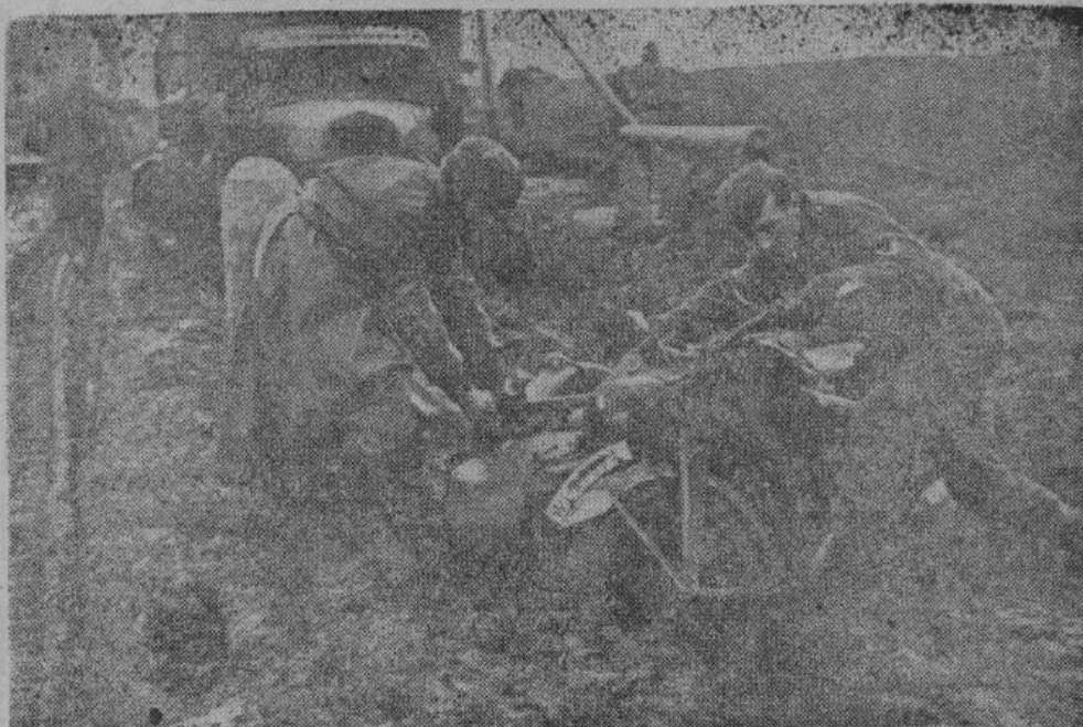
В различных местах Восточного фронта распутица вызвала затруднения в транспорте. Немцы легко справляются с этими затруднениями.