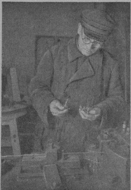
При ремонтных работах иногда не хватает нужных по размеру винтов или заклепок. Поэтому приходится организовывать их производство на месте. На снимке — мастер, проверяющий качество изготовленных винтов

— Когда мне стукнуло 17 лет я был учеником у часовых дел мастера. Приходят раз к моему хозяину какие-то важные чиновники и просят, чтобы он поехал к губернатору. Направился он. Меня с собой