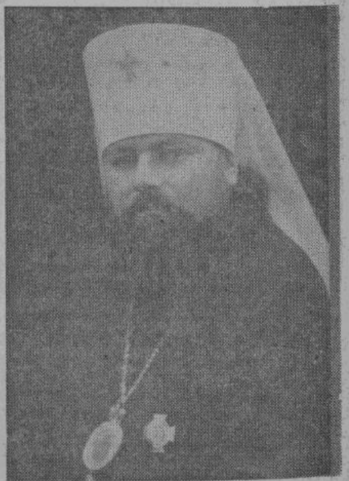
Митрополит Сергий, экзарх Латвии, Литвы и Эстонии

Владыка Сергий пользуется большим авторитетом у русского населения Прибали-