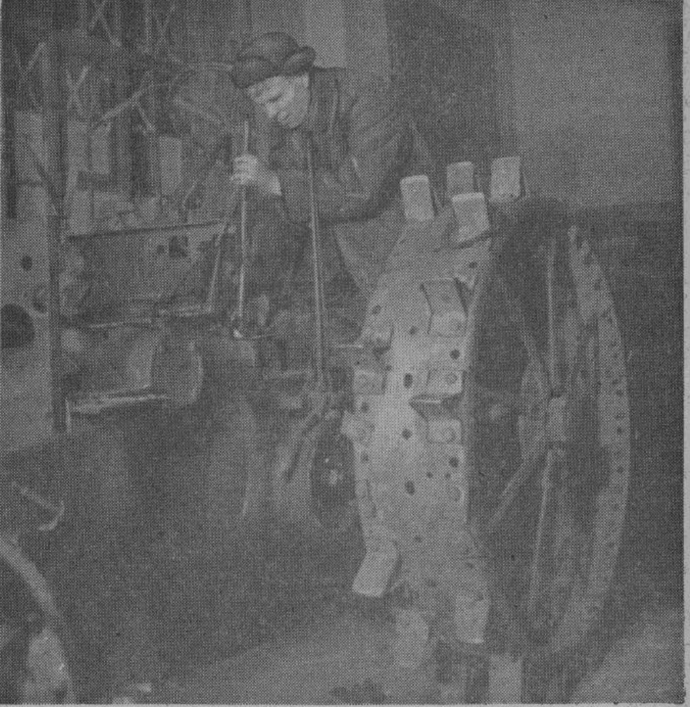
Тракторы, обслуживавшие прежде колхозные земли, теперь помогают крестьянам обрабатывать собственные пашни. На снимке — водитель машины проверяет трактор, который выпускается из ремонта.