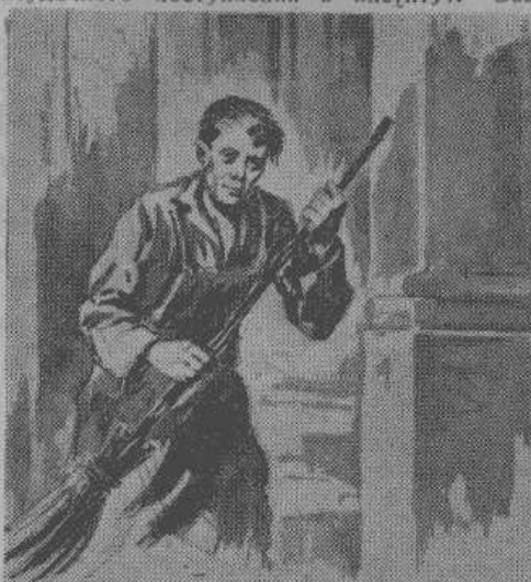
Я лишь неделю поуродовал метлой и совком. кадрами внимательно меня выслушал, а затем молча взял со стола мою анкету.