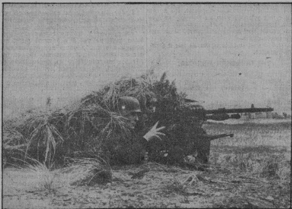
Ни техника, ни живая сила врага не могут сломить железной выдержки германского пехотинца. Пулемет попрежнему остался опаснейшим оружием в его руках.

Проблема небольших народов стала теперь общеевропейским вопросом. Журнал пишет, что после поражения Германии, чье-то англо-американцами, европейский континент совершенно изменил свое лицо, при чем даже крупные державы, как Франция и Италия, будут лишь мелкими странами, по сравнению с огромными Соединенными Штатами, с одной, в Советским Союзом, с другой стороны.