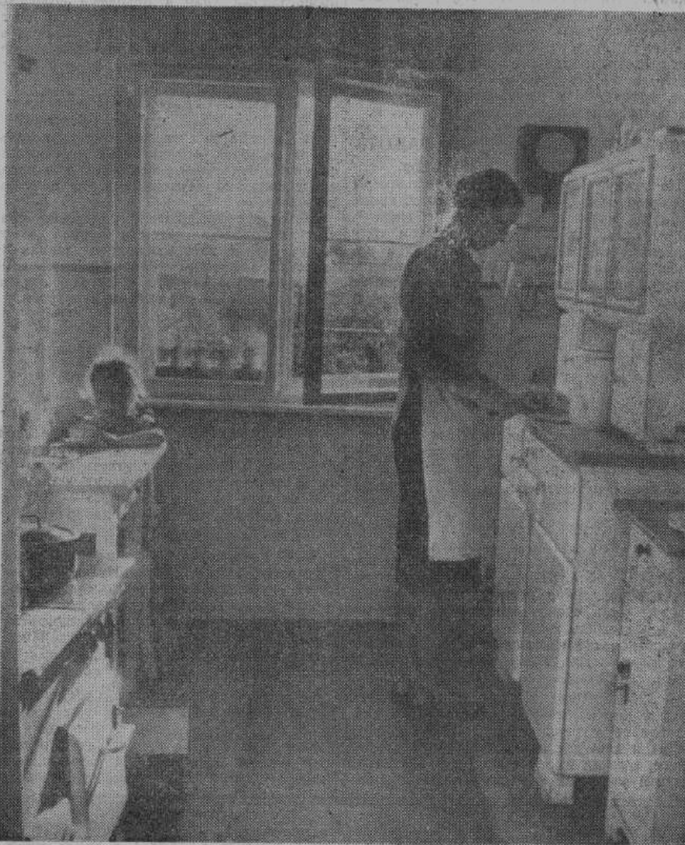
Современная кухня в «двух с половиной» комнатной квартире германского рабочего. Слева — газовая плита с духовкой и сушилкой, обеденный стол. Направо — удобные шкафы, покрытые белым лаком. Чисто, удобно и отнимает мало времени от домашней хозяйки.

В этом отношении германское правительство широко поощряет работу сберегательных касс и страховых обществ. Быстро и незаметно накапливается небольшой пер-