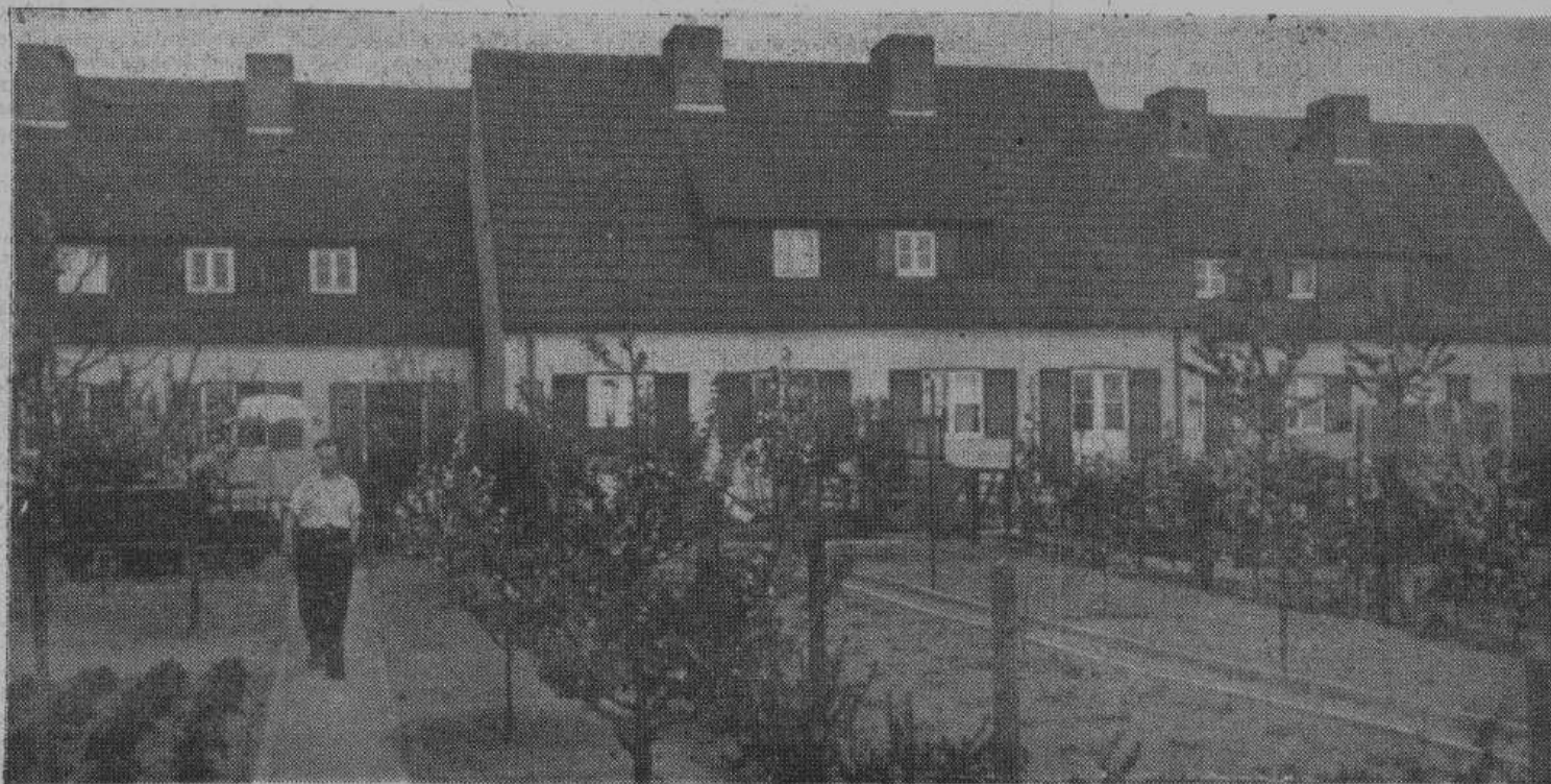
Ряд домов для семейных рабочих. Садики засажены плодовыми деревьями и кустами. Хозяева следят за ними с большой любовью. Постройка таких домов особенно поощряется правительством.

Потсдам. Квартал новых, «с иголочки», домов. Часть их еще не оштукатурена, часть