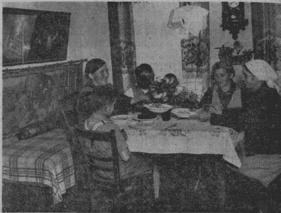
В этой квартире из трех жилых комнат живет семья ремесленника столяра, владельца собственной мастерской. У него работает двое подмастерьев. Семья живет в квартире пять лет.

Квартира мелкого ремесленника имеет еще более зажиточный вид. В ней три