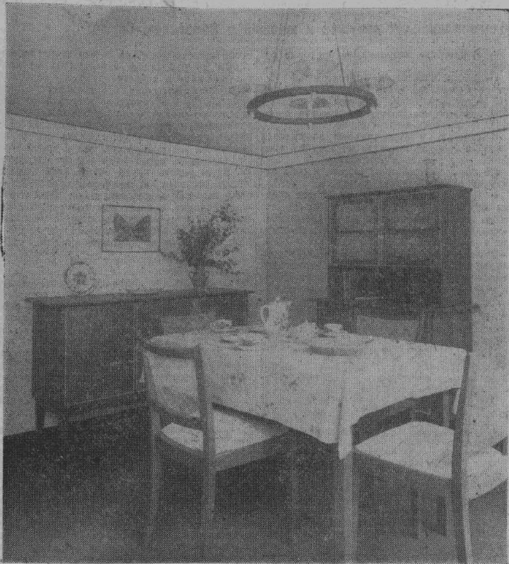
Столовая в трехкомнатной квартире слесаря. Квартира стоит 32 марки в месяц. Хозяин ее служит на заводе механиком, получает жалование 284 марки в месяц.

Задача правительства: каждому рабочему — своя квартира