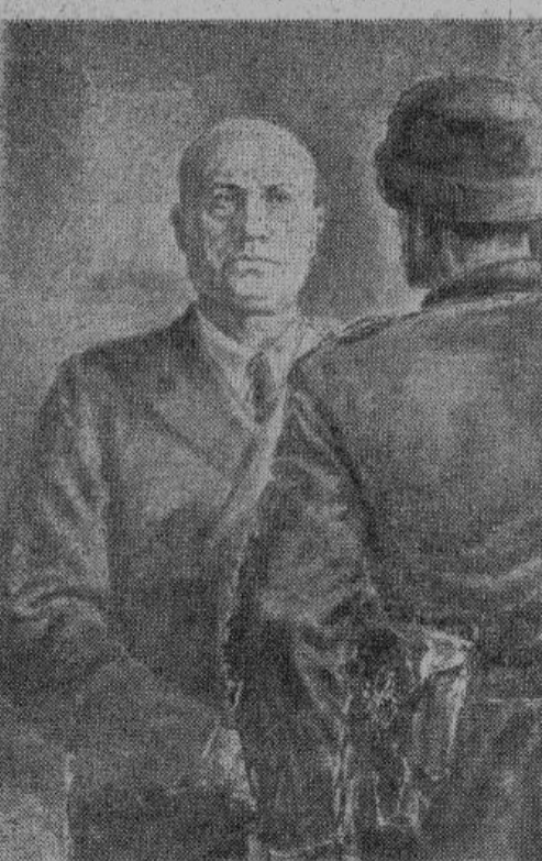
«Дуче, Фюрер послал меня освободить вас» — звучат исторические слова смельчака Скорцени.