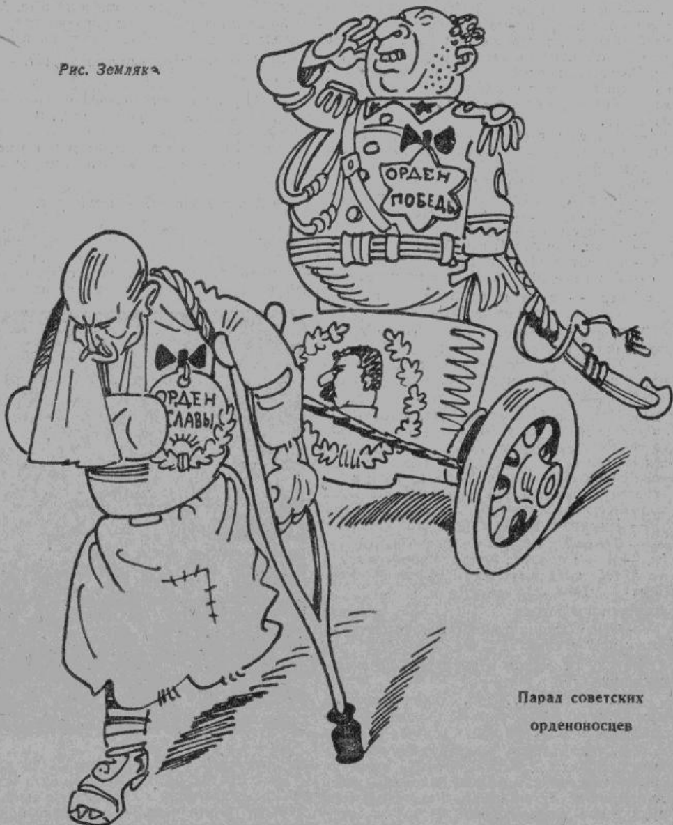
Парад советских орденосцев

шки, отличительные значки. Ордена сыпятся, как из рога изобилия. Последним постановлением верховного совета СССР введены еще два ордена: «Победы» и «Славы». Судя по смелому названию, ими решено увенчать теперешнее советское продвижение