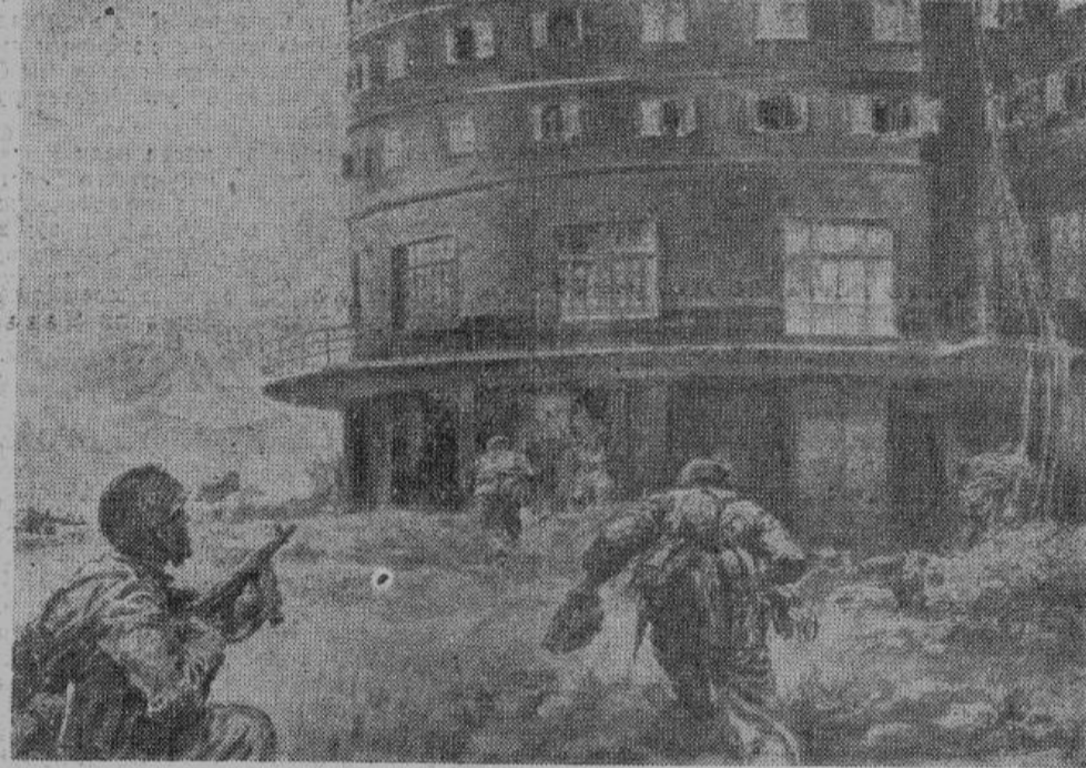
Бесстрашные стрелки отряда Скорцени стремительно продвигаются к цели — до дому заключения Дуче. Стража у ворот совершенно растерялась.