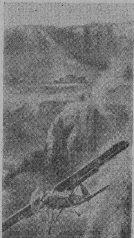
Самолет с освобожденным Дуче, не имея разбега, скользит в пропасть...

в словах: «Да, я полон беспредельной энергии и силы. Я оставлю по себе немеркнущую славу. Я воздвигну себе памятник.»