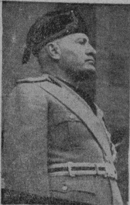
Дуче Бенито Муссолини.