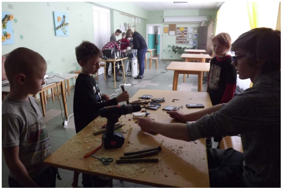
Gatavojot zīmuli-suvenīru, ar urbja palīdzību nepieciešams izurbt koka vidiņu, lai tajā varētu iepildīt krāsaino kritiņu.

„Tilžas rūķišu” rokdarbnieces uz ikgadējās akcijas "Satiec