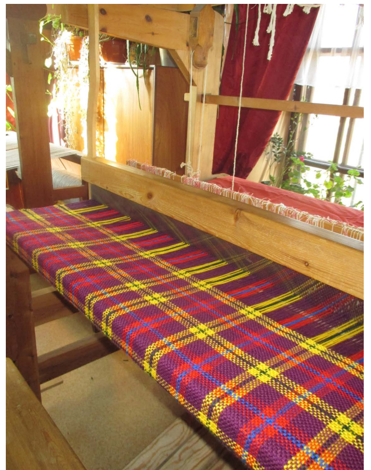
Aušana ir laikietilpīgs darbs, taču galarezultāts ir tā vērts – lietderīgi pavadīts brīvais laiks un iegūts skaists plecu lakats.

Apmeklētājiem bija arī iespēja aplūkot rokdarbnieču jaunākos darinājumus - adījumus un pārļu rotas, kā arī dalīties pieredzē un apmainīties ar rakstu paraugiem, tehniskajiem zīmējumiem.