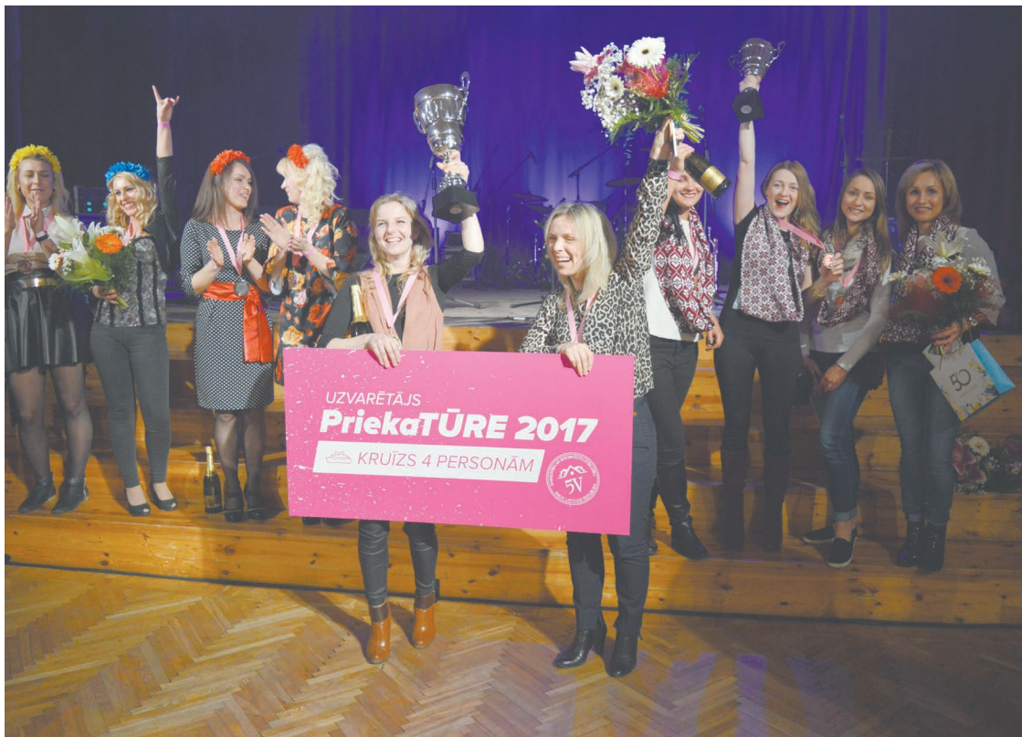
Neveltots prieks un emocijas atraktīvā brauciena "Prieka tūre" uzvarētāju sejās. 1.vieta komandai "Melnās Panteras" (balvā jūras kruīzs uz Zviedriju četrām personām no SIA "5V"); 2.vieta komandai "MG Matrijoškas" (balvā pirts procedūra pie Arnitas Melbergas 100 EUR vērtībā), bet 3.vieta "Sirmās večiņas" (dāvana no SIA "ECO Fabrika").