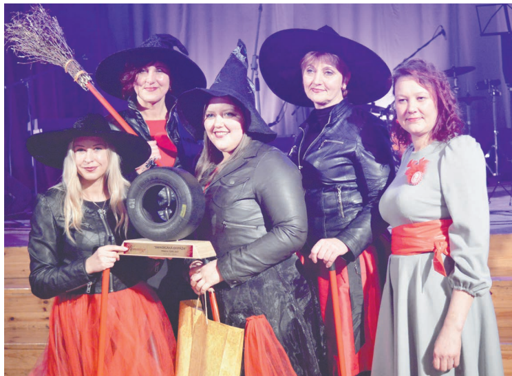
Smaids ir neatņemama "Prieka tūres" sastāvdaļa. Balvu nominācijā "Smaidīgākā ekipāža" saņēma komanda "Turboslotas".

Sacensības ilga gandrīz visu dienu, kuru laikā bija jāveic ap 250km, jāpiedalās vairāk nekā 30 kontrolpunktos, lai izpildītu amizantus, sarežģītus un zināšanas prasošus uzdevumus. Piemēram, Tilžā bija jāatpazīst