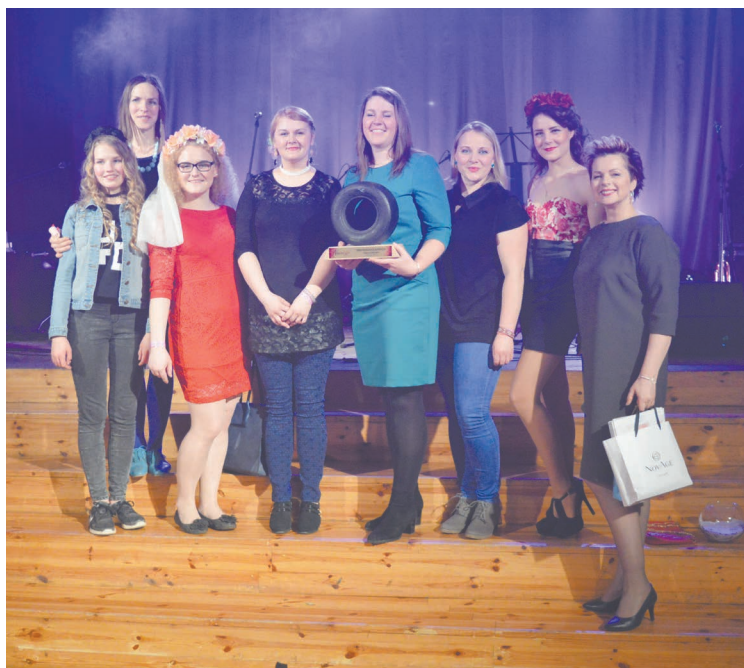
Komanda "Upītes bāguļojošos leigavas" sacensībās piedalījās tērpos ar kāzu kleitas elementiem, iespējams, ka tas viņām nodrošināja nominācijas "Sievšķīgākā ekipāža" saņemšanu.