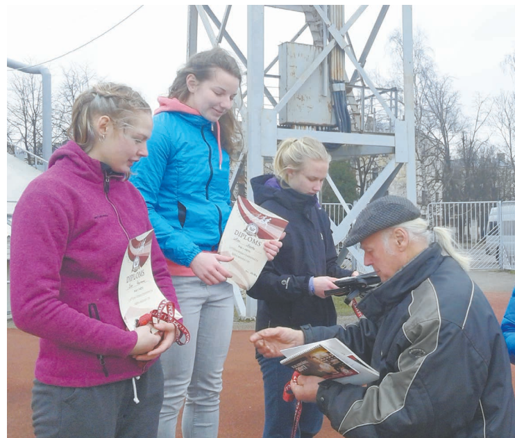
Aivu Niedru ar 1.vietas iegūšanu sveic leģendārais Latvijas olimpietis Jānis Lūsis.

Tie sportisti, kuri izcīnīs pirmo un otro vietu Latvijas čempionātos, iekļūs Latvijas izlases sastāvā un aizstāvēs Latvijas godu Baltijas valstu sacensībās.