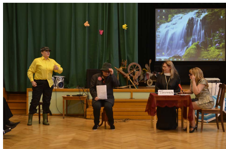
Pensionāta "Balvi" radošais kolektīvs māk pasmaidīt par dažādām dzīves ķibelēm, izspēlējot skeču par notikumiem tiesas zālē.

Pasākuma viesi, visi kā viens, iemītniekiem vēlēja stipru veselību un optimismu!