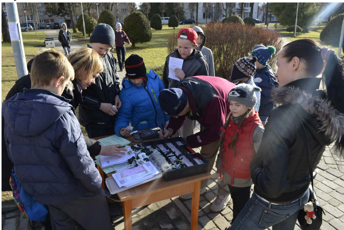
Balvu pilsētas skvērā dunēja bērnu soļi no pēcpusdienas līdz pat tumsai, spēlējot orientēšanās spēli "Uz baltas lapas orientējos baltajā sniega grāmata".

Un tā vairākas stundas Balvu Centrālajā bibliotēkā bija nerimstoša rosība! Pēc izskriešanās varēja piedalīties arī nedaudz mierīgākās darbnīcās - skatīties filmu "Puika", kas uzņemta pēc "Baltās grāmatas" motīviem, aizpildīt krustvārdu miklu, izgatavot bitītes, skaidrot senvārdus, uzrakstīt vēstuli kādam tuvam un mīļam cilvēkam, kas vēlāk tika nosūtīta pa pastu un vēl, un vēl. Katrā nodarbību telpā, pēc uzdevuma veikšanas, tika iedots stāsts, uz kura tēmu balstīties, izveidota attiecīgā darbnīca. Pēc tam tika piedāvāta iespēja šos visus stāstus iešūt vienā grāmatīnā, lai tos vēlāk izlasītu. Šādā veidā