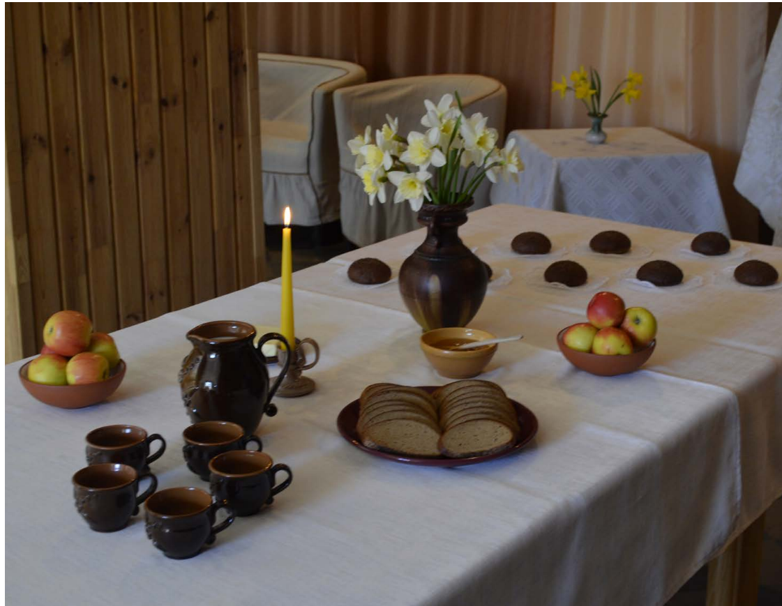
Baltā galdauta svētku mērķis ir iedvesmot cilvēkus 4.maijā pulcēties pie viena galda ģimenes, draugu, kaimiņu vai kopienas lokā.

Pēc ozolu stādīšanas notika svinīgs pasākums "Kad Atmosfēra bij pārpilns gaiss" Balvu muižā. Klātesošos, dziedot patriotiskas dziesmas, iepriecināja Balvu Kultūras un atpūtas centra koris