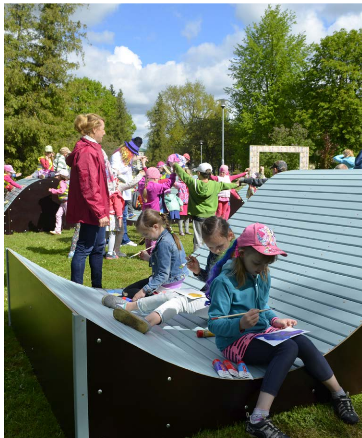
Uzstādītos zvilņus visas dienas garumā iemēģināja Balvu pirmsskolas izglītības iestāžu un Balvu pamatskolas skolēni.