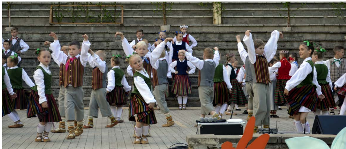
"Laimīgas zemes" pasākuma laikā gaisā virmoja pacilātība un dejotprieks.

priecē tas, ka kultūrai un mākslai nav robežu ne valstu, ne novadu līmenī, un pasākumu kuplina arī Viļakas un Rugāju novada deju kolektīvi."