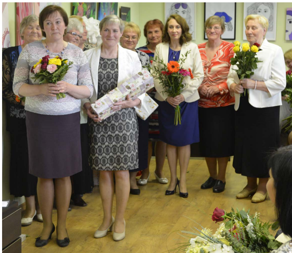
Bijušie bibliotēkas darbinieki, sakot apsveikuma vārdus un daloties atmiņās par darba gaitām iestādē.