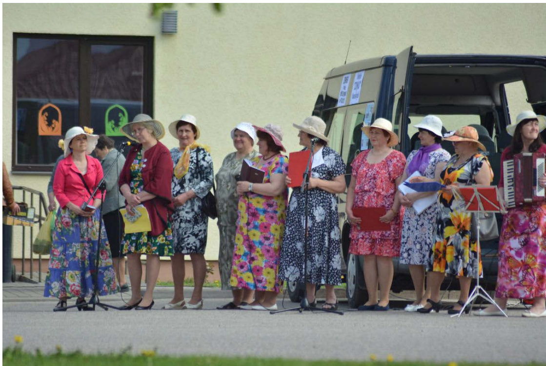
Folkloras kopas "Saivenis" dalībnieces gatavas ieskandināt Bērzpils pagasta svētkus.