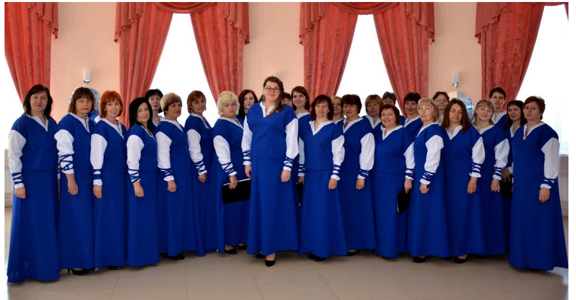
Jaunie tērpi jau tika nēsāti piedaloties II starptautiskajā konkursā – festivālā "Consonance", kas notika maijā Pleskavas rajona Pečoras.

Atbalsta Zemkopības ministrija un Lauku atbalsta dienests