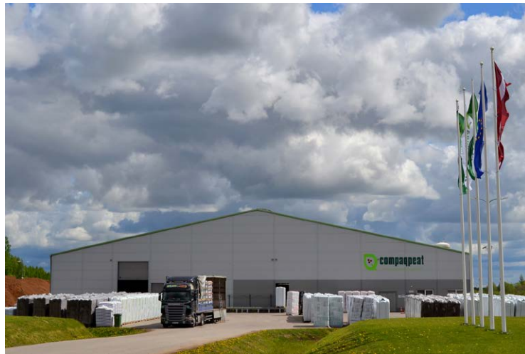
Uzņēmēju brokastu pasākums šoreiz iesākās ar kūdras ražotnes SIA "Compaqpeat" rūpnīcas Lutinānu purvā apmeklējumu.