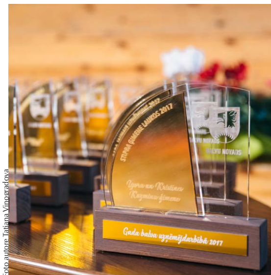
Katrā nominācijā tika pasniegtas īpašas balvas.