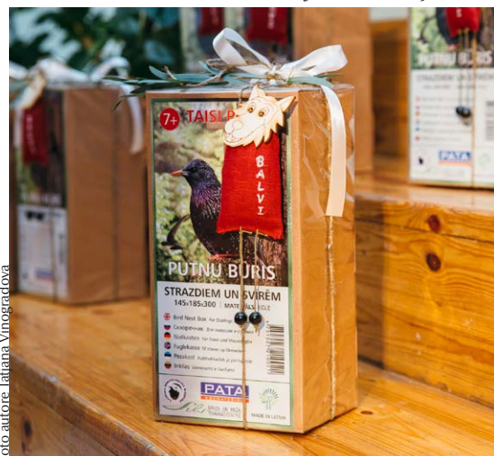
Arī SIA "Parādīzes putni" bija parūpējušies par pašdarinātām velēm visiem balvu saņēmējiem. Viņi dāvināja putnu būriņus, kas pašiem jāsaliek.