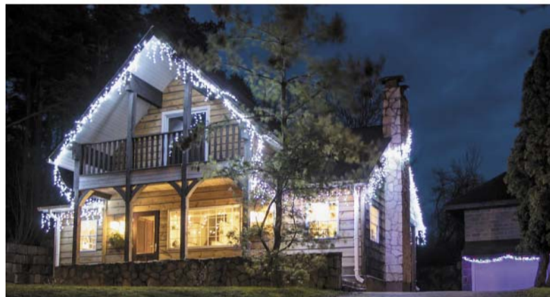
Valmieras iela 10, Smiltene.

Labāko noformējumu autori tiks godināti personīgi ar atzinības rakstu, saņemot simbolisku un praktisku dāvanu no Smiltenes novada domes – īpaši šai akcijai veidotu latvju zīmes (Akas zīmes) gaismas dekoru, ko turpmāk var izmantot Ziemassvētku noformējumu papildināšanā. Pašvaldības pateicības rakstus par piedalīšanos saņems visi akcijas dalībnieki.