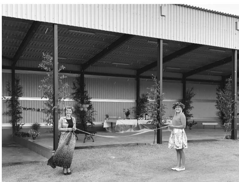
Jaunās darbnīcas atklāšana.