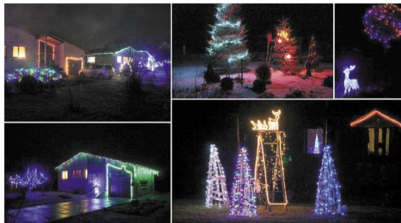
Upes iela, Palsmanē.

Smiltenes novada dome jau piekto gadu turpināja iesāktu tradīciju, rīkot akciju „Radīsim Ziemassvētku noskaņu Smiltenes novadā” ar mērķi iesaistīt iedzīvotājus radīt Ziemassvētku un Jaunā gada noskaņu katram savā mājā, pagalmā un darbavietā ar oriģināliem rotājumiem. Akcija noslēdzās 7. janvārī, kur balsošanā kopsummā tika izvirzīti 16 objekti, no tiem 5 pieteikti un 11 darba grupas izvirzītie.