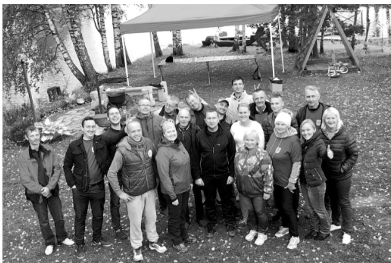
Uzņēmuma 25 gadu jubilejas atzīmēšana.

SIA „Smiltenes NKUP” izsludināja iepirkumus gan par daudzdzīvokļu dzīvojamās mājas Smiltē būvprojekta izstrādi, būvniecību un autoruzraudzību (par uzvarētāju tika atzīts SIA „Woltec”), gan daudzdzīvokļu dzīvojamās mājas Smiltē, Daugavas ielas 7A pārbūves būvdarbu būvuzraudzību (SIA „Dromos”), un šobrīd norisinās