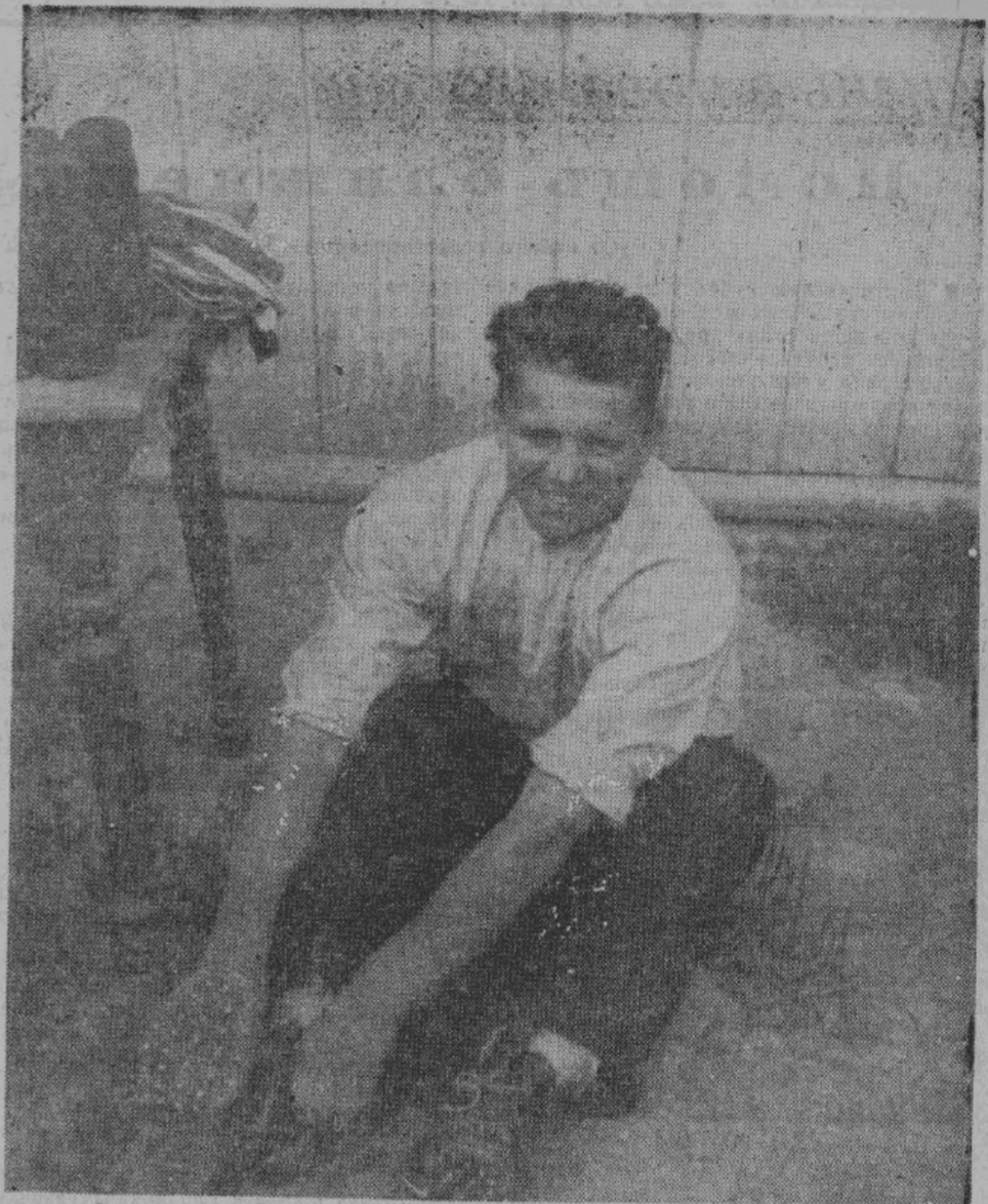
Полная «переоценка ценностей». Новый боец за свободную Россию надевает форму Русской Освободительной Армии.