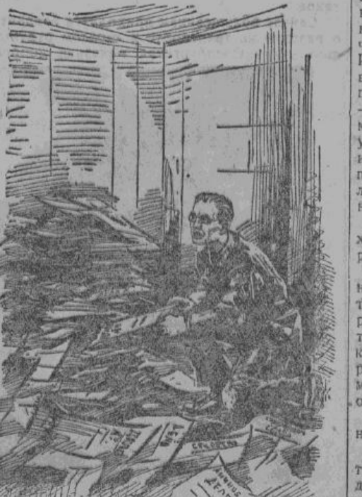
Я пытаюсь по Наседкинской терминологии определить «что — куда».

профессоров, профессор математики. В этом качестве он почему-то попал на должность «статистика» — должность, ничего общего со статистикой не имеющая. Статистик — это изловый погонщик УРЧ, должаستاющий в «масштабе колонны», т. е. двух-трех бараклов, учитывать использован-