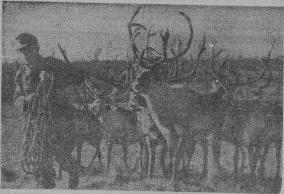
Оленей в загонах тщательно сортируют. Самые выносливые идут в упряжку.

видны пестрые одежды лапландских крестьянок. В нескольких шагах от нового правительственного здания находится большой крестьянский хутор, чердак и стены которого весной увешаны окороками мяса северных оленей.