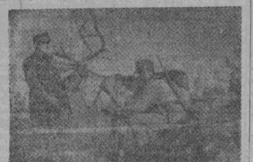
Северные олени используются, как тягловая сила и для военных целей.

Весь уклад жизни и все интересы лапландцев зависят целиком от этих животных.