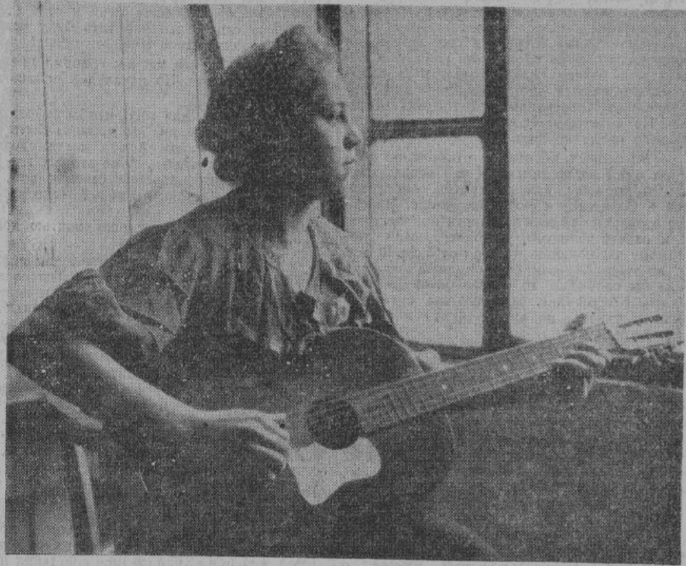
Разве эта мечтательная девушка не пронесла свою душу неиспорченной через большевицкое разлагающее воспитание.