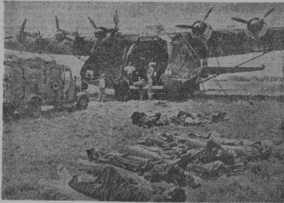
В огромный самолет погружают раненых для отправки их в тыловой лазарет.

баки наполнены бензином, проверены все инструменты и машинные части, а также приведено в порядок бортовое оружие. Успешное выполнение заданий этих воздушных гигантов, требует от команды исключительного усердия и много опыта. Полеты сопряжены с большим напряжением сил, так как самолеты находятся в пути долгое время. Часто им приходится летать над местами, кишими сталинскими бандами