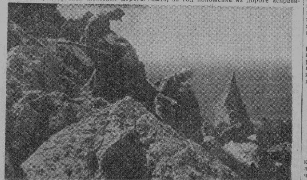
Германские альпийские стрелки в горах Италии выполняют боевое задание.

Группа депутатов потребовала от министра внутренних дел подробных сведений о размерах восстания. Правительство не подтверждает и не опровергает эти слухи.