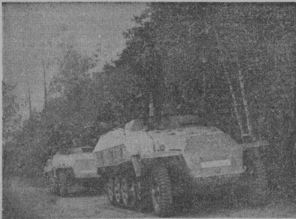
Германские бронемашины на лесной дороге ожидают приказа для очередного разведывательного рейда.

Каждый участник имел собственную личную охрану.