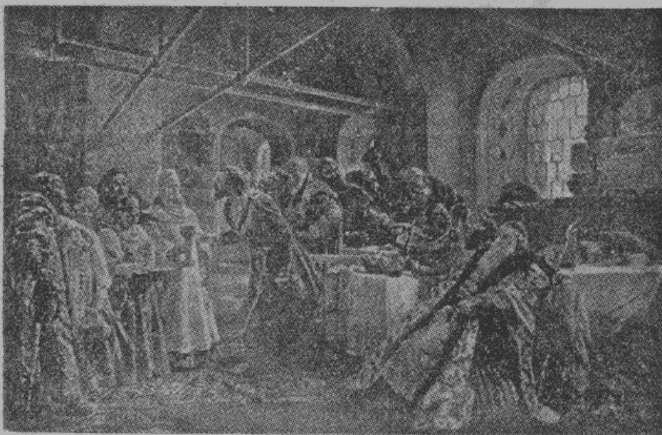
Картина художника К. Е. Маковского «Поцелуйный обряд».

В старинные годы Россия не знала, что значат жида; Татари, потомки Батия, Над нами держали бразды Но как-то в последнее время Мы дали приют и жидам, И рабски еврейское племя Служило за фактора нам. Затем изменились роли. Судьба ухитрилась дать Татарам лакейские доли — Евреев же вывели в знать, И дерзко ликуют евреи, И крепнет в России их курс, И скромно им служат лакеи Потомки баскаков и мурз. Но в новой их роли от старой Заметны остались следы: С достоинством служат татары, И барствуют подло жида. Ф. Черниговец.