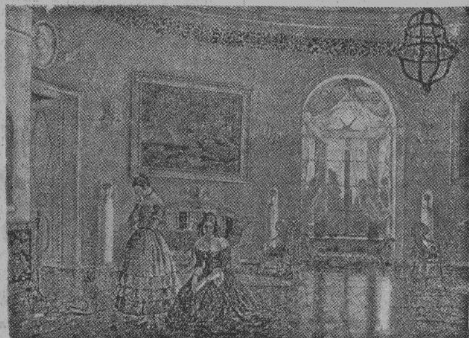
Эскиз декорации художника М. Е. Добужинского к «Месяц в деревне».

крахмала. Шелуху каштана снимают, его стерилизуют, размалывают и растворяют в воде. При этом получается сапонин, заменяющий сапонин чилийского дерева — квилла. Сапонинами называют вещества, содержащиеся в целом ряде растений, главным образом, в коре тропического дерева квилла сапонария, называемой в продаже мыльной корой; в растворе воды сапонин, подобно мылу, образует густую пену, вследствие чего употребляется при стирке особенно нежных материй. Сапонин применяется также в медицине и косметике. Особенную ценность представляют сапонины для зарядки огнетушителей, действующих пенистой жидкостью, ибо они дают в воздушной или наполненной газом среде чрезвычайно обильную и устойчивую пену. При дальнейшей разработке можно получать из каштанов белки, представляющие собой весьма ценный кормовой продукт и, наконец, из маслянистых ростков каштана добывается масло, употребляемое для изготовления мыла.