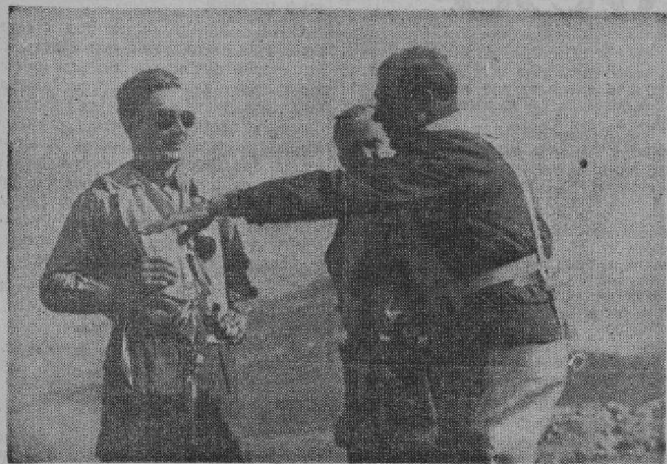
«Это было удачное дело», рассказывает командир воздушного десанта