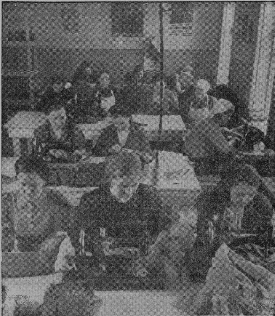
Русские трудящиеся, работающие в Германии, прилежным и сознательным трудом помогают фронту. Среди многих тысяч русских рабочих и работниц и эти швей и Рождеству получают денежную награду.

За то же время американцы потеряли 10.649 человек; из них 1603 — убитых, 6361 — раненых и 2685 пропавших без вести.