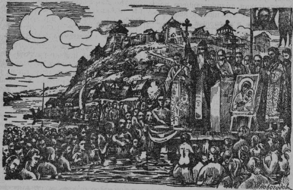
Крещение русского народа в Днепре у стен древнего Киева. (Со старинной гравюры).

Усилившееся влияние христианства привело к тому, что сама княгиня Ольга, вдова Игоря, совершив в 957 году путешествие в Константинополь,