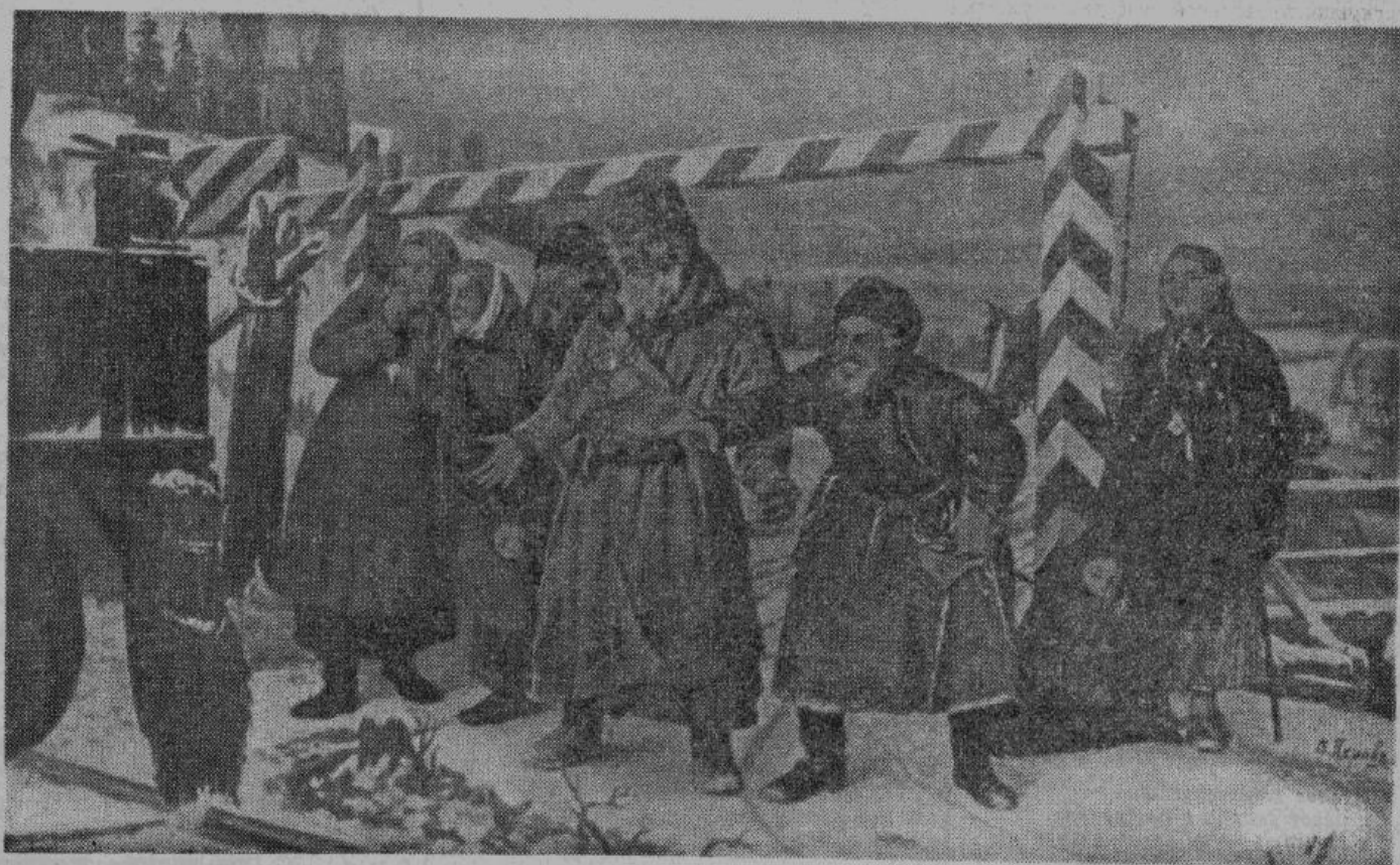
«Открытие железной дороги»

В действительности, мертвенно гладок и гол другой «сокол» — одно из старинных стенобитных орудий, которое обыкновенно выливали из чугуна, подвешивали на железных цепях, и ломили им во всякую стену с большим успехом. Если изловчились придвинуть сокола к воротам, то и от железных створов летели только осколки да куски. Это — то тяжелое бревно, окованное на одном конце и называвшееся также тараном, или, еще проще, бараном. Под именем сокола иду и большие, ручные дома, которыми обычно ломают и гранитные камни, и каменную соль. Ручная баба или трамбовка, в роде песта, — тоже сокол.