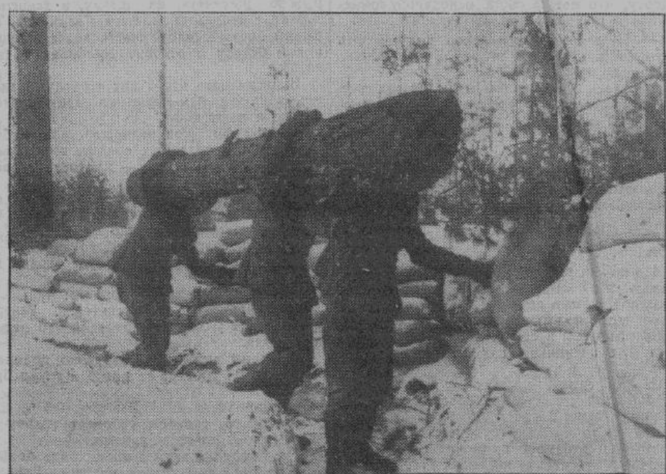
Зимой на солдат возложены особые обязанности: они должны бороться, преодолевая холод и снег. На снимке — германские солдаты доставляют строительные материалы для боевого опорного пункта на передовых позициях