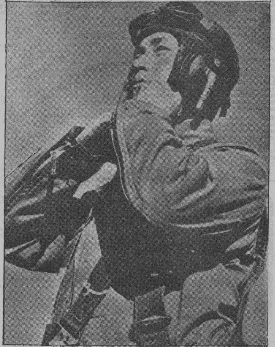
Японский парашютист — решимость, беззаветная любовь к родине и презрение к смерти — основные и общие черты японских солдат.

Каждый народ имеет своих солдат. Чтобы их правильно понять, надо знать их национальный дух; потому что в настоящее время основу и мощь войск составляют моральные и материальные силы всего народа.