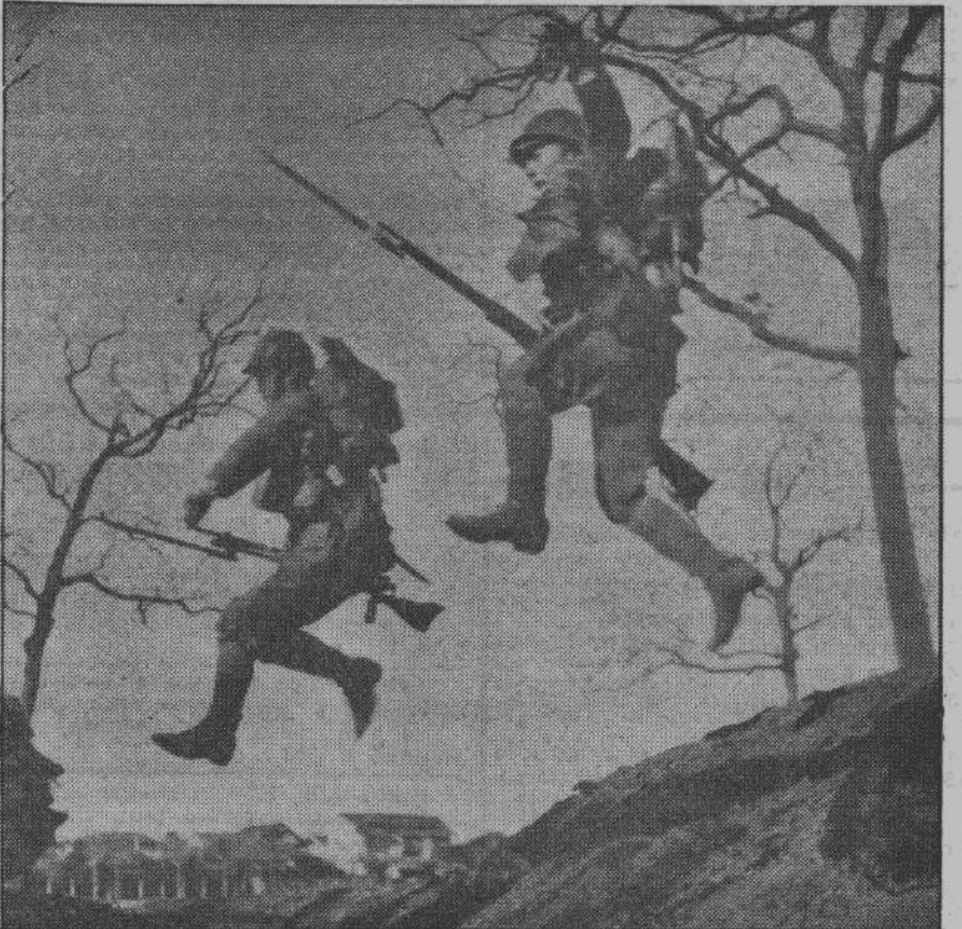
Тренироваться, постоянно тренироваться — вот лозунг военного обучения в Японии. Уметь справляться с любой трудностью — предпосылка окончательной победы.