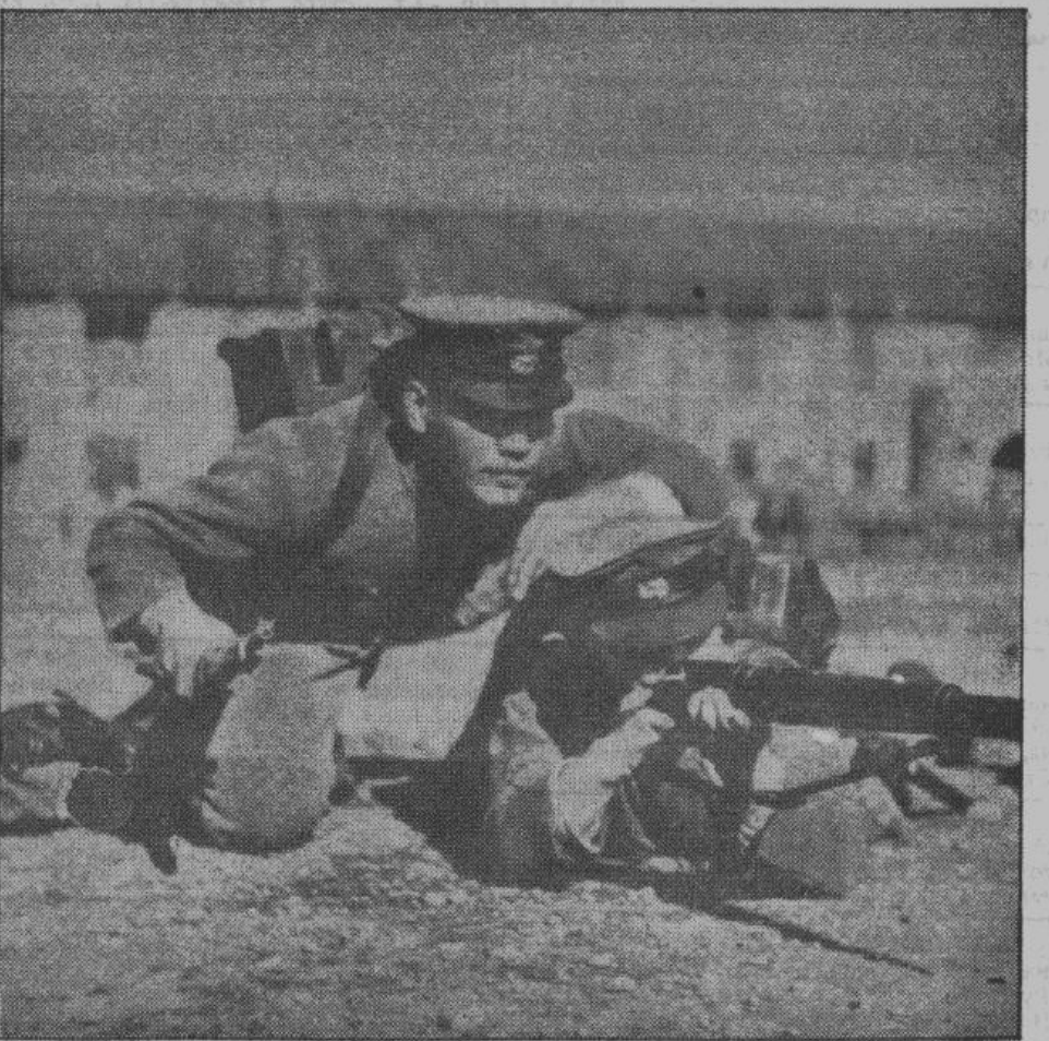
Строга и тверда дисциплина в японских военных школах. Настойчиво, упорно стремятся сейчас японцы в борьбе к одной цели: добиться решительной и окончательной победы.