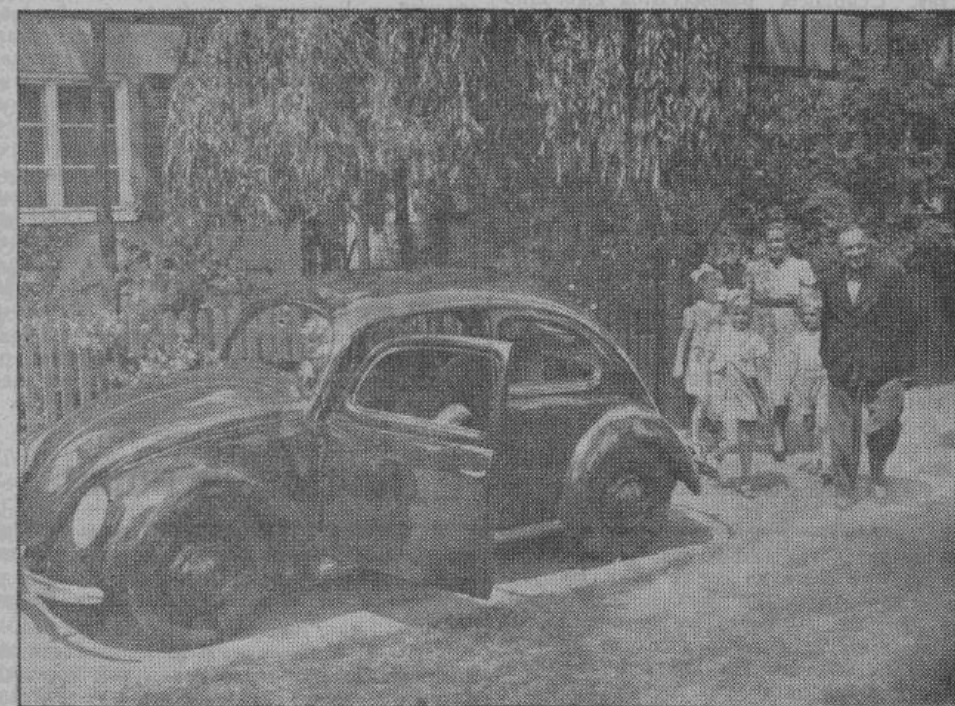
Работа окончена. Теперь, со всей семьей, скорее на лоно природы, отдохнуть, проветриться! В этом поможет собственный народный автомобиль