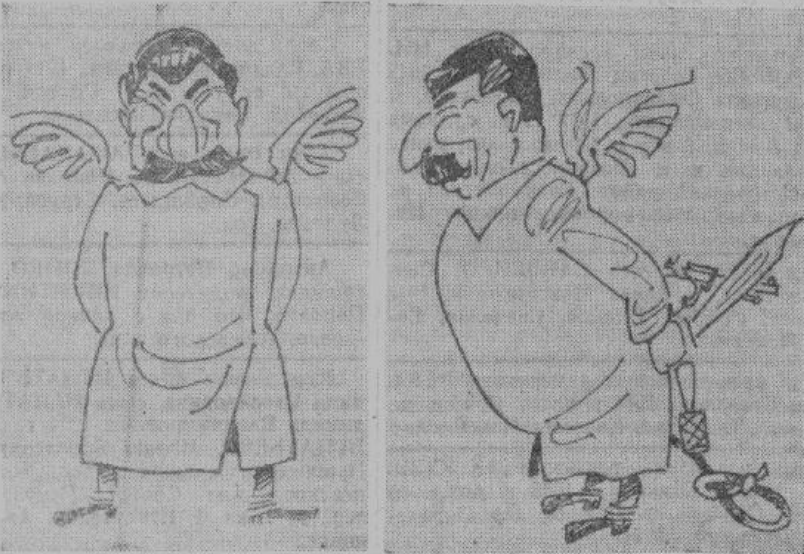
Он «рай» народом обещает. Но в виде нескольких ином — В рай настоящий отправляет Петлей, наганом и ножом.