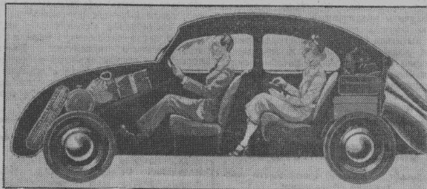
В германском народном автомобиле удобно могут расположиться 4—5 человек; кроме того, еще достаточно места для чемоданов, пишущей машинки, граммофона, запасных шин и т. п.