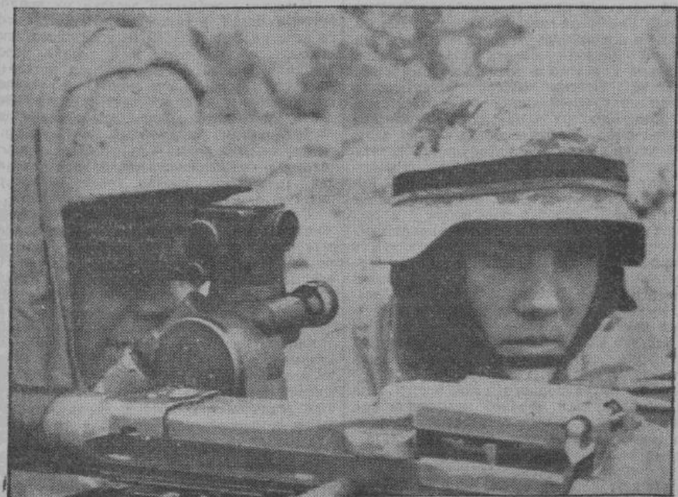
Большевистский план зимнего наступления не удался. Наступающие массы гонимых на убой советских бойцов продолжают истекать кровью, разбиваясь о германские укрепления. На снимке — тяжелые германские пулеметы зорко охраняют важнейшие пункты главной боевой линии