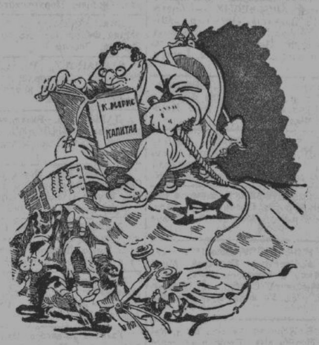
Форменный гевалт! Этот дурак Маркс ничего не пишет, как победить Германию!