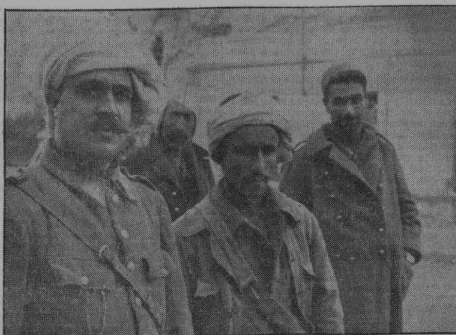
Тысячи беженцев, из оккупированных англо-американцами областей Северной Африки, ищут спасения в Тунисе, где в совместной работе с туземцами оказывают поддержку германскому военному руководству. На снимке — тунисский полицейский офицер (слева) со своими чиновниками