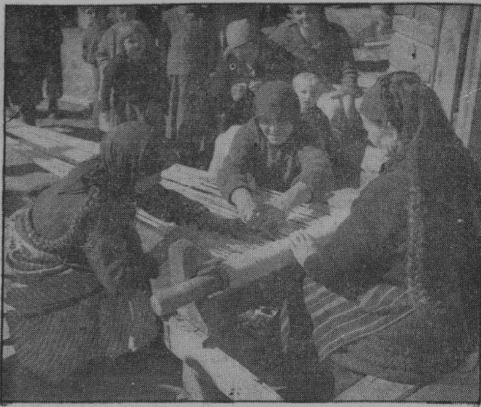
В Болгарии еще и в наши дни большую роль играет домашний способ тканья. При этом вырабатываются ценные ткани

Индустриализация в Болгарии — дело относительно легко осуществимое, так как страна обладает достаточными запасами угля, железной руды, меди, свинца, цинка и марганца. До 1939 года залежи меди и свинца почти не эксплуатировались, а цинк и марганец в стране вообще не добывались. Только добыча угля в последние годы достигла значительных размеров. В 1911 году добывалось всего 300.000 тонн; в 1938 году добыча достигла уже 2,68 миллионов тонн. Таким образом, Болгария имеет возможность широко развить свою промышленность. Однако, для этого она должна приобрести путем товарообмена необходимые машины и орудия производства. Все это она может приобрести и приобретает в Германии.