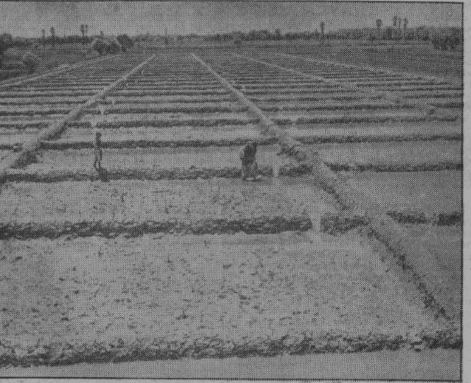
Широко раскинувшиеся рисовые поля с характерной системой орошения имеются не только в Восточной Азии, но также в Европе. На снимке — рисовое поле в Болгарии