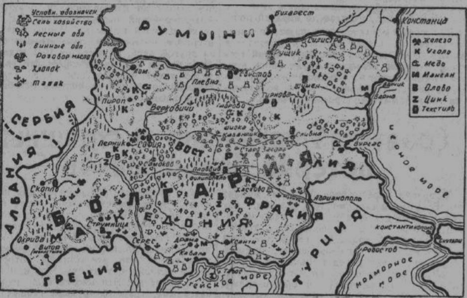
Экономическая карта Болгарии

ности. Главными же представителями либеральной партии были «евольные стрелки» и «гайдуки», продолжавшие борьбу с турками до победного конца и предпочитавшие полную лишений жизнь в ущельях гор благоустроенному мещанскому благополучию.