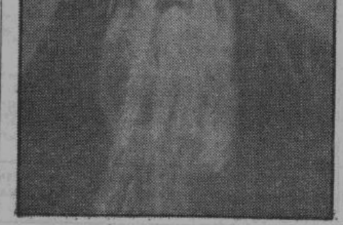
Ф. И. Шляпин в одной из своих ролей

Символическим выражением происшедшей за несколько лет перемены в общей