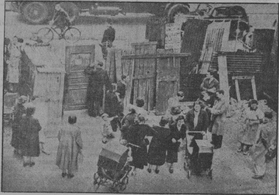
Американские домовладельцы, в большинстве жида, безжалостно выбрасывают на улицу бедных квартирантов. У этих несчастных, из-за безработицы или по болезни, не хватает нескольких центов для уплаты за квартиру. В то же время дивиденды капиталистов достигают нескольких сот процентов