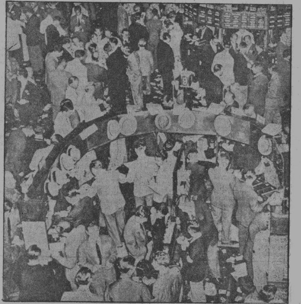
В то время, как миллионы безработных со своими семьями обречены на голод, американские биржи делают фантастические обороты. Жидовские банкиры и их приспешники инсценируют повышения и падения цен, руководствуясь интересами «вож» «гешефтов»