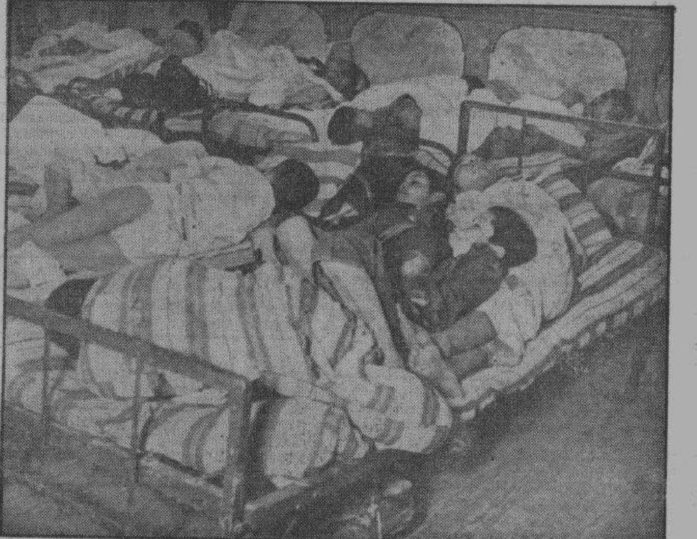
Дети американских безработных втроем или вчетвером спят в одной постели и ютятся в — так называемых — домах «социального обеспечения». Здесь они находят пристанище во время зимних холодов. Никто не заботится об их бедственном положении. Это «социализм» страны Рузвельта!