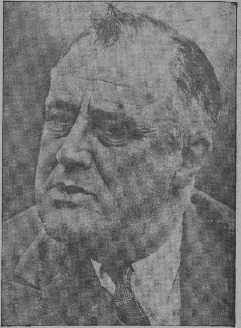
Франклин 1-ый Рузвельт — «король» плуто кратического мира.