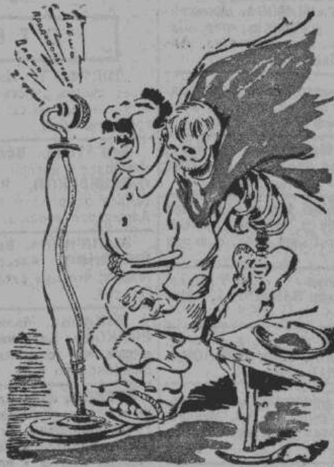
Царь Голод! Ни что и никто тебе не помогут. Ты и только ты отдал мне во власть многомиллионный народ и цветущую страну.

Корреспондент американской газеты сообщает, что самым большим местом сталинского правительства является недостаток продовольствия. (Из газет)