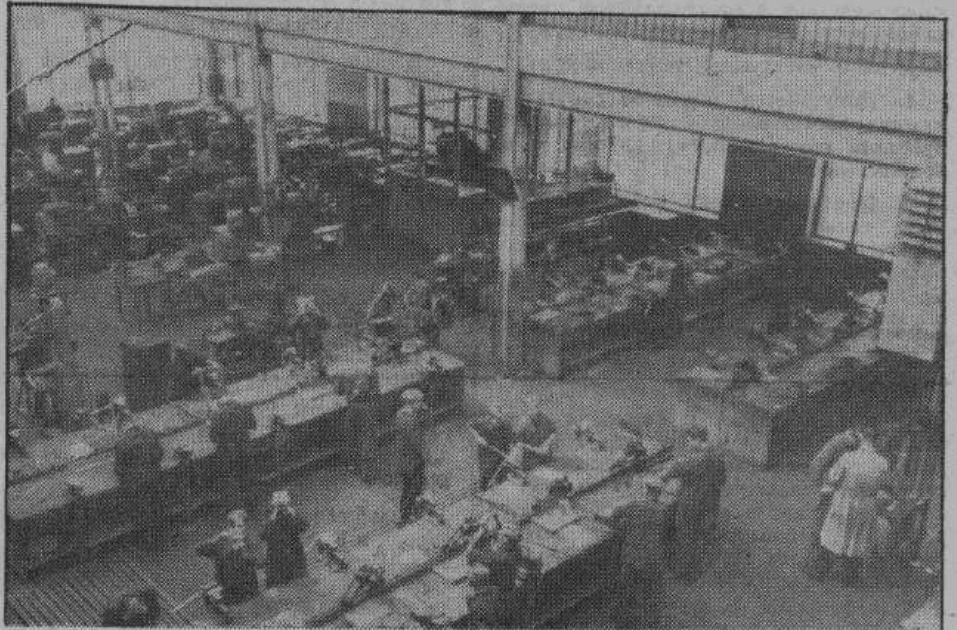
Зал для профессионального обучения «Гитлеровской молодежи» на одном из больших заводов в Германии. Своим чистым видом он служит доказательством неустанной заботы о рабочем