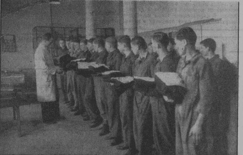
«На осмотр одежды». Воспитатель молодежи, который в тоже время является руководителем учебных мастерских, проверяет состояние одежды своих воспитанников. Опрятная одежда — чрезвычайно важный фактор в деле воспитания молодежи