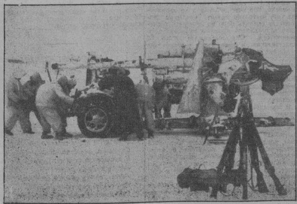
Германские зенитные орудия одинаково успешно применяются как при обстреле самолетов, так и в борьбе с наземными целями, главным образом, танками. Результатом точности попадания этих орудий явилось образование необозримых рядов советских танков на главных участках Восточного фронта. На снимке — зенитное орудие перед стрельбой.