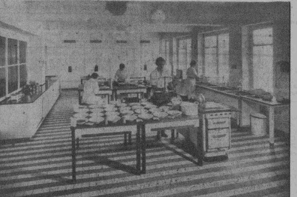
Занятая в германской промышленности молодежь снабжается вкусной и питательной едой, приготовленной в специально устроенных кухнях. Благодаря этому, молодые рабочие экономят время для отдыха и имеют возможность в обеденный перерыв заняться спортом