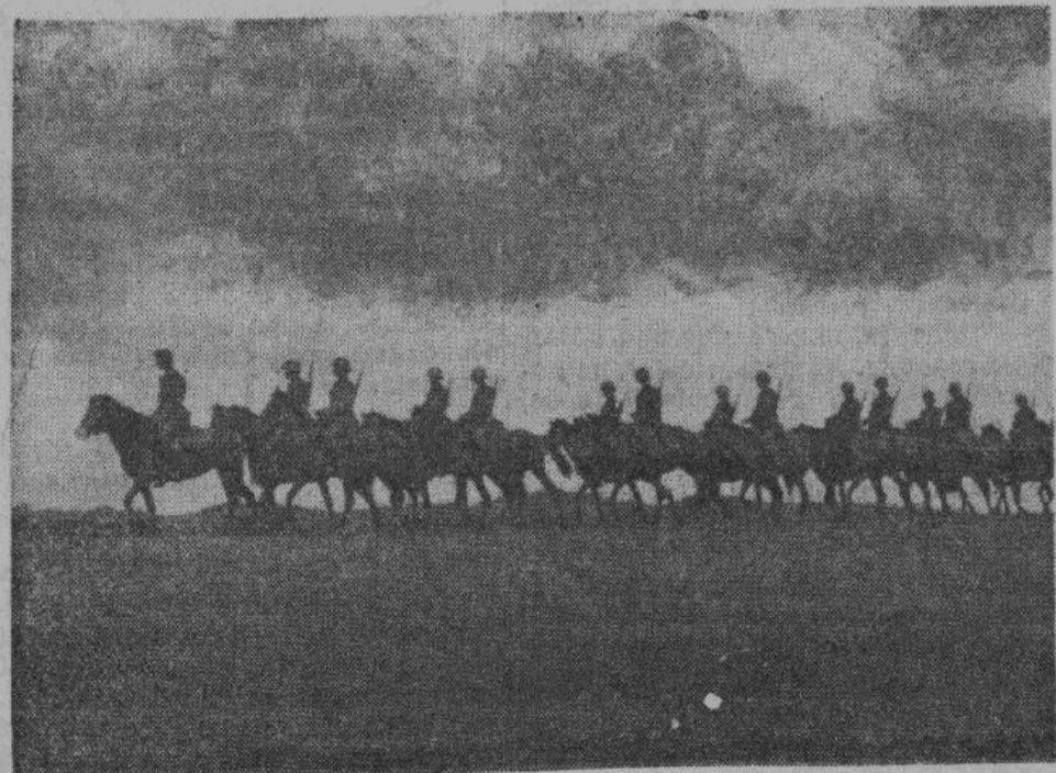
Боевое эскадронное подразделение русских добровольцев, выступивших на борьбу с врагом своей родины — большевизмом.