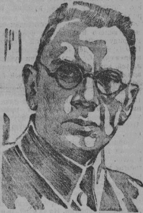
Генерал-лейтенант А. А. Власов.

Наличие комиссаров разлагало красную армию. Безответственность, слежка, шпионаж делали командиры