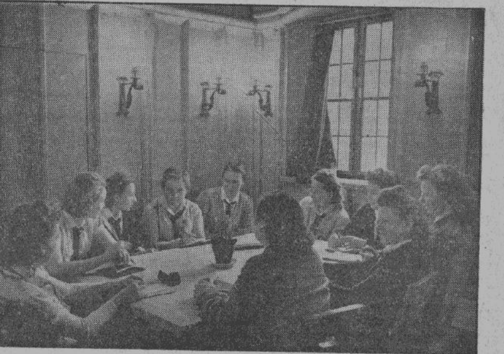
Будущие сестры милосердия. В связи с тотальной войной роль молодежи в Германии чрезвычайно возросла. Юноши и девушки добровольно вызываются помогать в работе взрослым в самых различных видах труда. На снимке — германские девушки слушают беседу об оказании первой помощи