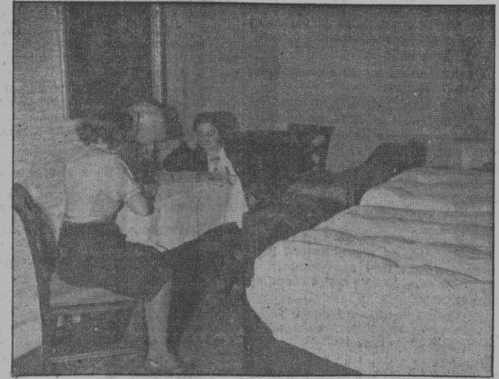
Во всех городах Германии устроены комфортабельные и удобные гостиницы для приезжающих. Комнаты обставлены со вкусом и украшены картинами и коврами. Все это доступно каждому путешественнику за очень незначительную плату. В таких гостиницах останавливались также члены учительской делегации во время поездки по Германии. На снимке — вечером, после осмотра города, учительницы отдыхают в своей гостинице

ноты, записные книжки, письма и вещи, принадлежавшие Моцарту, рассказывают посетителям о ярком таланте, уже в детстве порававшем мир своей феноменальной музыкальной памятью и виртуозной игрой на клавиатуре. Но тут же находятся источники, раскрывающие перед посетителем жизненные невзгоды Моцарта, которые довольно рано встретились на его пути. Интриги завистников, тяжелое материальное положение вынуждали его прерывать творческую деятельность и зарабатывать уроками, сочинением пьес для стеновых часов с музыкой, выступать на вечерах прихотливой аристократии.