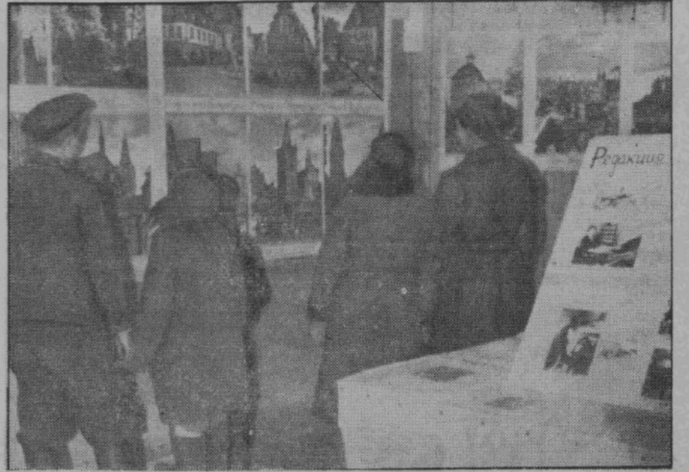
Большой интерес среди сельского населения вызвала выставка, устроенная в городе Дно под названием «Так работают германские крестьяне». Люди часами рассматривали хорошо сгруппированные снимки о жизни и работе германских крестьян. На снимке — вид выставочного помещения.