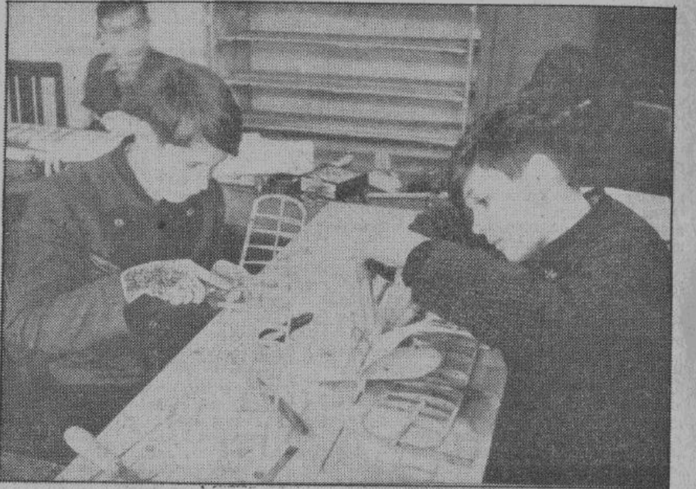
Будущие авио-конструкторы. Во время посещения основной школы мы с большим интересом наблюдали работу учебных мастерских, в которых учащиеся занимаются конструированием авио-моделей. Наиболее талантливые из юных моделестов, после окончания основной школы, будут продолжать профессиональное образование в авио-конструкторской школе.