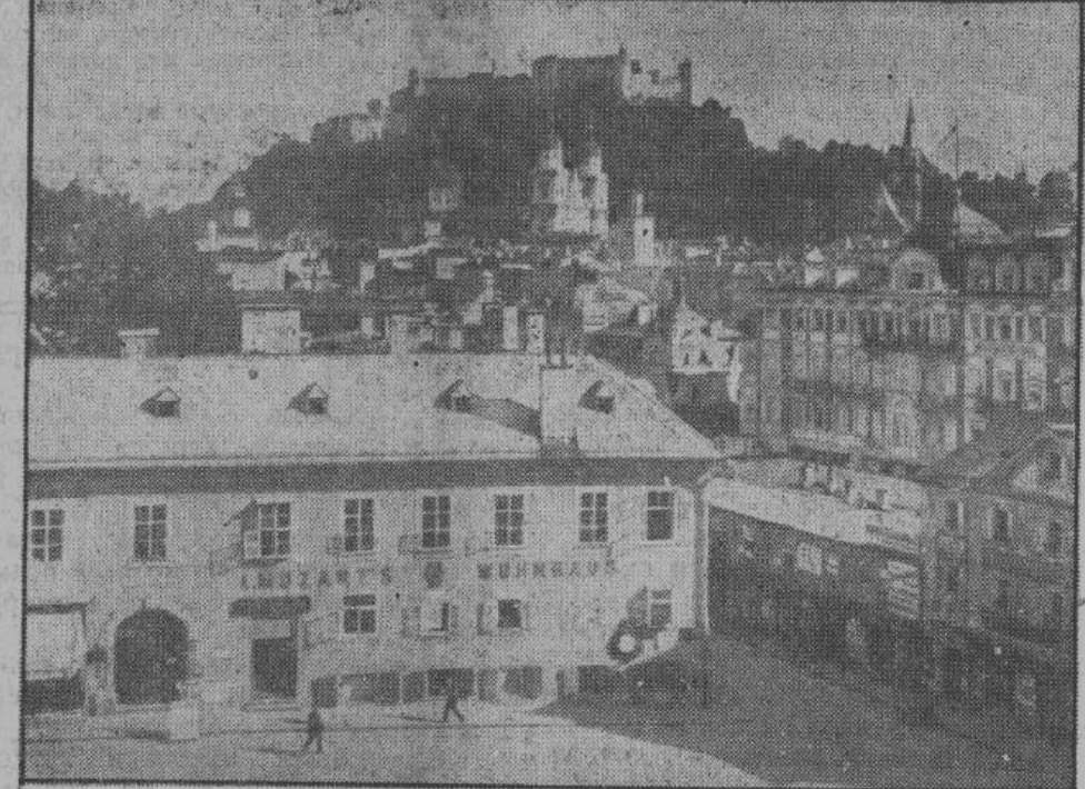
Зальцбург — один из самых красивых городов Остмарка, город музыки, прекрасных замков и церквей, являющийся родиной великого гения германской музыки Вольфганга Амадеуса Моцарта. На переднем плане виден дом, в котором в 1756 году родился великий творец «Волшебной флейты» и «Дон-Жуана». Отсюда чудесная музыка композитора распространялась по всему свету