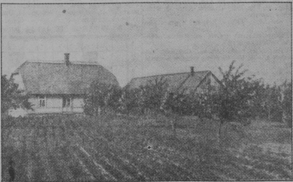
Общий вид усадьбы Калея, описанной в статье. Жилой дом и рядом с ним фруктовый сад, который является неизменным дополнением и украшением каждого латвийского хозяйства; на заднем плане — хозяйственные постройки