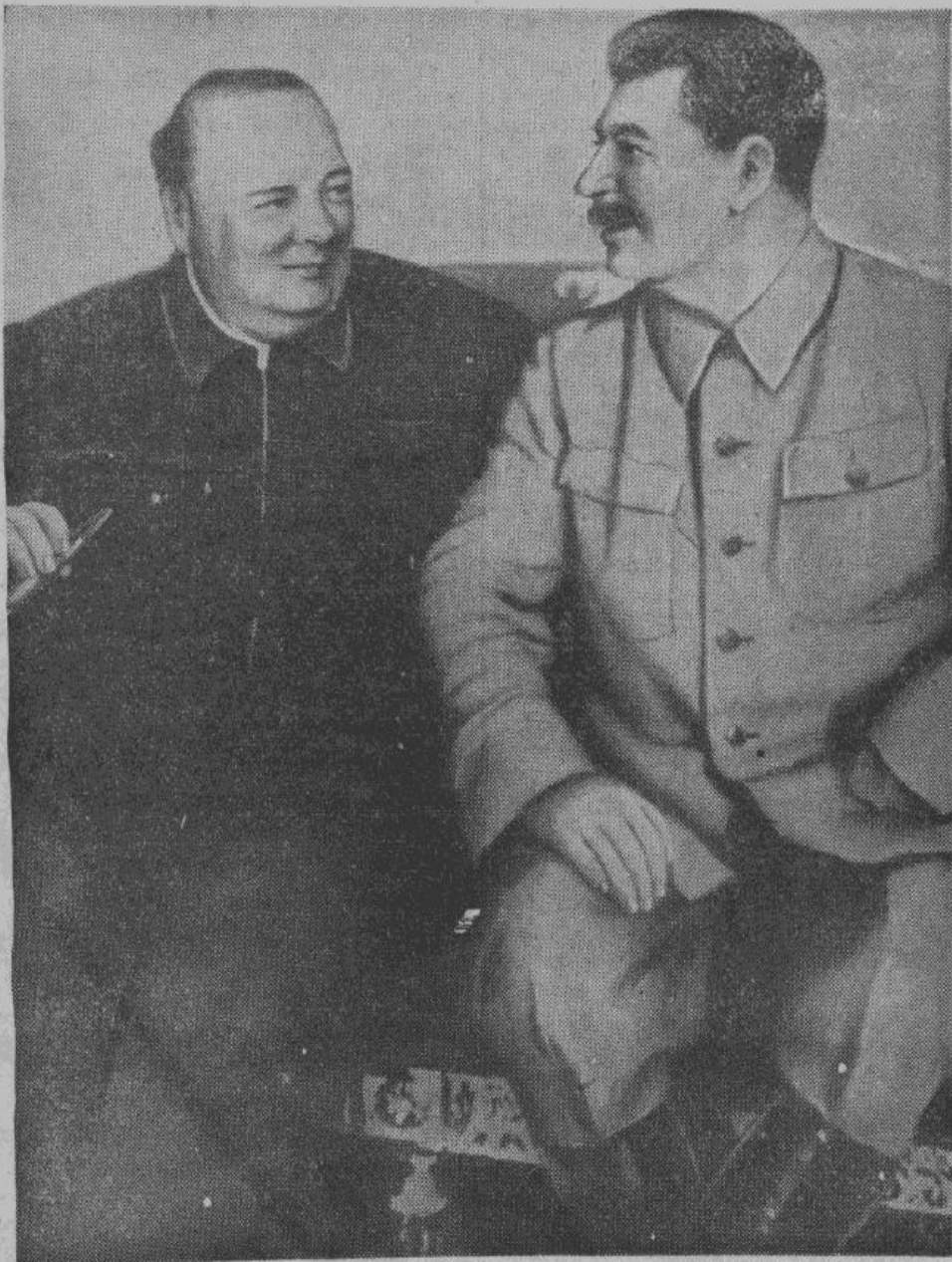
Этот снимок служит наглядным опровержением известной поговорки: «Гусь свинье не товарищ»