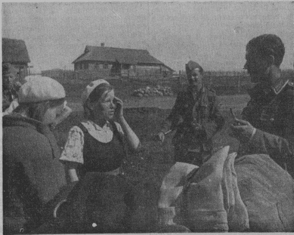
Жители прифронтовой полосы, бежавшие от большевиков, делятся с немецкими солдатами своими переживаниями.

Торжественную, поминальную речь произнес лютеранский епископ Латвии профессор Грикберг. После него возложили венки представители Генерал-комиссариата, Латышского легиона и многих общественных организаций. В заключение печального торжества, все присутствующие исполнили латышскую национальную молитву.