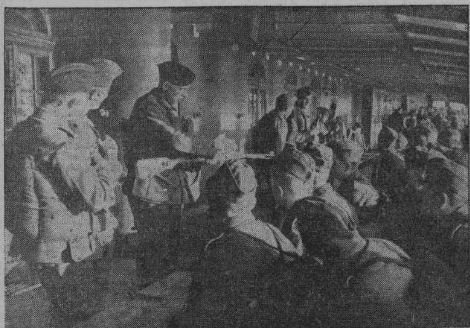
Суда германского торгового флота, превращенные в войсковые транспорты, совершают рейсы в области, занятые германской армией, перевоза войска, боеприпасы, материалы и провиант. На снимке — проверка знаний молодых солдат в освоении оружия