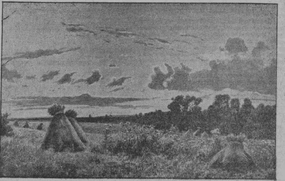
«Поле» (офорт) И. И. Шишкина