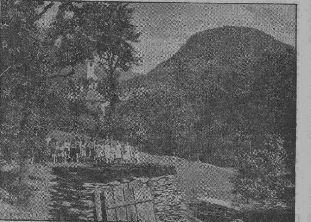
Десятки тысяч детей германских трудящихся ежегодно отправляются из городов на отдых на лоно природы. Это — истинный социализм!