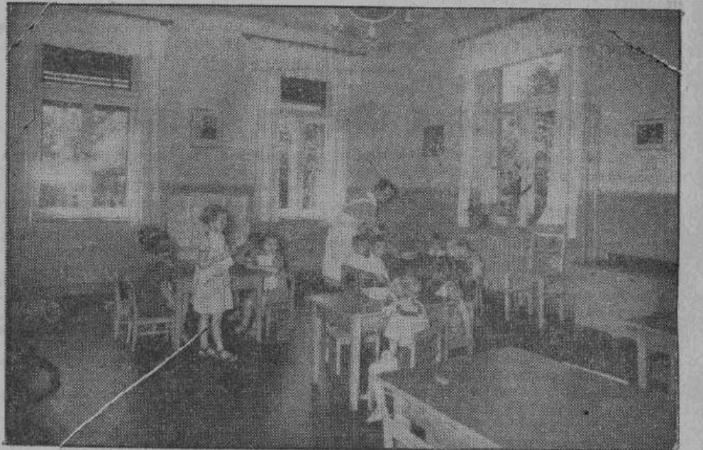
Многие матери работают или заняты по хозяйству, их любимцы пользуются внимательным уходом в тысячах детских садов. В светлых и просторных помещениях раздается радостный смех малышей