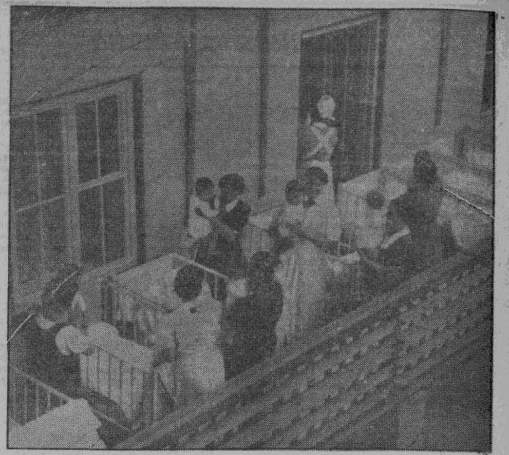
Домами отдыха германской национал-социалистической организации «Мать и дитя» пользовалось 625.000 матерей и 55.000 младенцев

Так весь германский народ заботится о здоровье немецкой матери и ее детей. И мы не сомневаемся в том, что после победы весь немецкий народ еще единодушнее прикинется к этому великому национал-социалистическому движению.