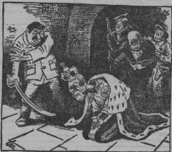
... и в ту же ночь Сталину приснился заманчивый сон.

Английский король подарил Сталину почетную саблю. (Из газет.)