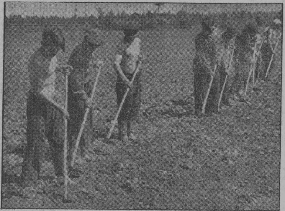
Чтобы получить хороший урожай, земля должна быть очищена от сорняков. Сорные травы и ползучие пашни — наследие, оставленное большевизмскими методами обработки земли. Необходимо приложить все усилия, чтобы вырвать или уничтожить хотя бы часть сорняков из засорившейся в течение многих лет пашни. На снимке — уничтожение сорных трав и взрыхление земли в одном образцовом хозяйстве в окрестностях Луги