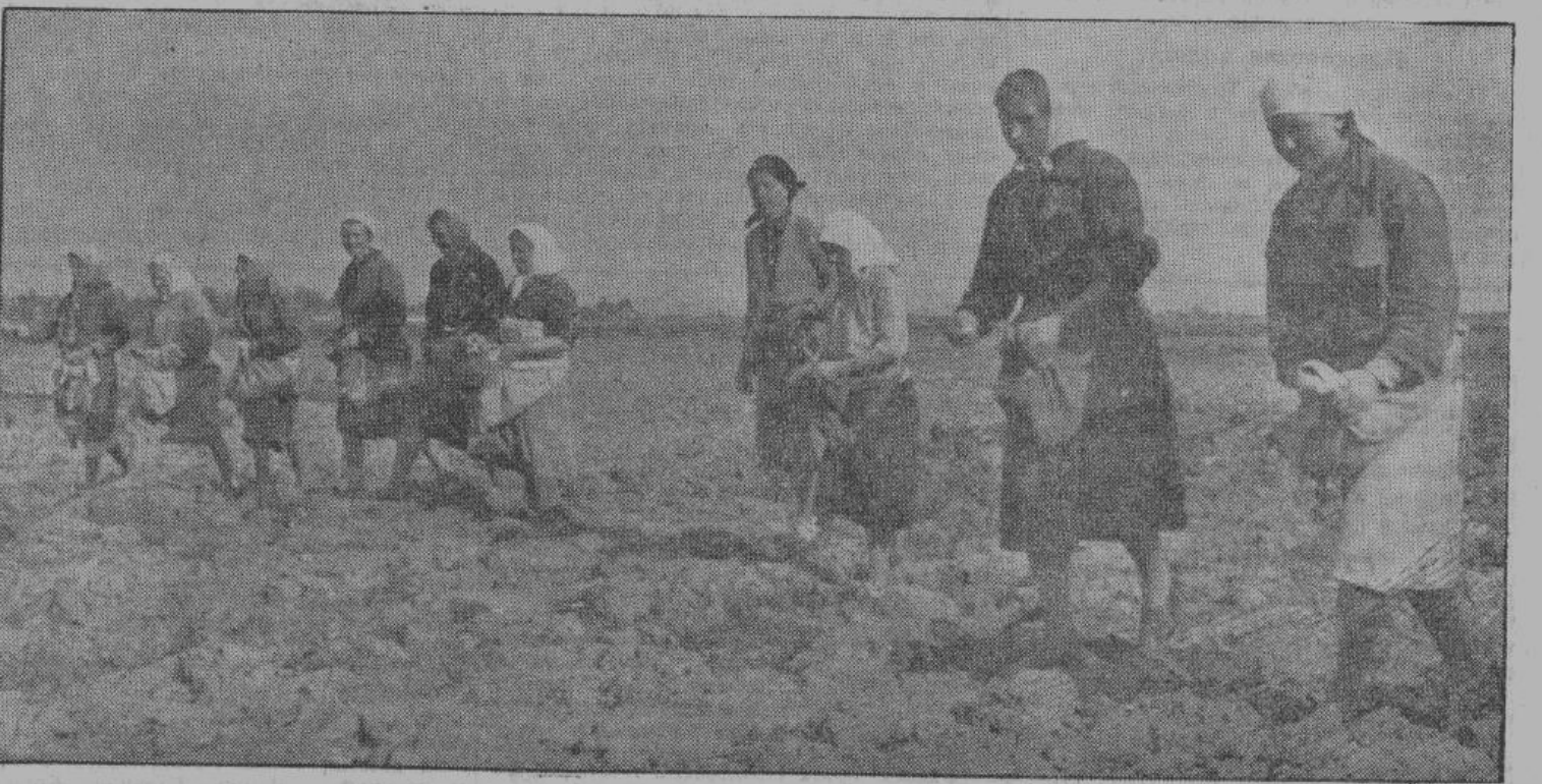
Во время большевизмской власти земля удобрялась очень скудно, а поэтому теперь вся земля, без исключения, нуждается в хорошем удобрении. Поставка искусственных удобрений в обстоятельствах войны сильно ограничена. Но уже в прошлом году крестьяне, сплошь и рядом, доказали, что они сами умеют изыскивать местные удобрения для улучшения своей пашни. Осенний урожай вполне вознаграждает их труды. И в этом году в еще больших размерах необходимо использовать все доступные крестьянам удобрения, как-то: ил, известь, торф, золу, перегнившие отбросы и т. д. На снимке — рассеивание искусственных удобрений в одном образцовом хозяйстве в окрестностях Луги