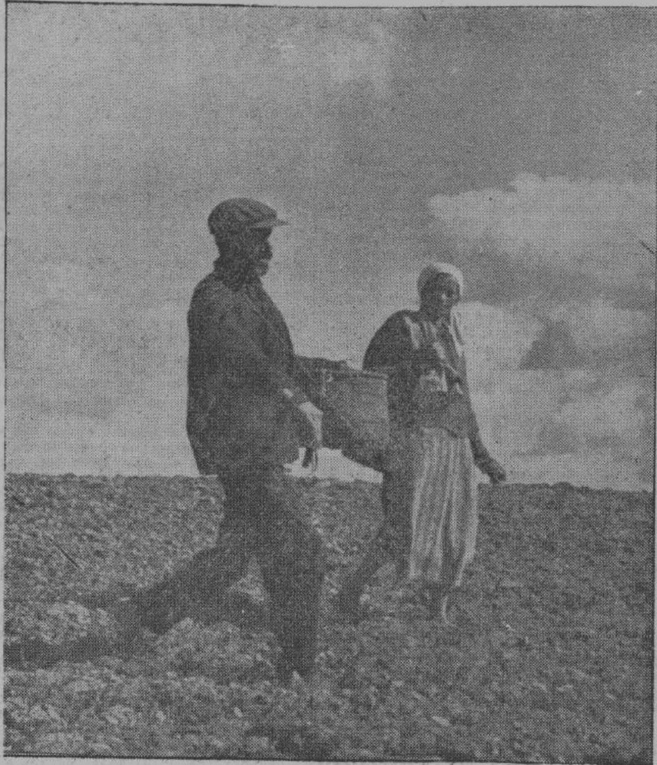
Скоро по нашим пашням пройдет пахарь со своим плугом и сеятель со своим лукошком. От доброкачественности и успешности этих работ зависит будущее нашего освобожденного народа. Прежде всего пахарь должен следить за тем, чтобы не осталась не вспаханной ни одна пядь родной земли, а сеятелю нужно знать, что каждое лишнее, тщательно посеянное зерно — залог его зажиточной жизни и оно придаст силу тем, кто борется или работает для борьбы с большевизмом. На снимке — сеятель со своей помощницей во время прошлогодней посевной кампании. (Псковский район)