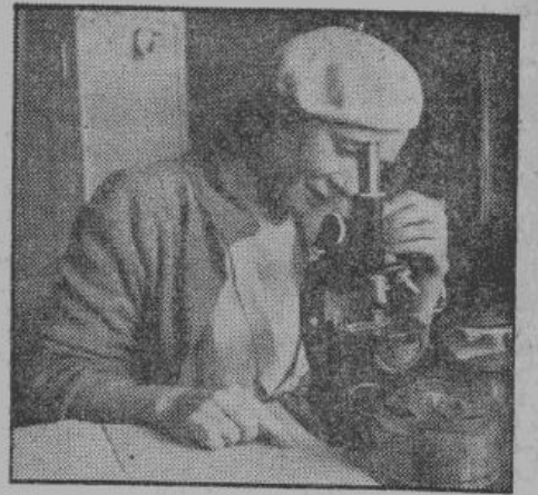
Чтобы получить хороший урожай, необходимо сеять чистыми, отборными семенами. Плохое семя, даже в хорошей земле, дает слабый урожай. Но из хороших семян, на сравнительно плохой земле, можно ожидать удивительного урожая. О доброкачественности семян, главным образом, должны позаботиться сами сеятель и, где только возможно, пользоваться услугами селекционных станций. На снимке — испытание доброкачественности семян в лаборатории на одной из селекционных станций

В прошлом году, крестьяне, несмотря на трудности, провели успешно сев и справились с уборкой.