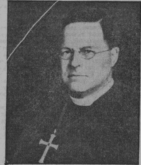
Епископ Кентерберийский — один из самых известных военных подстрекателей — является также величайшим противником социализма. Будучи владельцем многих лондонских трущоб, епископ наживается на нищете рабочих

Кто думает, что эти условия, царившие в богатой Англии, распадавшейся до начала теперешней войны, четвертью всей суши нашей планеты, теперь улучшились, совер-