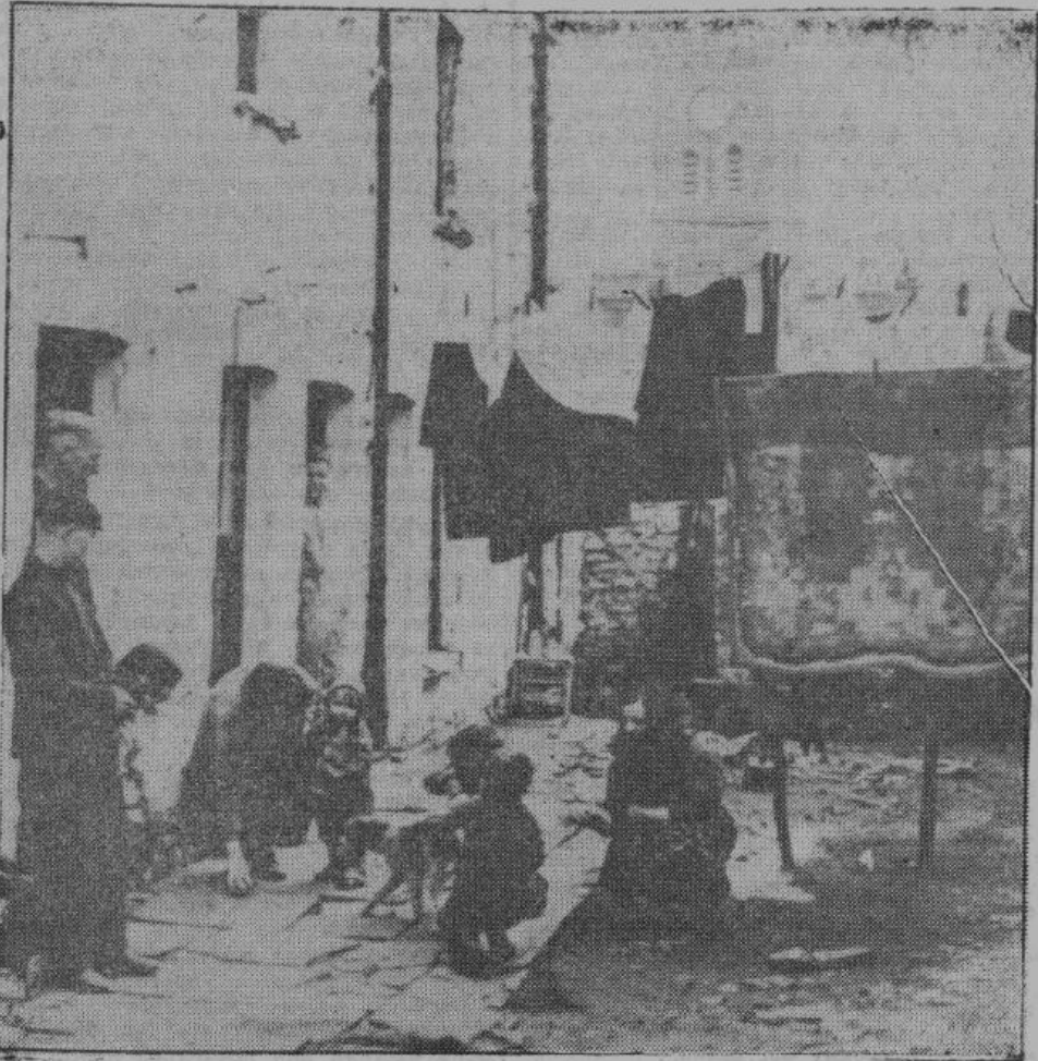
В то время, как в Англии существуют известные на весь мир поместья лордов и роскошно оборудованные особняки денежной аристократии, рабочие, за счет которых живут эти эксплуататоры, должны прозябать в нищенских трущобах