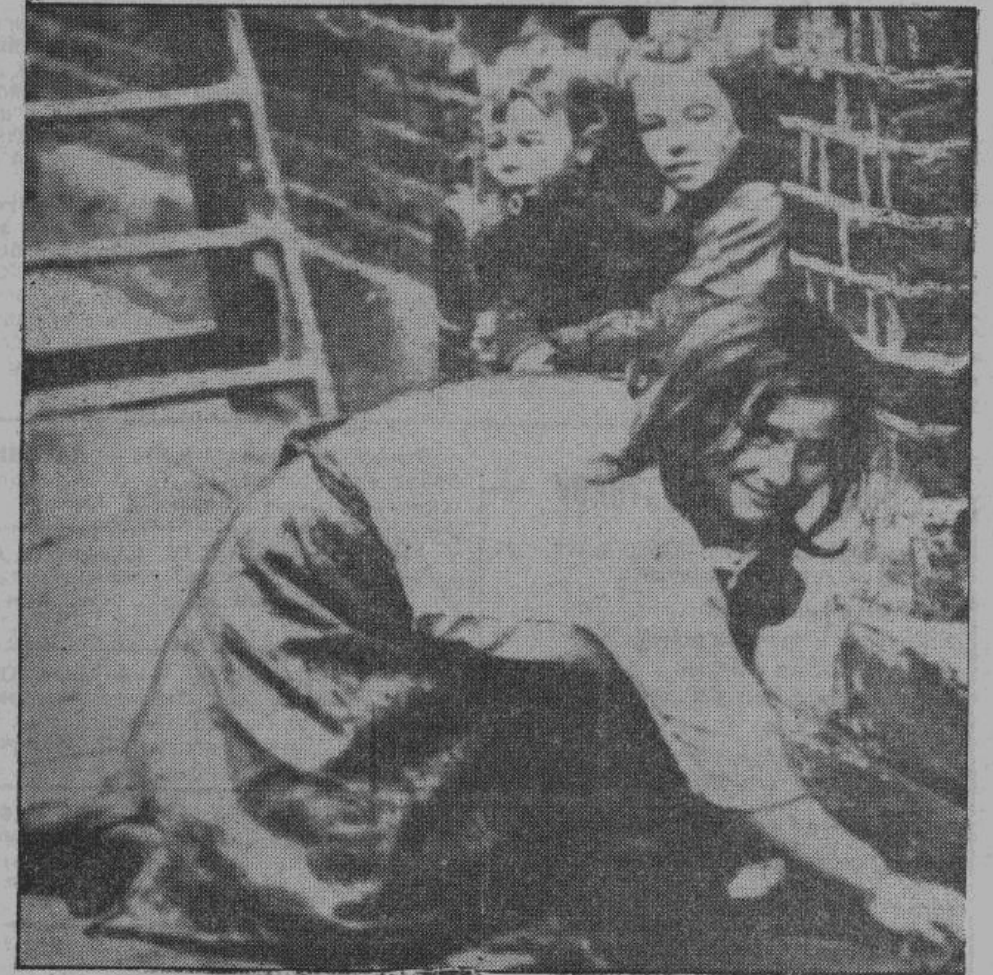
В темных дворах, среди грязи и мусора, в ужасных антисанитарных условиях, растет британская рабочая молодежь, в то время, как дети богатей в Гайл-Парке развлекаются верховой ездой или убивают время спортом в так называемых, университетских

Уже четыре поколения состоятельных англичан терпят в своих больших городах трущобный ад, эти рассказы нищеты, горя и преступлений. Нигде больше на свете, кроме только поработанной большевиками России, нельзя видеть нищету, горе и лишения в таких размерах. Но именно это и характерно для политических союзных систем плутократии большевизма, что они ничего не делают для ликвидации обнищания эксплуатируемых ими народов. Наоборот, они толкают их еще глубже в нищету. И если большевики когда-то пытались нам рассказать, что они являются смертельными заклятыми врагами капитализма, то пример сегодняшнего союза между Москвой и Лондоном показывает, что в этом нет ни капли правды. Они очень похожи друг на друга и результаты их хозяйничанья совершенно одинаковы: обнищание народов и их бессостынная эксплуатация.