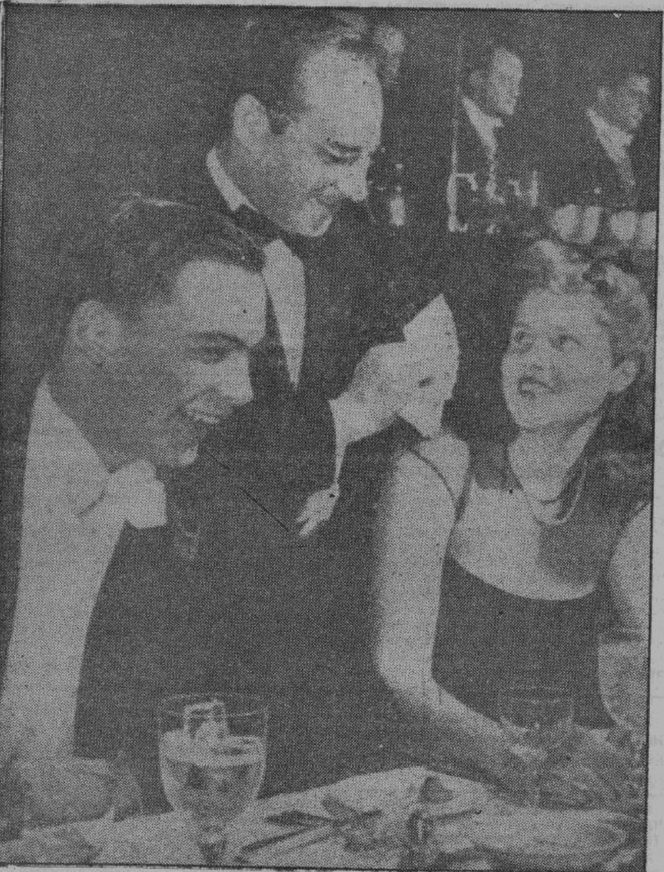
В то время, как британские рабочие нищенствуют, английское «высшее общество» во фраках и декольтированных вечерних платьях веселится в ночных клубах, проматывая там деньги, нажитые путем бессовестной эксплуатации людей.