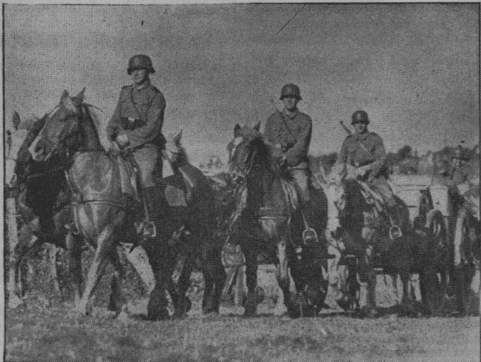
На фронте борьбы против большевизма во йсковые соединения с конной тягой стали повседневым явлением. На снимке — германская конная артиллерия, примененная в военных действиях на Востоке.