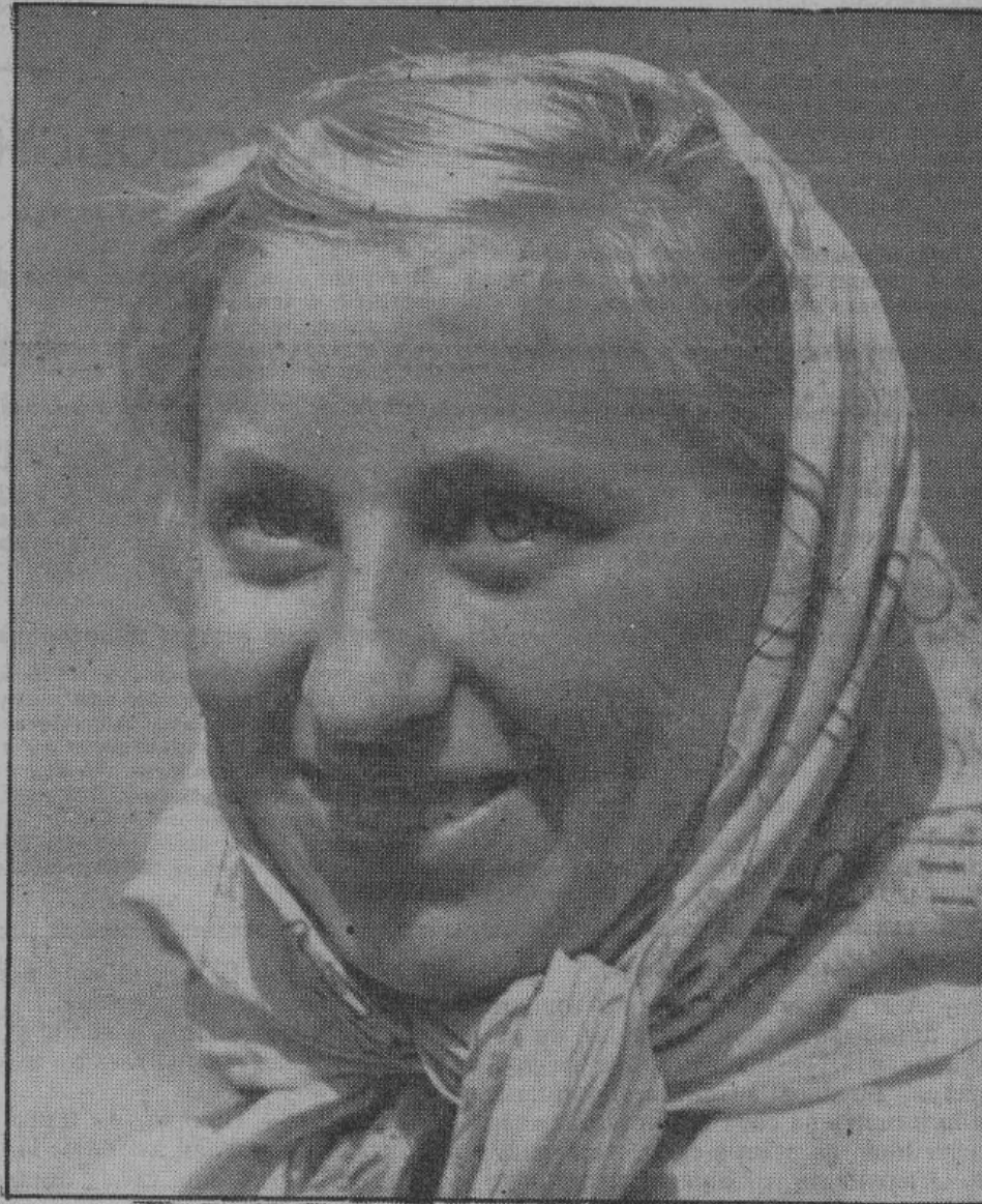
Радостно улыбается русская крестьянка, получившая, наконец, возможность обрабатывать свою собственную землю, после ликвидации колхозов