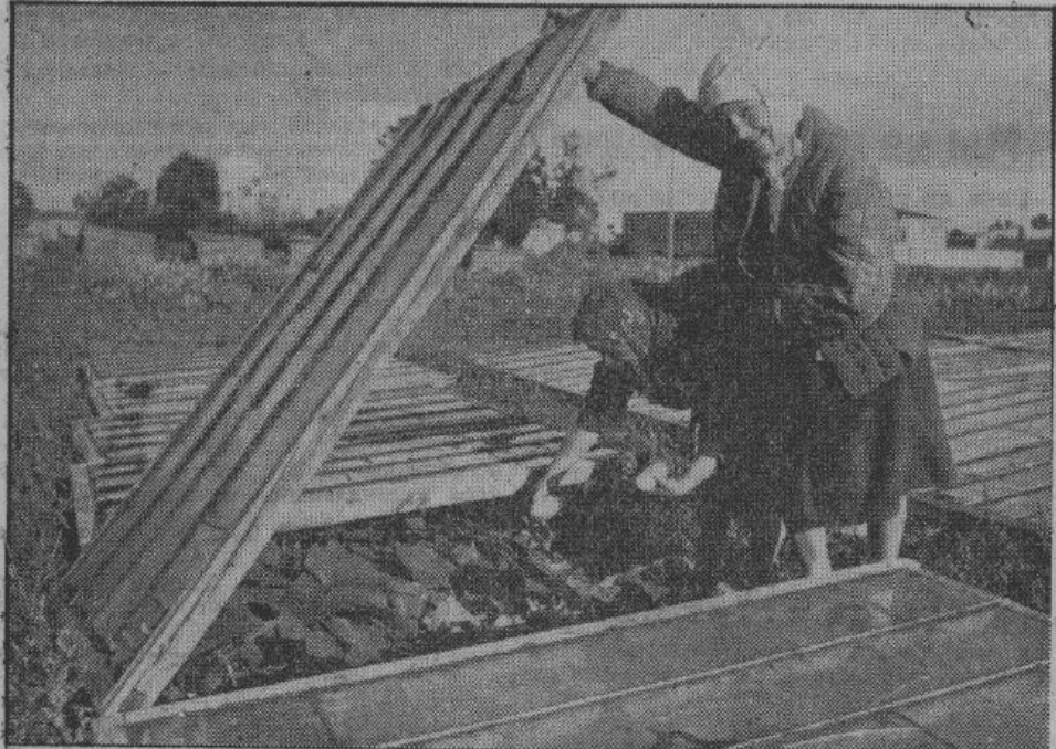
В городах и поселках парниковые хозяйства приступили к выгонке ранних овощей — огурцов и томатов. На снимке — работницы одного парникового хозяйства за сбором урожая огурцов