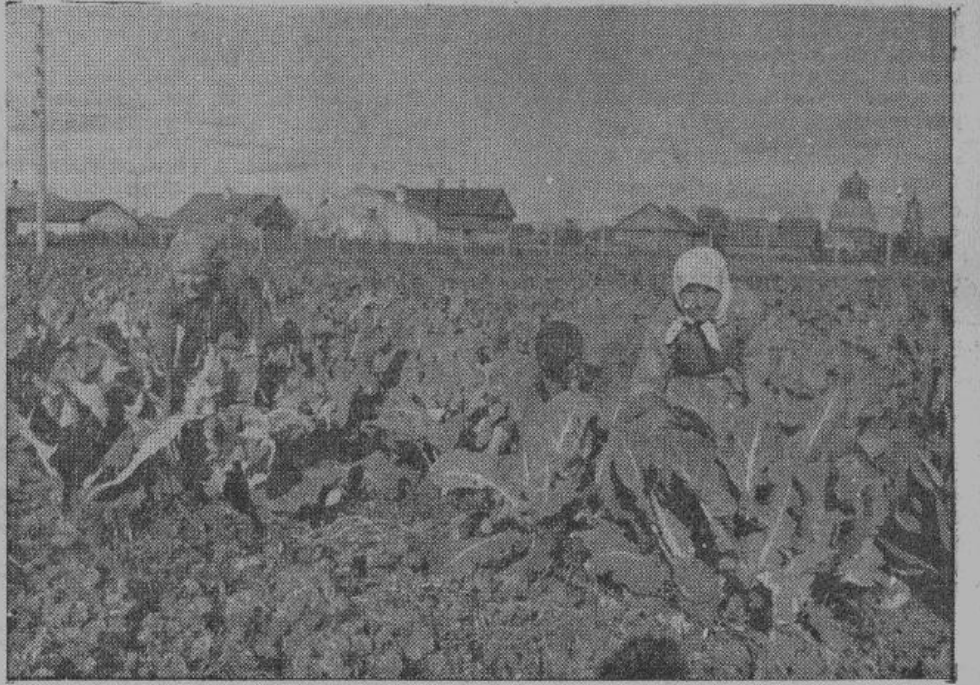
Цветная капуста — очень питательное растение, содержащее много витаминов и белков. Во многих пригородных хозяйствах в прошлом году она дала урожай в среднем от 10 до 15 тонн с гектара. На снимке — работницы одного из пригородных овощных хозяйств окучивают цветную капусту