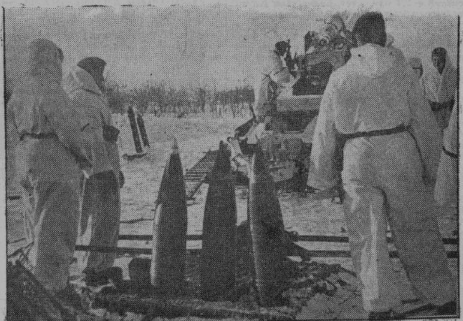
Тяжелые гаубицы германской артиллерии по приближающимся большевицким танкам и моторизованным колоннам открыли уничтожающий огонь, корректируемый наблюдателем с аэростата.