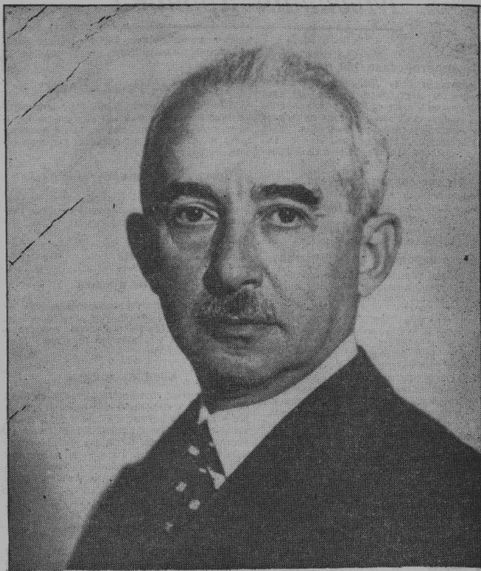
Президент Турции Исмет Иненю, в свое время бывший одним из ближайших соратников Кемала Ататюрка. Иненю противостоял всем угрозам Москвы и Лондона и — с целью сохранения нейтралитета — договором закрепил дружбу Турции с Германией.

Этот новый закон является для всех, живущих в Турции жидов тяжелым ударом, от которого они вряд ли оправятся. Такими драконовскими мерами турецкое правительство достигло спокойствия и укрепления стабильности политического и жизненного стандарта в стране. Предпринятые Турцией меры доказывают глубокое понимание турецким правительством политики Новой Европы. В Новой Европе у Турции, как связующего звена с Азией — большая будущность. Этим объясняются дружественные отношения между Германией и Турцией. Всем известна фраза, сказанная вышедшим в отставку турецким министром-президентом, Рефик Саидом: «Как я могу желать поражения Германии, когда она является лучшим покупателем наших товаров».