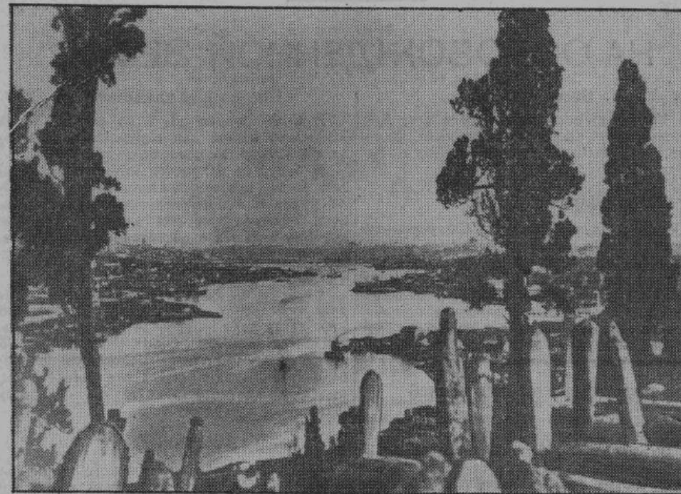
Дарданеллы. Как известно, они по международному договору закрыты для прохода военных кораблей. В течение этой войны это имело большое значение, т. к. сильно стеснило действия советского флота в Черном море.