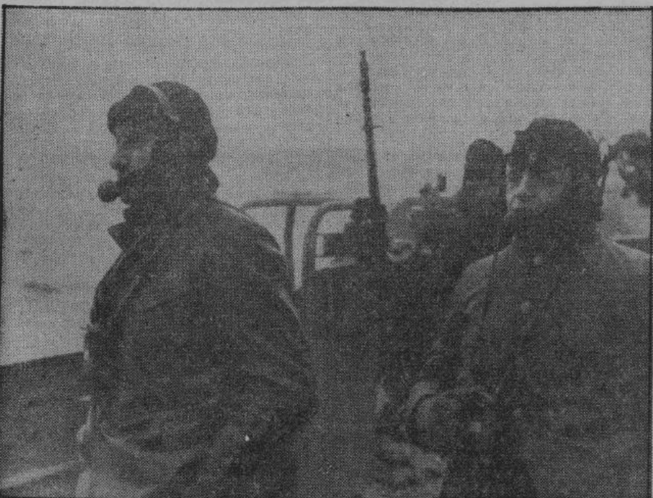
Оперирова на всех морях, нападая на вражеские суда и конвоируя караваны транспортных кораблей, канонерки германского военно-морского флота являются незаменимым оружием в борьбе с врагами держав Оси. На снимке — экипаж канонерки передает приказы с командного поста.

от НАШЕГО СПЕЦИАЛЬНОГО КОРРЕСПОНДЕНТА В. МАСЛОВА