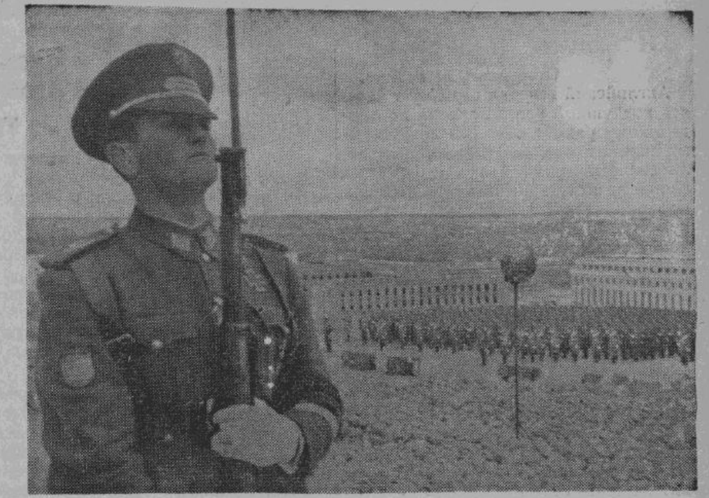
Парад испанских войск в Мадриде на площади, так называемого университетского городка, полностью разрушенного во время гражданской войны 1936/37 г.

Второе сильное наступление большевики предприняли в районе прежних боев — юго-западнее Днепропетровска, где после