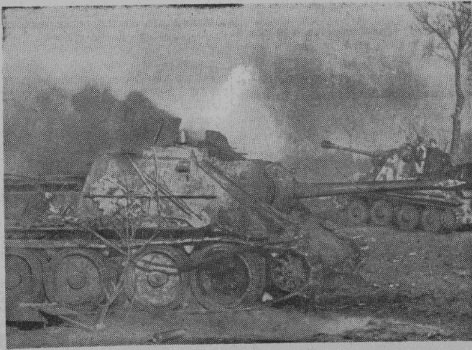
У главной дороги Житомир—Коростень повсюду лежат разбитые и выгоревшие советские танки.

ног, а в дни первомайских и октябрьских парадов и демонстраций оглашающему воздух приветствиями «гениальному» Сталину.