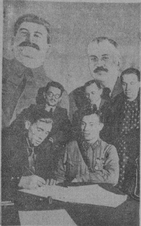
Комиссия по вынесению приговоров.

В годовщину этого дня вся страна оплакивает погибших или пропавших без вести и возносит молитвы об их спасении и возвращении на родину.