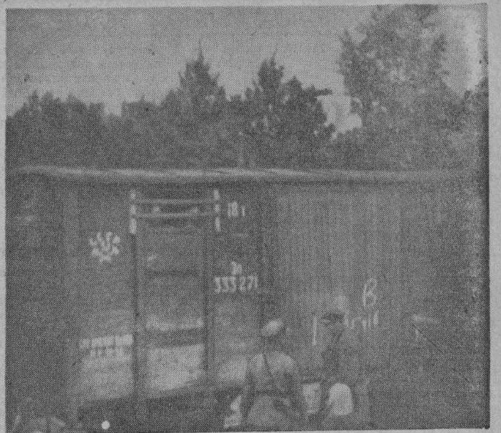
Товарные вагоны, в которые НКВД сгружал свои жертвы