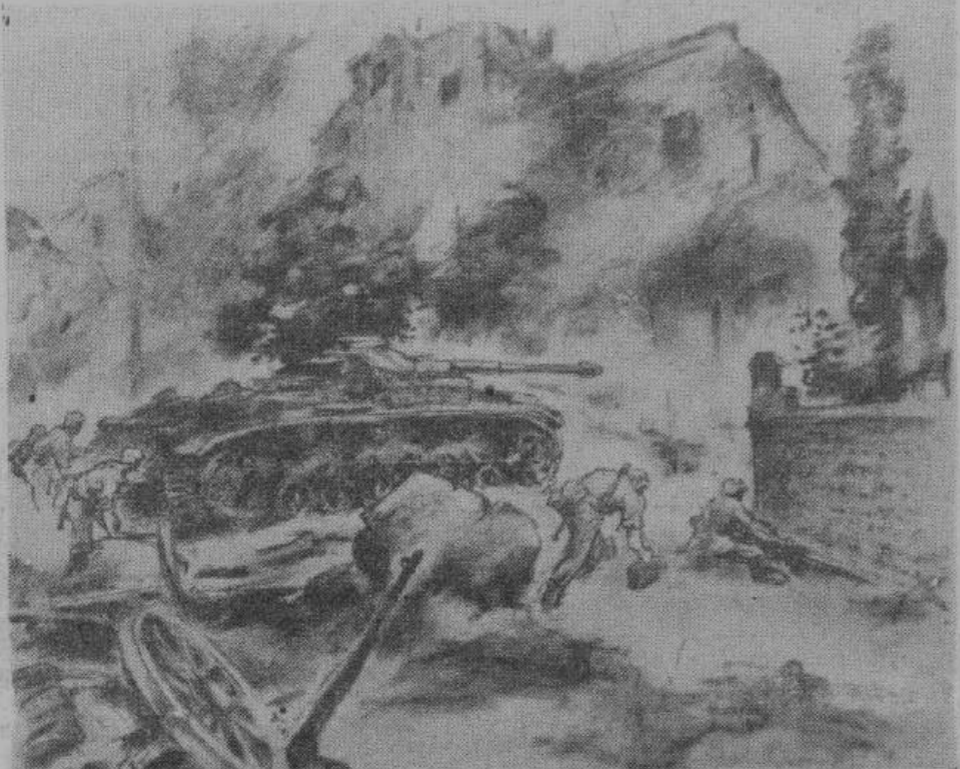
Рисунок военного корреспондента изображает момент начала германской контратаки на окраинах города Байе.

Спустя непродолжительное время, английский десантный отряд был уничтожен.