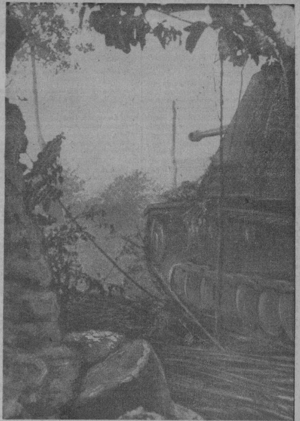
Немецкое самоходное танковое орудие, так называемый, «Шмель» на боевой позиции у берегов Ламанша.

Третья группа японских войск, обойдя озеро Тунгтинг, захватила город Лунгян.