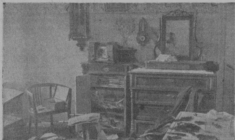
В этой комнате был обыск НКВД...

— Это было ровно два года тому назад. Наша страна была тогда оккупирована большевиками. Все мы жили в постоянном страхе и даже простые рабочие, ложась спать, никогда не знали, что их может ожидать утром. По городу упорно ходили мрачные слухи о застенках НКВД, пытках, расстрелах, но только никто ничего не знал, да и говорить об этом было как то опасно.