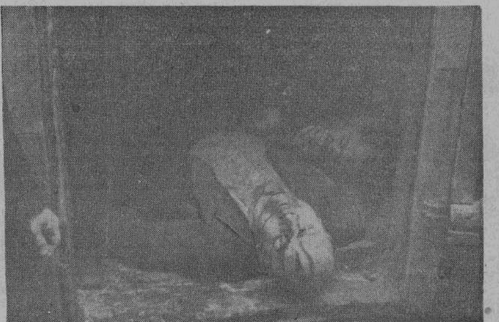
Такая участь постигала тех, кто оказывал хотя бы малейшее сопротивление