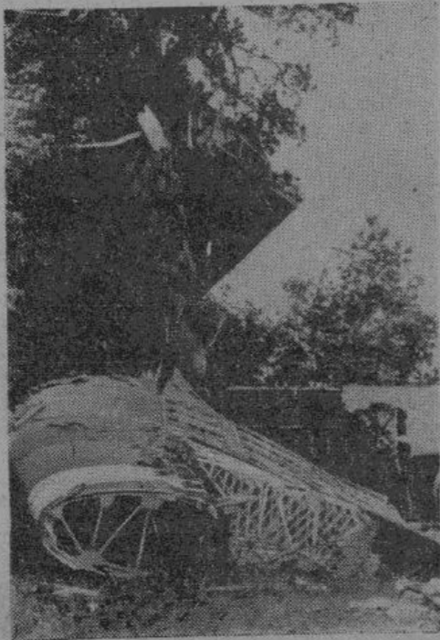
Разбитый американский планер.

Противник на этот раз, как и всегда, однако, своевременно забывает свою основную цель, и теперь уже начинает рекламировать свои территориальные приобретения. Из этого можно заключить, что в стане большевиков дают себе отчет в неосуществимости вождельных стратегических целей и поэтому хотят успокоить себя некоторыми тактическими успехами. Само собой разумеется, что оборонительное сражение потребует с германской стороны не малых усилий и жертв. Совершенно не следует преуменьшать напряжение советских сил. В первую очередь, это было бы несправедливо по отношению к германским армиям, непрерывно ведущим ожесточенные бои.