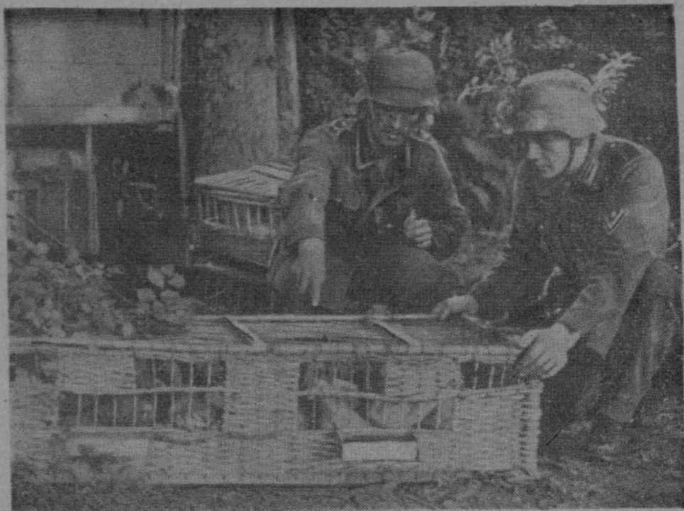
Почтовые голуби оказывают немалую помощь германским частям на фронте вторжения.