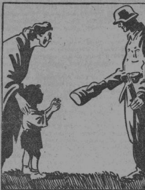
1940 г. — Противник.