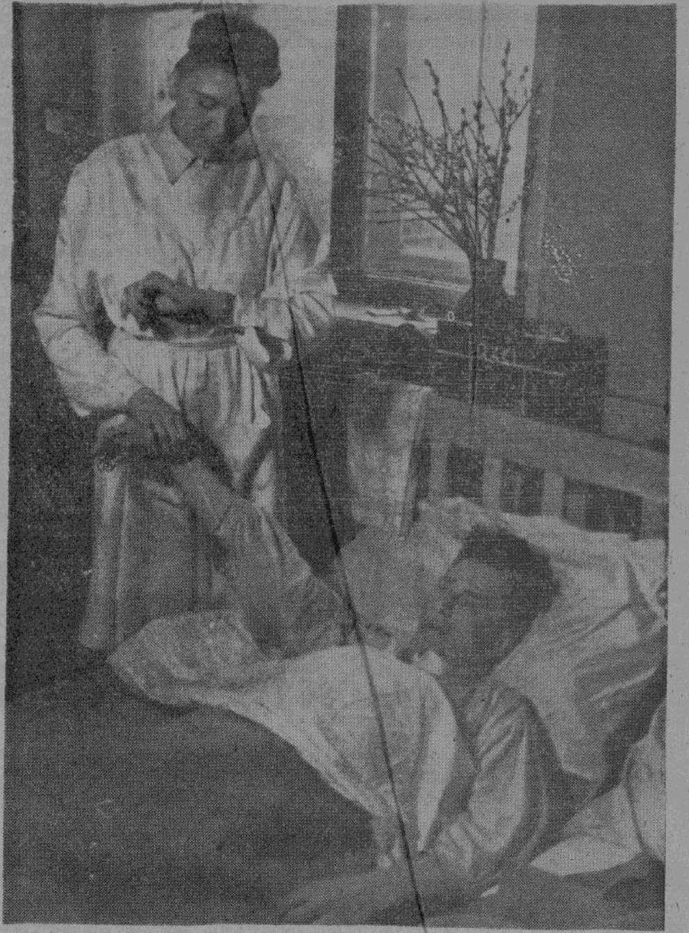
Сегодня пуле значительно лучше.