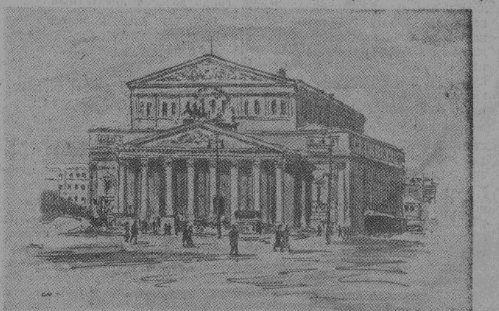
Большой оперный театр в Москве.

И как, говоря о Москве, не вспомнить нас с чем несравнимого чувства радости возвращения в нее после кратковременной отлучки, особенно в зимнее время? Первое ощущение одной Москве свойственного запаха березовых дров; торговля о цене со стоящи-