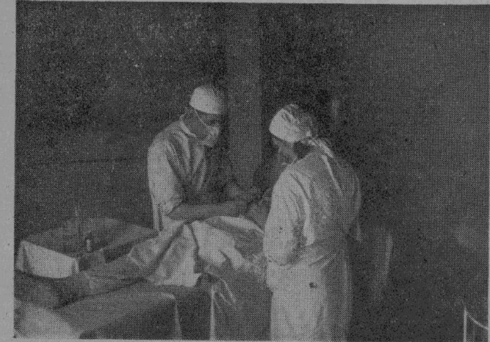
Жизнь будет спасена.

благородный дух боевого и трудового содружества здесь, в лазарете, находит свое проявление в таких, например, фактах, как переливание крови немецким солдатом тяжело раненным русским добровольцам и от добровольцев — немецким солдатам.