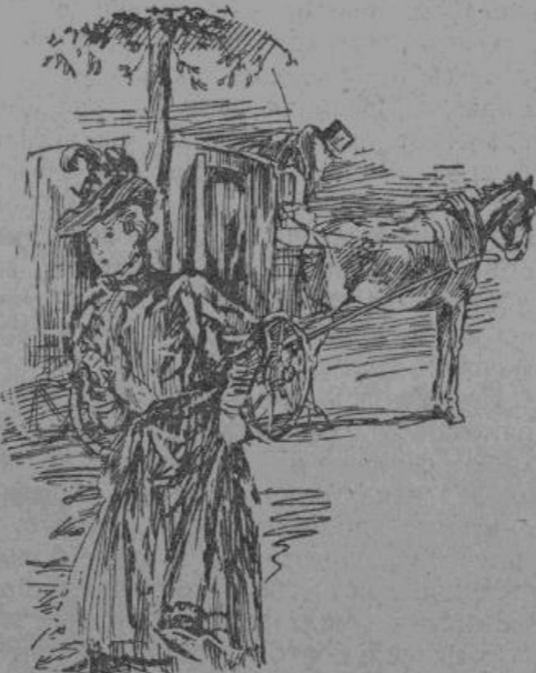
— Подождите меня здесь...