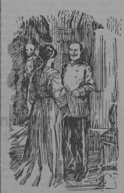
Если вам нужен будет защитник, то обращайтесь ко мне...

Профессор вздрогнул. — О нет, Ольга, ради Бога, не так