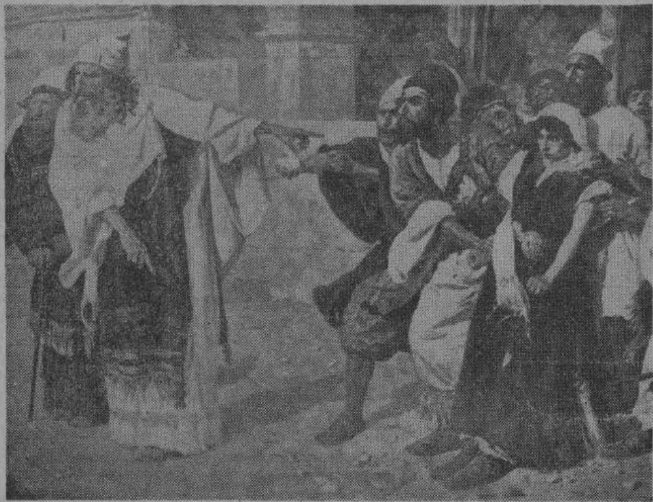
В. Д. Поленов. — Фрагмент картины. «ХРИСТОС И ГРЕШНИЦА».