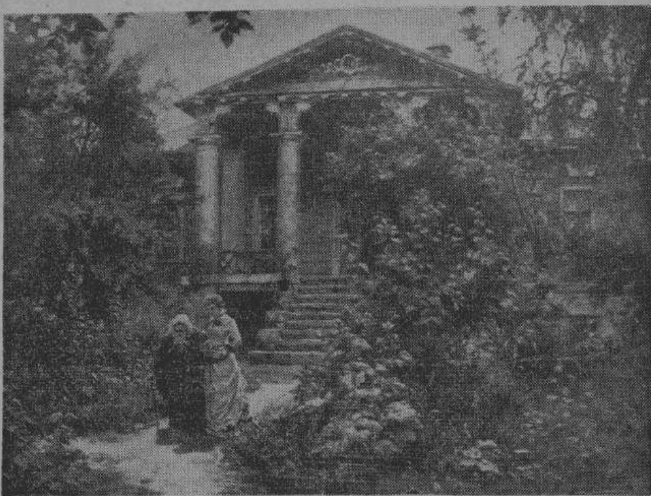
В. Д. Поленов — «БАБУШКИН САД».