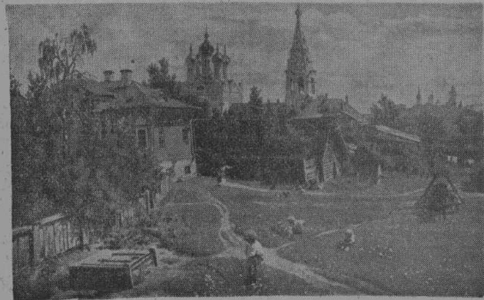
В. Д. Поленов — «МОСКОВСКИЙ ДВОРИК».