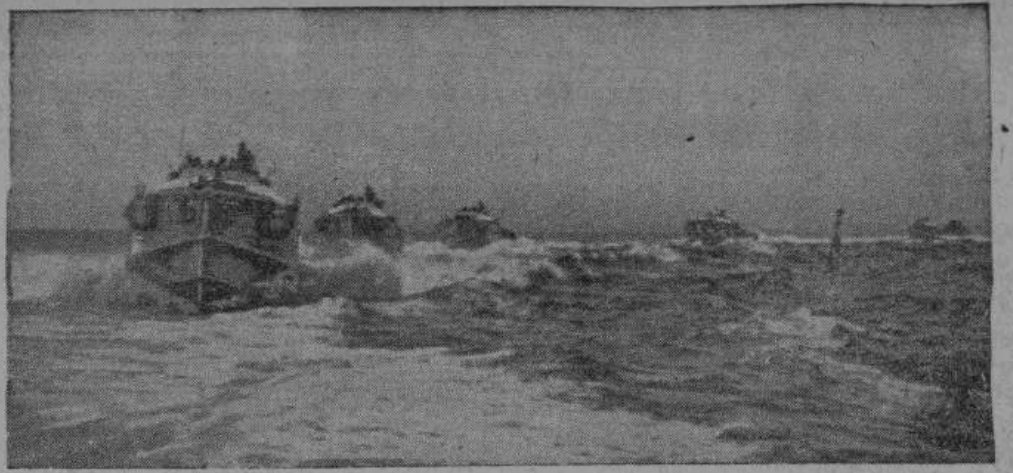
Быстроходные германские катера непрерывно наносят удары по вражескому флоту вторжения.

Русская ежедневная газета. Главный редактор Анатолий Стенрос. Редакция: Рига, ул. на Рихарда Вагнера 57. Из освобожденных областей следует писать в газету через Центральную Русскую Почту: Feldpost Nr. 39609 Ru (З. В. Р.) «За Родину». Подписка принимается во всех почтовых отделениях по стандартное объявление 30 руб.) посылать почтовым денежным переводом по адресу: Postscheckamt Riga, Konto 337 («Sa Rodinu»)