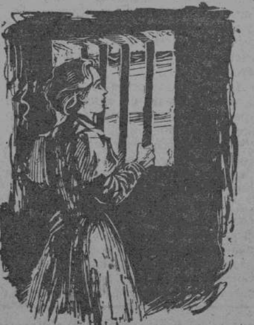
Три месяца продолжалась пытка одиночного заключения.

га жестокие угрозы и отвечала одной и той же неизменной фразой: