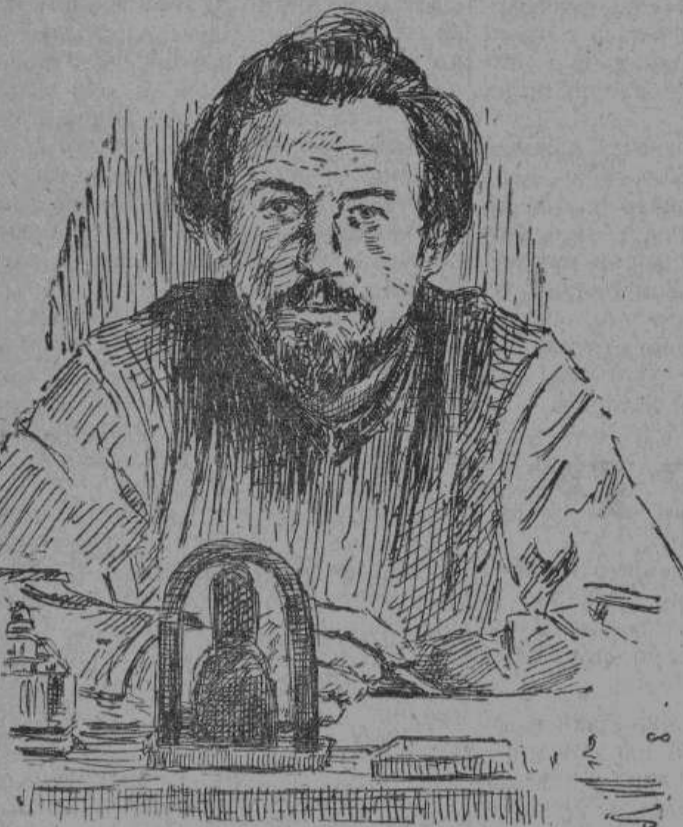
А. П. Чехов в конце восьмидесятых годов

Чехов — это совесть русской интеллигенции, и то, что он затронул в своей драматургии, было близко чаяниям и надеждам тогдашнего русского культурного общества, и нет ничего удивительного в том, что пьеса «Чайка» несовершенная по форме, которую даже режиссер К. С. Станиславский принял в репертуар недружелюбно, не находя в ней драматургической сути, не видя в ней действия, была принята публикой МХАТ-а тепло и восторженно.