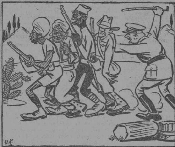
— Вперед, мы освобождаем Европу!

«Освободительная» армия англичан, посланная в Европу, в частности в Италию, состоит, главным образом, из индусов, марокканцев, сенегальских негров и новозеландцев, которым глубоко безразлично европейские дела и многие из которых используют свое пребывание в оккупационных областях для личной наживы, что выражается в примитивных и неприкрытых грабежах и насилиях над мирным населением.