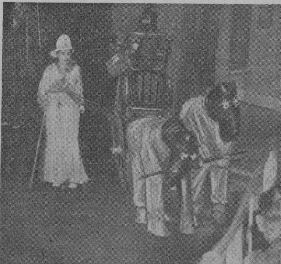
Сектантская проповедница «освящает» помещение команды добровольных пожарных. Бутафория этого «священнодействия» наглядно свидетельствует о балаганном нраве американских проповедников.

«Добро» победило. Прихожане довольные расходятся по домам, не забывая оставить привратнику десятку на нужды «храма».