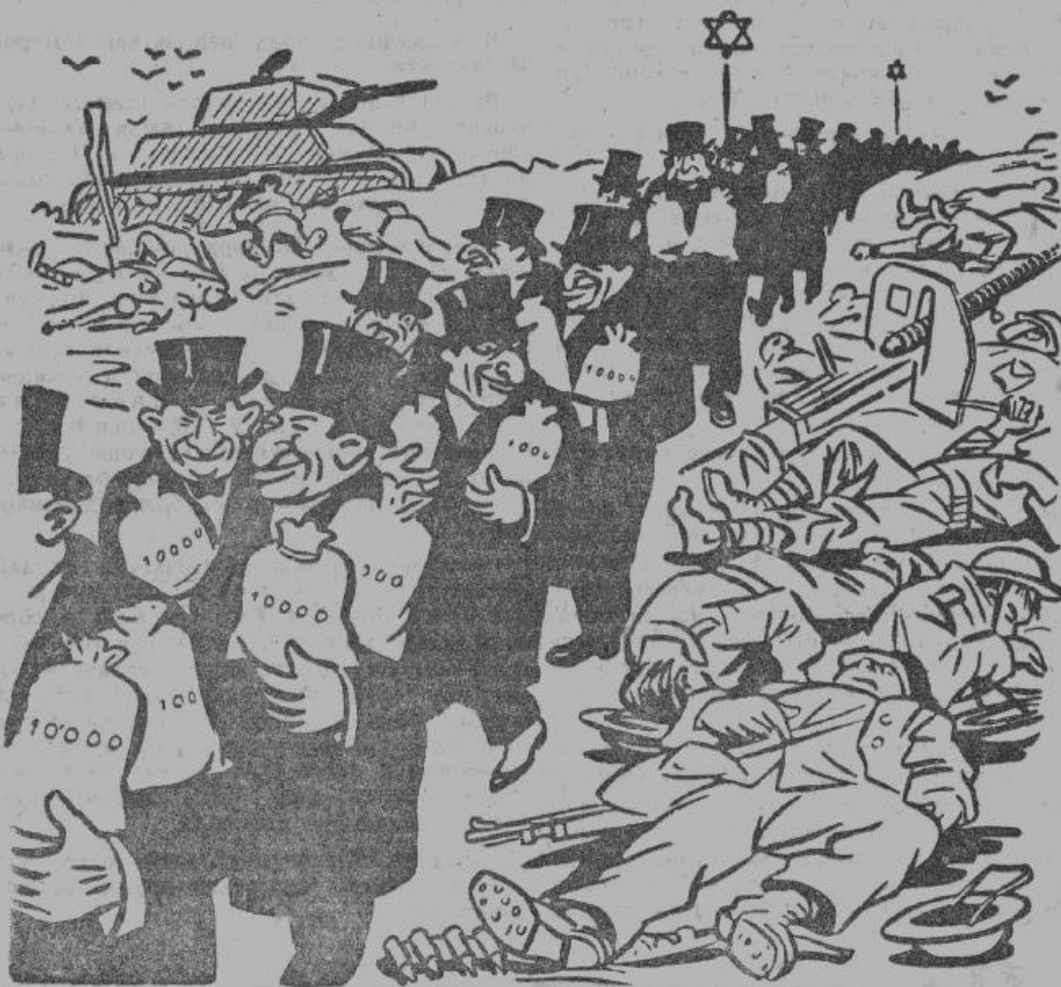
— «Красное море», это же кровь говей!