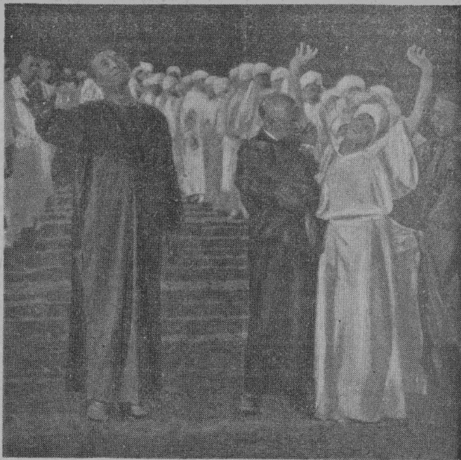
«Богослужение» негритянской секты.

Это лишь только два небольших примера причудливостей, до которых доходят американские секты. Пере-