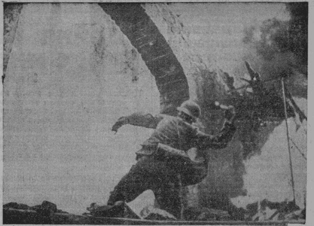
Германский гренадер ручными гранатами отбивает атаку противника на западном фронте.

Русская ежедневная газета. Главный редактор Анатолий Стенос. Редакция: Рига, ул. Рихарда Вагнера 57. Из освобожденных областей следует писать в газету через Центральную Русскую Почту: Feldpost Nr. 39609 Rv (Z. R. P.) «За Родину». Подписка принимается во всех почтовых отделениях по месту жительства. Плата за подписку — 12 руб. в месяц.