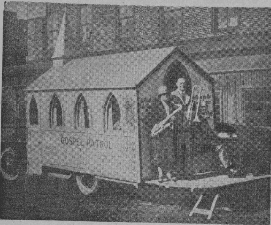
Баптисты рекламируют свою церковь. Декорированный автомобиль, под громкие звуки джаз-бэнда, вербует прихожан.

глобно все мужское население, не исключая и грудных детей.