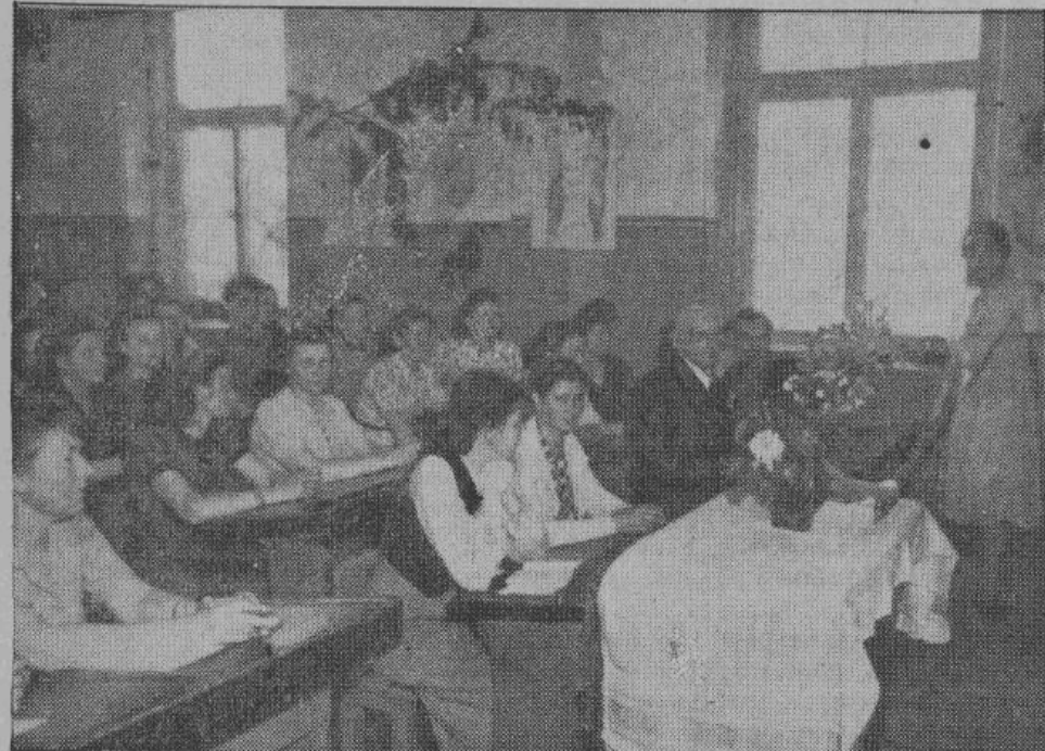
На торжественном открытии курсов

Неизвестно, сколько времени проходит с той минуты. Но первое ощущение, которое испытывает очутившийся солдат — это прикосновение ласковых заботливых рук. Он пытается пошевелиться и начинает чувствовать боль во всем теле. А заботливые руки удерживают его, и какой-то далекий, но такой родной и знакомый голос говорит: