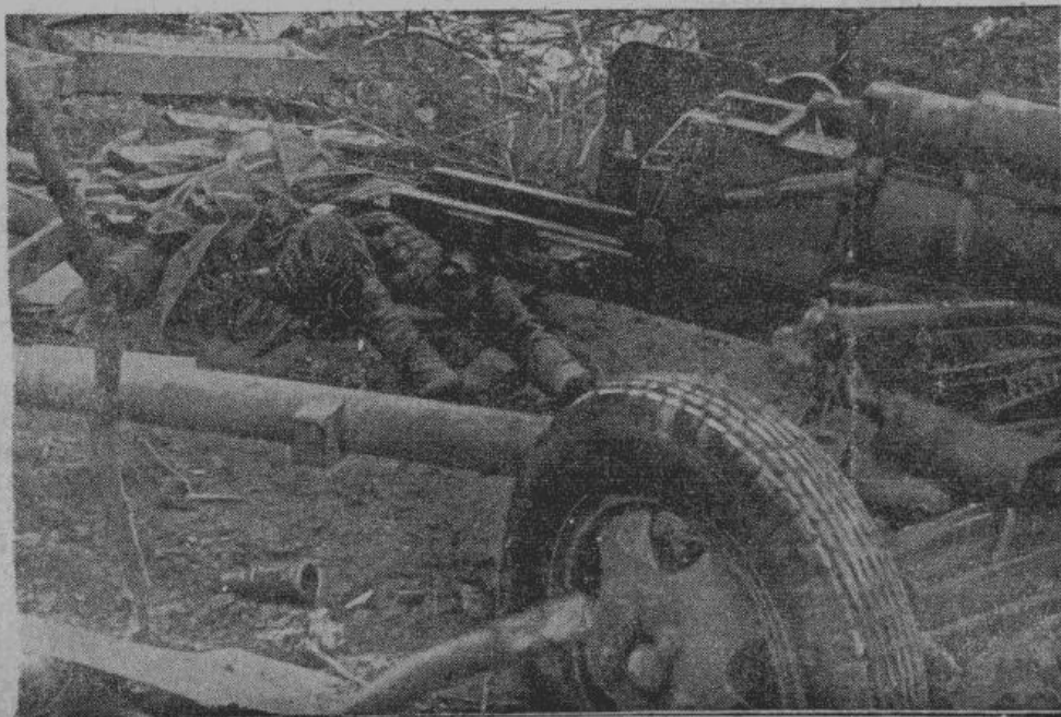
Разбитая советская батарея на одном из участков восточного фронта.