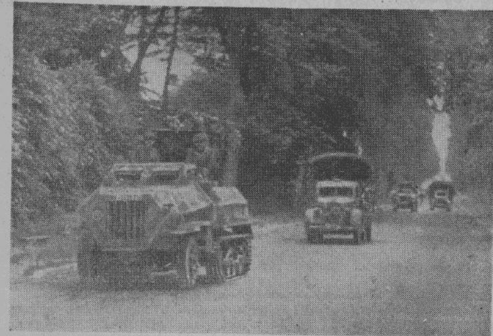
Непрерывной вереницей, подвозя оружие и аммуницию, движутся грузовики по дорогам западного фронта.