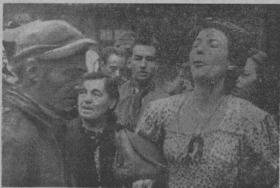
Французское население не скрывает свое враждебное отношение к англо-американским «освободителям».

Неуспех армии вторжения вполне понятен. Даже опытному стратегу нелегко развернуть для наземных операций только что высадившуюся десантную армию. В таких случаях инициатива почти всегда остается на стороне обороняющихся. Армии вторжения приходится принимать бои в тех местах, где это выгодно германскому руководству. Для того, чтобы преодолеть сопротивление обороны, обладающей сопротивлением обороны, обладающей инициативой боя, надо располагать закаленной в боях армией и, прежде всего — талантом