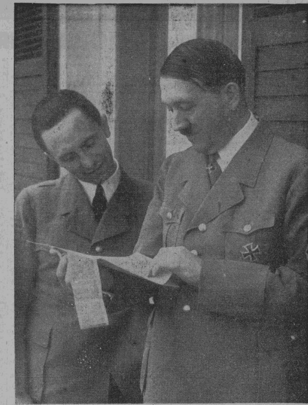
Фюрер Великогермании Адольф Гитлер и рейхсминистр д-р Геббельс

Разрешите мне не касаться дальнейших подробностей. Они настолько поворны для изменников, что могут только внести путаницу в изложение фактов. Важным кажется мне лишь то, что войско само ликви-