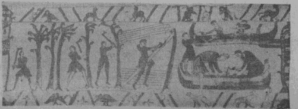
Фрагмент ковра из Байо: постройка нормандского флота.

Англичане же не пощадили на исторической реликвии, ни гробниц родоначальников своего королевского дома. Огнем англо-американской артиллерии разрушены монастыри Сан-Этьен и «Ла Тринит», где были погребены Вильгельм — король английский и королева Матильда.