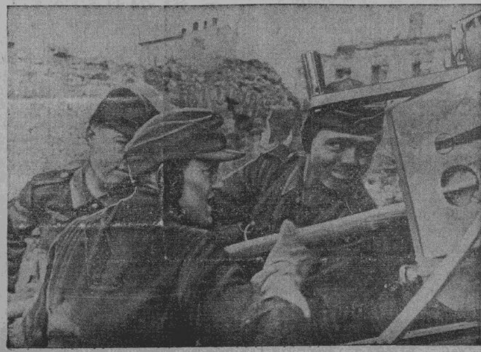
Германские артиллеристы во время боя на одном из участков восточного фронта.

Оставлены города Люблин и Нарва. У Брест-Литовска, Белостока и восточнее Ковно отбиты все атаки противника