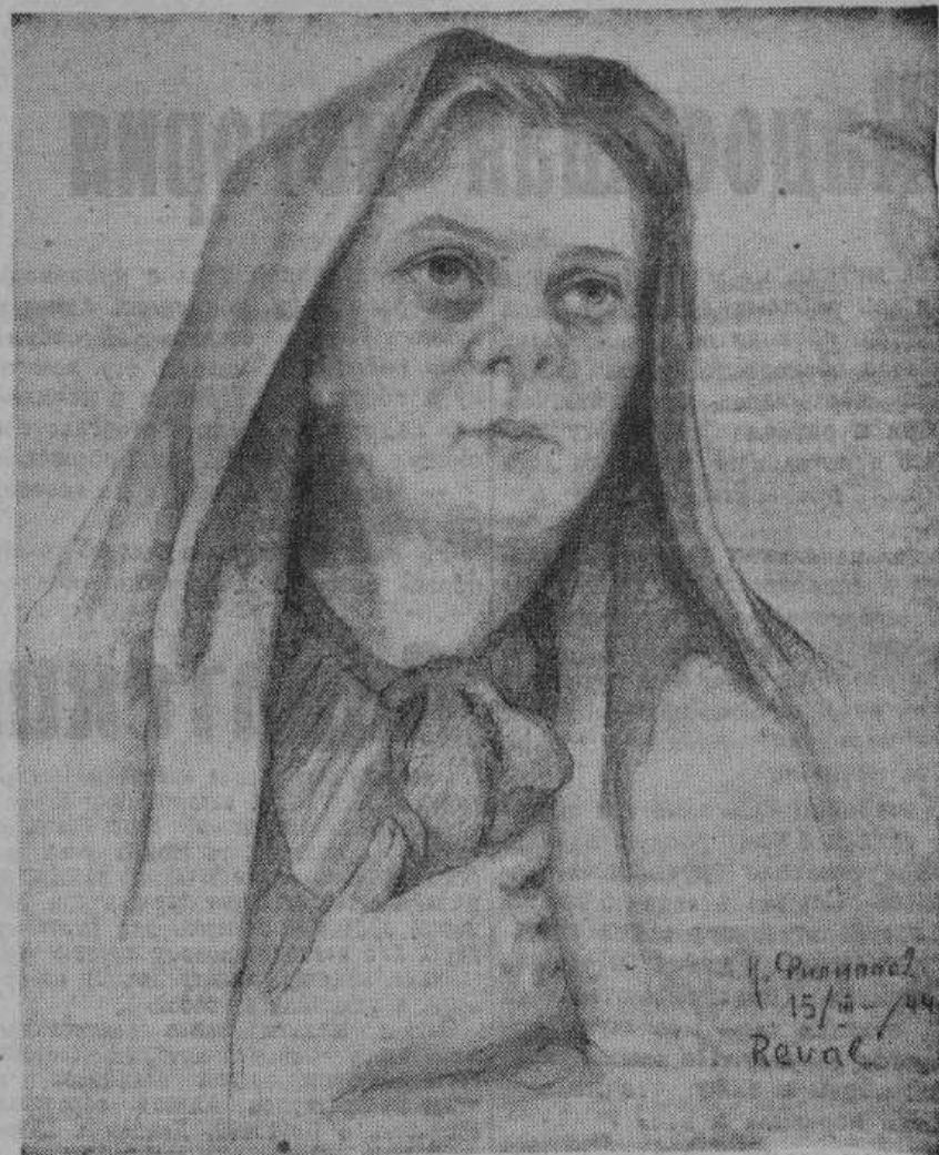
«МАТЬ» — рисунок художника И. Филиппова.