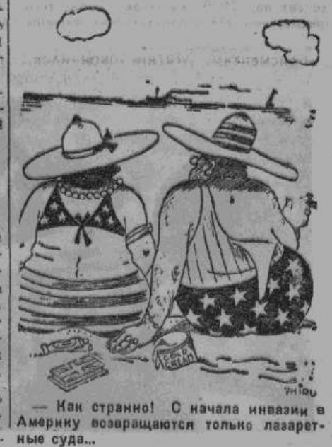
— Как странно! С начала инвазии в Америку возвращаются только лазаретные суда...