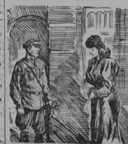
рабочих, с которыми он делался воспоминаниями о боевых эпизодах гражданской войны. А еще чаще можно было его видеть за книгой с карандашом в руках. Он готовился к дальнейшей учебе.