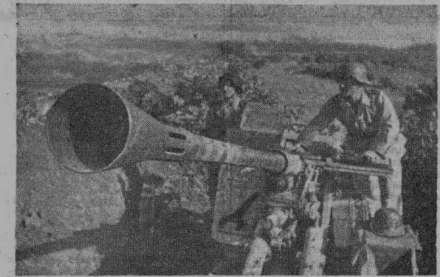
Германское зенитное орудие, приспособленное для обороны наземных путей сообщения.

Финское правительство, под давлением Англии и Соединенных Штатов, приняло решение — порвать отношения с Германией и принять условия, поставленные Советским Союзом.