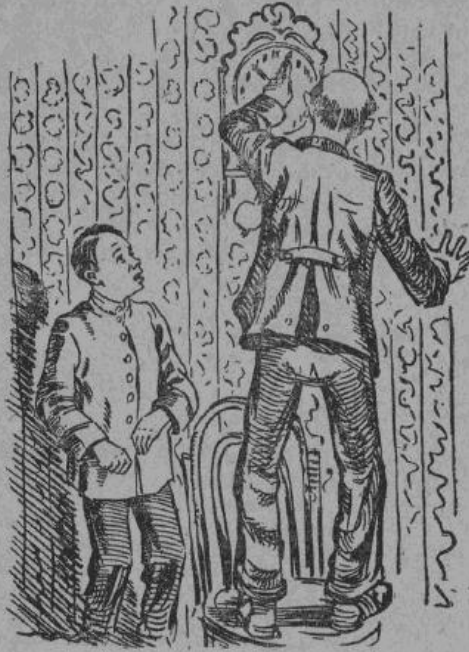
Оттолкнув сына от часов, Дядечкин подвинул стрелку вперед.

Ступай с гостями посиди! Чего в кухне толчешься?