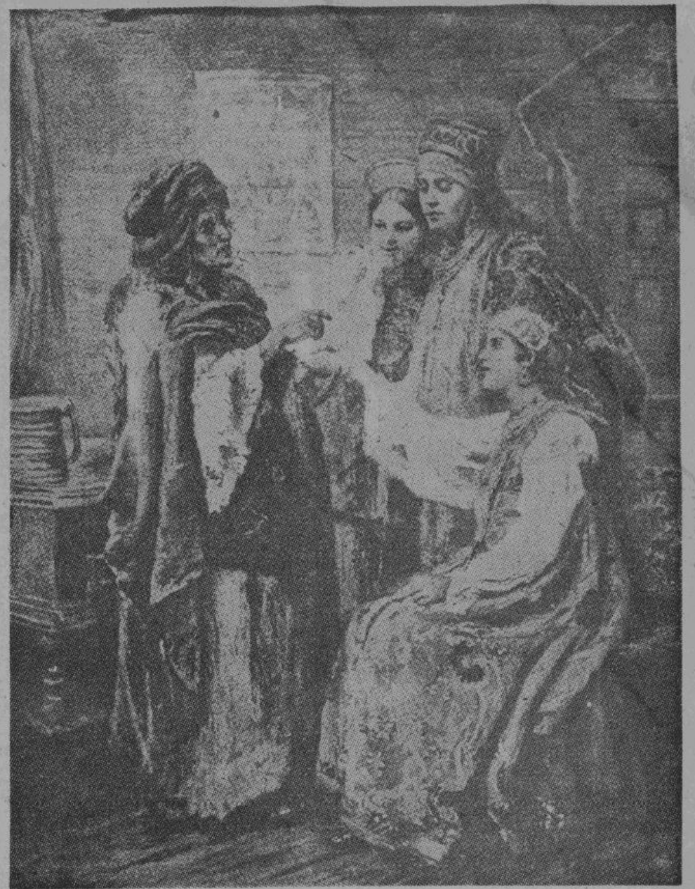
К. Маковский — «Святчное гадание».

Копайский отходит от часов, останавливается... Подумав немного, он ворочается и укорачивает старый год на шесть минут. Дядечкин выпивает два стакана воды, но... горит душа! Он ходит, ходит, ходит... Жена то и дело гонит его из кухни. Бутылки, стоящие на окне, рвут его за душу. Что делать! Нет сил терпеть! Он опять хватается за последнее средство. Часы к его услугам. Он идет в детскую, где висят часы, и наталкивается на