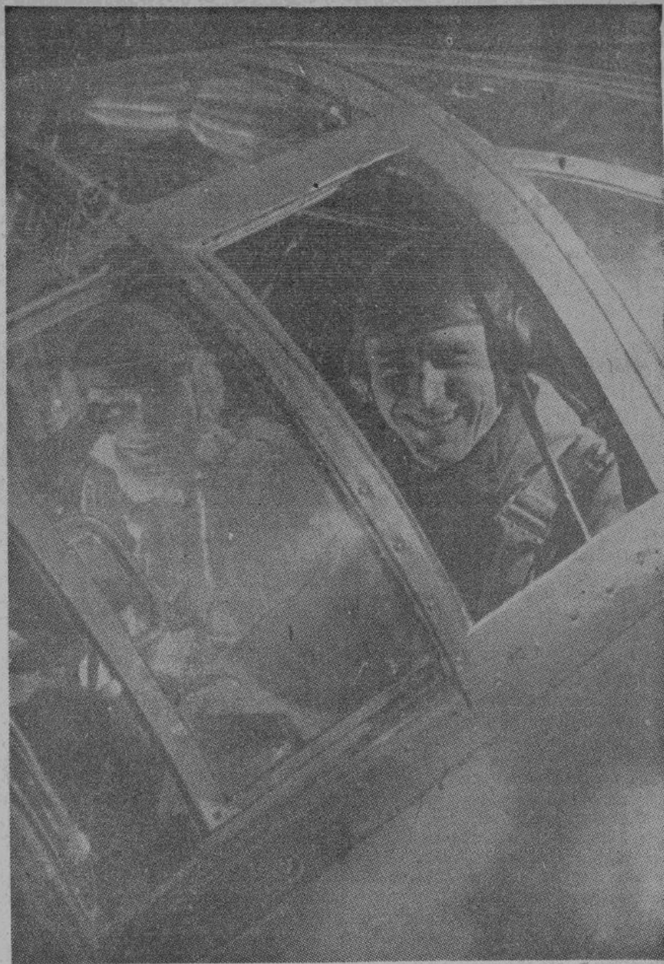
Летчики германской бомбардировочной авиации после приземления рады результатам успешного полета

«Большую тревогу так же внушает подготовка кадров. Машинотракторным станциям Узбекской республики для проведения уборки комбайнами требуется 1300 комбайнеров и такое количество помощников комбайнеров. В наличии же имеет-