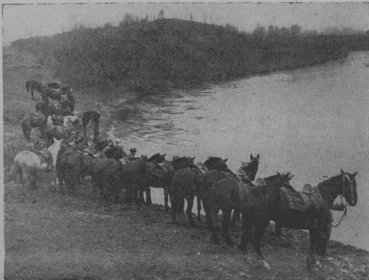
Казачи-добровольцы привели своих коней на водопой.