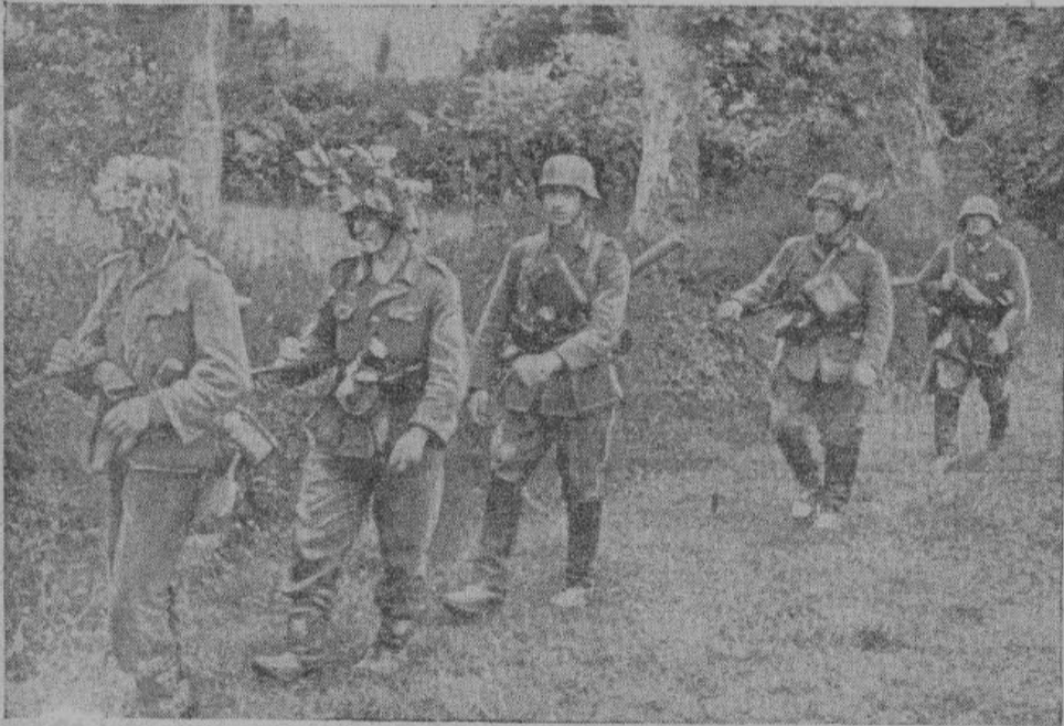
Добровольцы в разведке