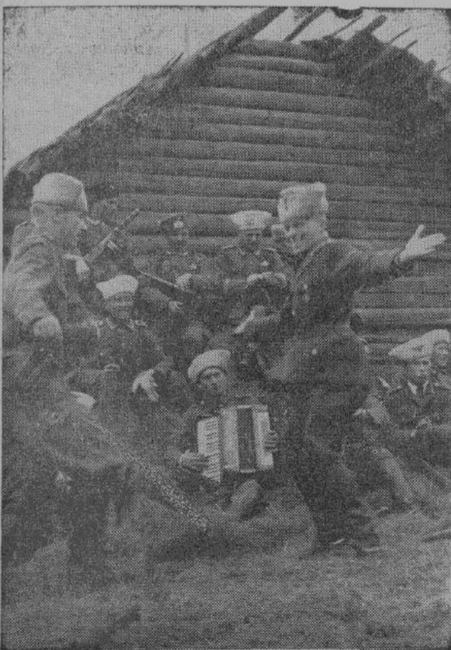
Национальный казачий танец