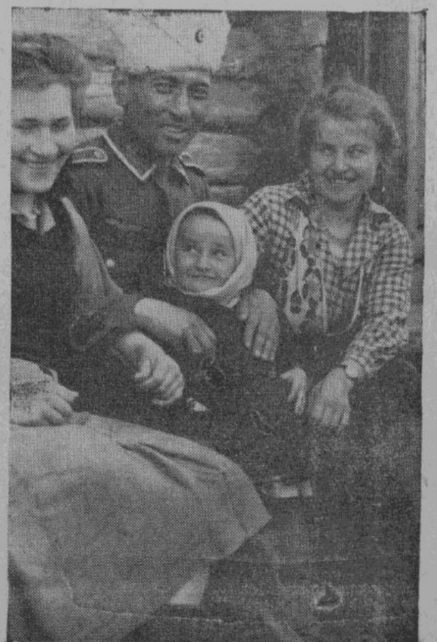
Казак-отпускник в кругу своей семьи.