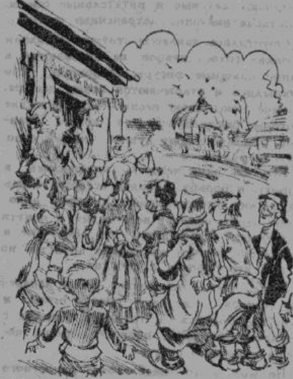
— Товарищи, прошу соблюдать порядок!

перестал. Что вы делаете, товарищи! Не напирайте! Магазины, так сказать, закрыты. Завтра будем выдавать все. Всего привез! Сами видите, полная машина. Да не жмите, дверь-то трещит! Наконец со злобостью заведующий закрыл дверь на ключ. — Фу, черти, — отирая пот с лица, ворчал завмаг, — говоришь им по-человечески что завтра все будет. Нахмурил седые брови, тяжело дыша, заведующий мял в руках длинную накладную! — Четыре пружинных матраца, так... мандолины двенадцать. Что за дьявол! Подков восемь тысяч штук... здорово! А лошадей-то всего восемь штук в колхозе... пудренцу двести штук... ч-чорт... резиновые куклы... Заведующий бессмысленно тарачит глаза на шофера. — Вот так товару! Да они в своем уме-то были? Подков восемь тысяч... пудренцу двести штук! Боже мой! И это все? — Все. — А где же мануфактура, мыло, сахар? Вместо соли, пожалуйста, пудренку. — Вы не ругайтесь, мы еще с вами того. Я для вас специально подарок привез — целую четвертку. Только как с грузом?