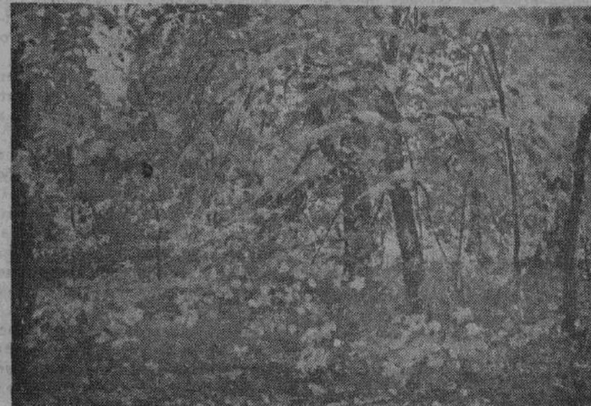
«ОСЕНЬ» — картина художника Остроухова.