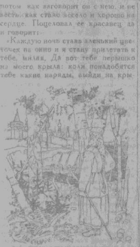
... На берегу синего моря стоял дворец...

аленького цветочка нигде не нашел, хотя и исходил всю ярмарку с начала до конца. Когда же возвращался старик домой без желанного подарка для младшей дочери, навстречу ему попался дряхлый старец, в руках которого красовался чудный аленький цветочек. «Продай мне, старинушка, свой цветик!» заголосо старик, умоляя старца. — «Он у меня не продажный, а заветный: буде дочь твоя пойдет за моего сына Финиста Ясна-Сокола, так отдам тебе цветок даром», ответил встечный. Призадумался отец: не взять цветка — дочку огорчить, а взять — надо будет ее замуж выдать и, Бог знает, за кого. Подумал, подумал и решил все-таки взять цветочек. «Что за беда!» — сказал он про себя, «когда плох жених будет, так и отказано можно». Обрадовалась младшая дочь подарку, заперлась в светелке, опустила аленький цветочек в воду, отворила окошко, да и смотрит в синюю даль. Откуда ни возьмись — явился перед ней Финист Ясен-Сокол. Цветные перышки, вперхнул в окошко, ударился об пол и стал молвцем. Девушка было испугалась, а