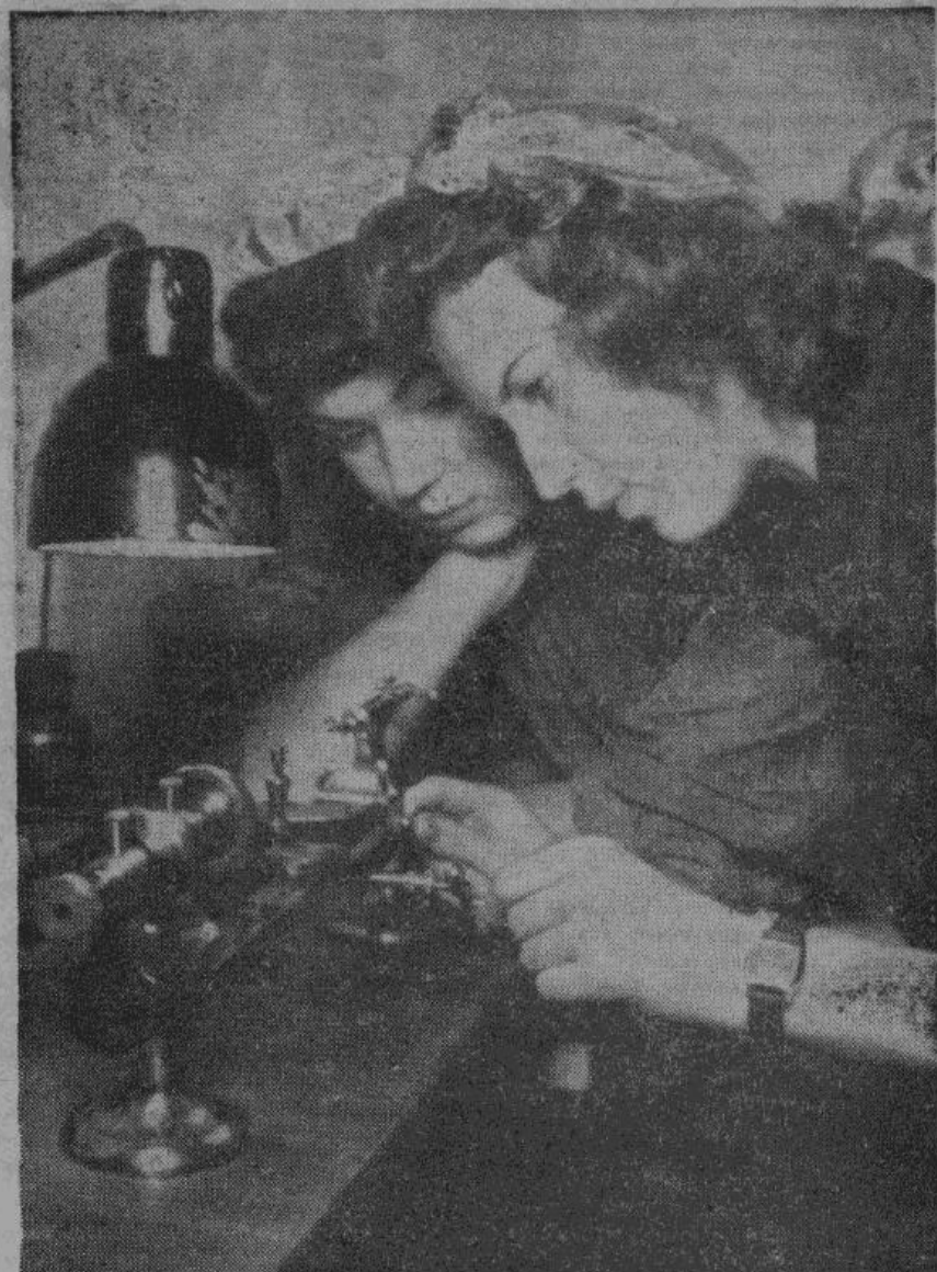
На оборону! Артистки германского театра за работой на маленьком токарном станке. Пока еще непривычно, но скоро они изучат обточку металлов.