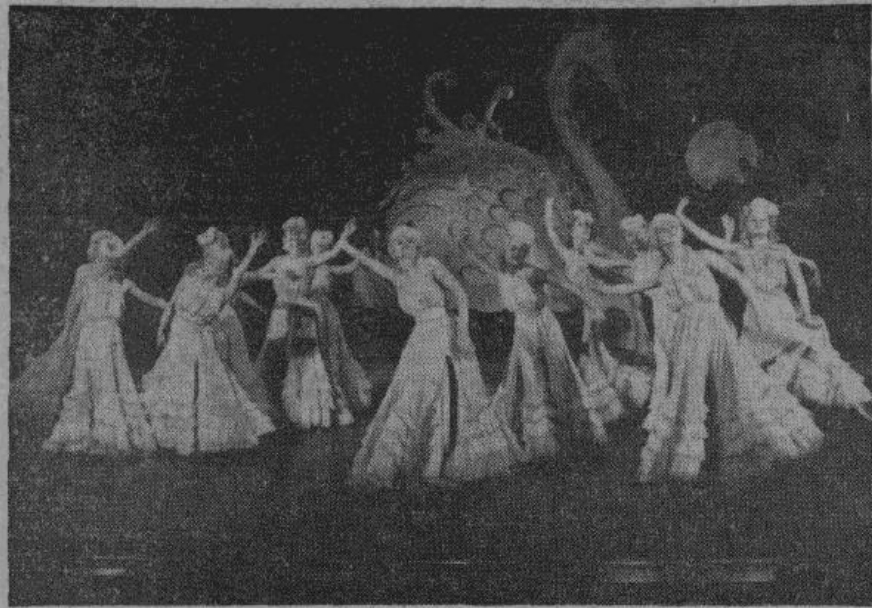
В последний раз появился занавес на сценах германских театров. Завтра все работники театра: артисты, декораторы, осветители, — пойдут на оборонную работу.

Враг настойчиво рвется в Европу. Он напрягает последние усилия, чтобы ворваться в ее цитадель — Германию. Не вполне полагаясь на свои военные силы, он применяет самые низкие методы войны — террор, шантаж, подкуп.