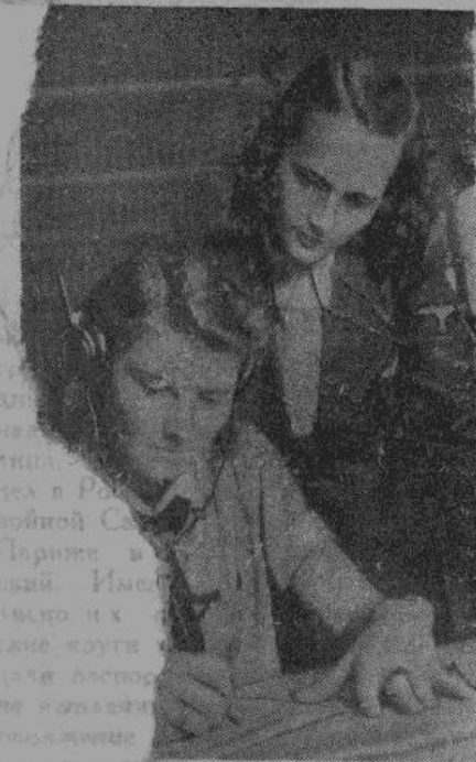
Бог и солдат