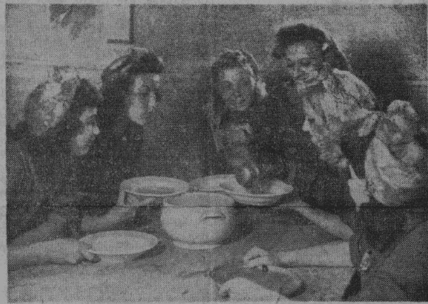
Первый обед артисток на фабрике. Обедок вкусен, что хочется съесть и по вторую тарелку.