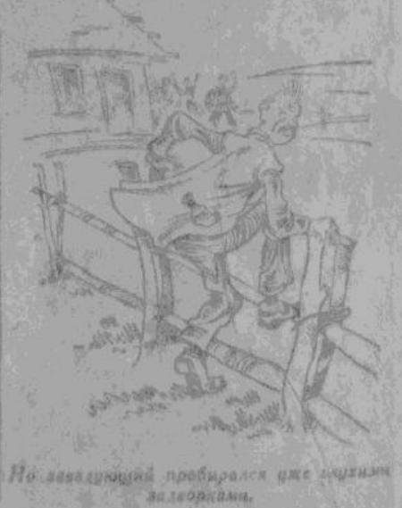
Но заведующий пробирается уже глухими задворками.

привезли! Будут подковывать, чтобы не спотыкались на колхозной работе. — Давай сюда заведующего! Заведующего лавки! — орал в толпе. Но заведующий, предвидя скандал, пробираясь уже глухими задворками к своей избе, бережно придерживал правой рукой, на которого вискомывалось горлышко бутылки.