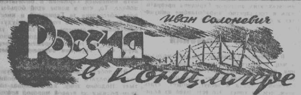
Иван Солоневич Россия в Конквите

В этой кабинке мы провели много часов, то скрываясь в ней от последних зимних бурь, то просто принимая приглашение кого-нибудь из ее обитателей насчет чайку.