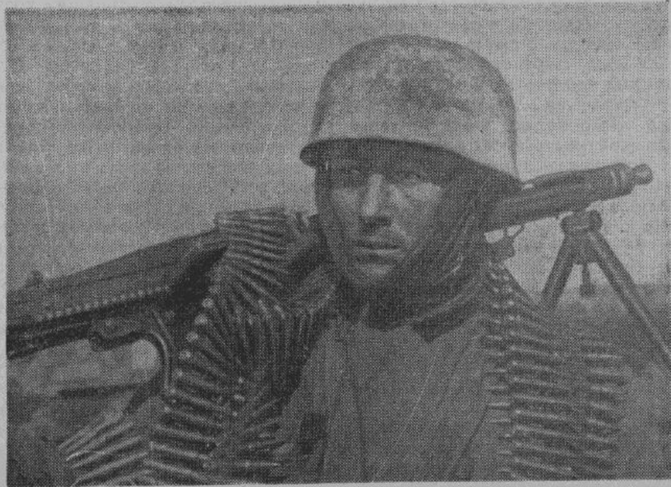
Германский парашютист с легким скорострельным пулеметом.

Японские войска совершили ряд успешных операций против китайских коммунистических банд, орудующих в восточной и южной части провинции Шантунг. Бежавшие бандиты оставили на поле боя 1435 убитых, японцами захвачено 164 пленных. Среди трофеев японцы захватили три оковых мортиры, пять пулеметов, свыше шестисот винтовок.