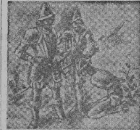
Конкистадоры - испанцы обнаружили у туземцев Америки письма, составленные из узлов на веревке.