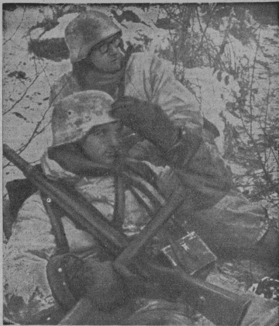
Короткая пауза во время боя. Германские гренадеры пользуются минутным отдыхом, но глаза их остаются прикованными к неприятельским позициям