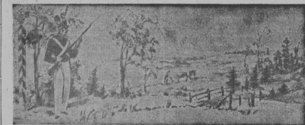
От солдата к солдату известие о коро нации было передано в Петербург.

Монастыри со всех концов Европы посылали паломников в Рим. Паломники шли через чужие страны. За плату монастыри и монахи брались доставлять по дороге письма. Эта почта называлась «почтой пилигримов».