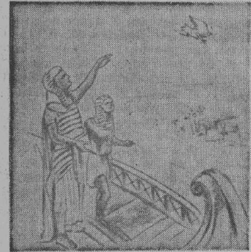
Голубиная почта в древнем Египте.

Аккуратный старик предложил тогда адмиралтейству свои услуги. Он пришел в шифровальный кабинет с десятком престарелых джентельменов