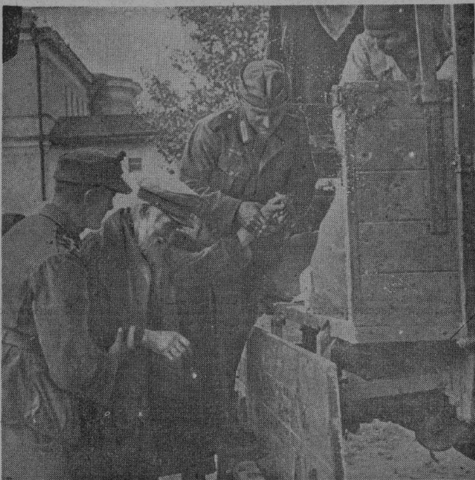
Немецкие солдаты во время эвакуации гражданского населения в прифронтовой полосе, обычно помогают русским переселенцам при отъезде.

Группа самолетов германской разведывательной авиации, оперирующая на восточном фронте, незадолго до Рождества совершила свой 10.000 боевой полет. Разведчики большей частью действовали на небольшом расстоянии и особенно отличились при корректировании артиллерийской стрельбы.