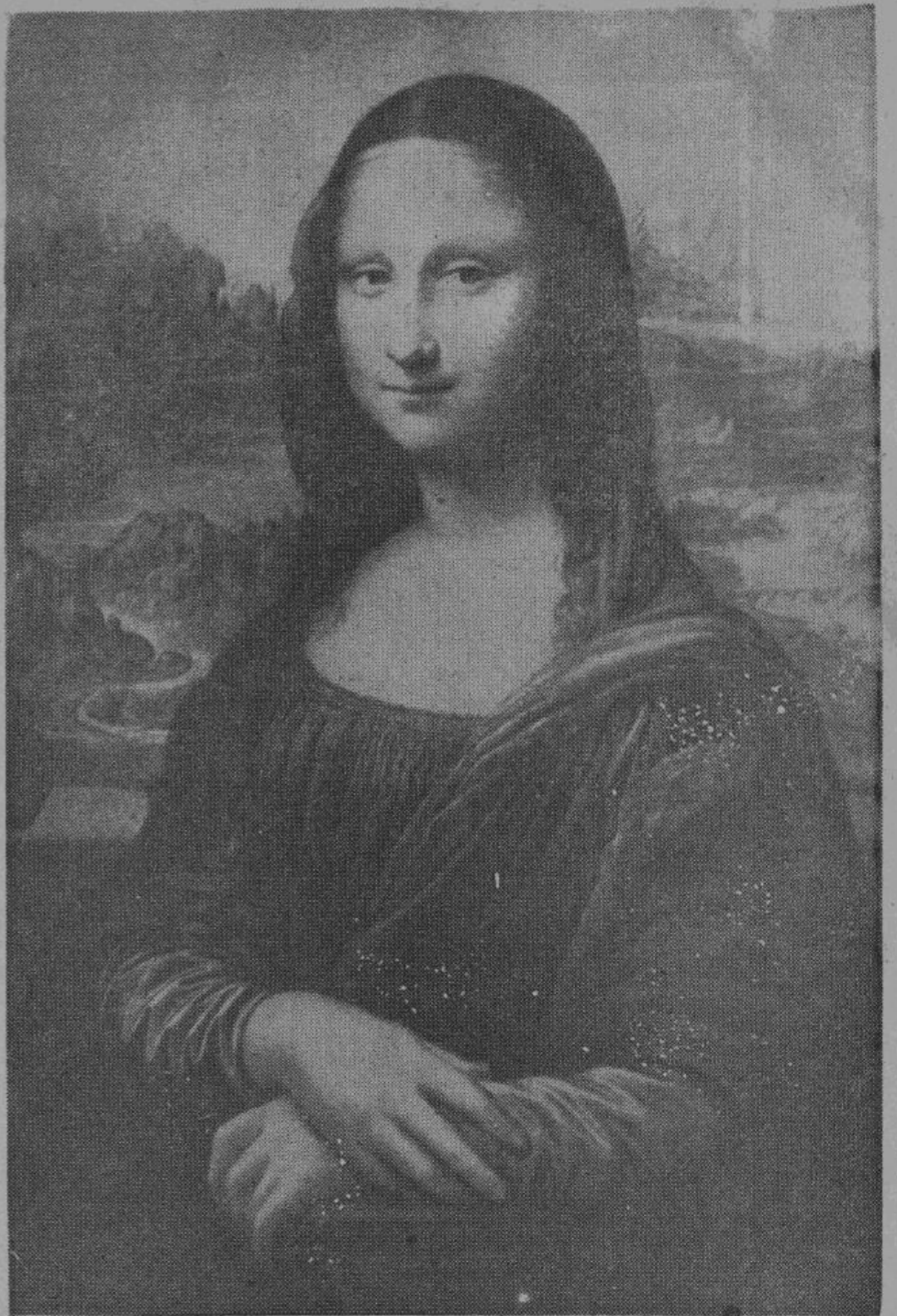
Джоконда. — Картина Леонардо да Винчи.

Леонардо занял в истории европейской живописи совершенно исключительное место, как непревзойденный гений, указавший своим творчеством путь Микель Анджело и Рафаэлю — его младшим современникам. Леонардо обладал огромным ясным умом, которым неизменно контролировал свою стихийную творческую силу; он был настолько мудр, что понимал ограниченность самого большого человека перед загадкой бесконечности. Воплощением этой извечной тайны бытия и является загадочная и влекущая улыбкой бессмертная Джоконда. Дм. Рудин.