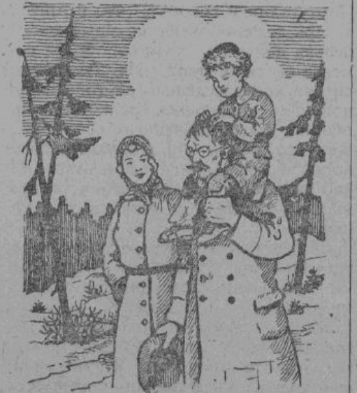
Любик не без удовлетворения уместился на моем плече...

случай) бывшим коммунистом, имеющим еще кое-какую специальность, кроме обычных «партийных специальностей» (ГПУ, коопе-рация, военная служба, профсоюз), ценой трех лет «самоотверженной», то есть совсем уже каторжной работы заработал себе пра-во на «совместное» проживание с семьей). Такое право давалось очень немногим и особо избранным лагерникам и заключалось оно в том, что этот лагерник мог выписать к себе семью и жить с ней в какой-нибудь частной избе, не в бараке. Все остальные условия его лагерной жизни: паек, работа и — что хуже всего — переборски оставались прежними.