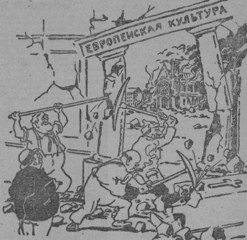
«Культурное строительство» демократических союзников

ближайшие дни покинет Гибралтар и отправится в другой порт, где попы-таются произвести капитальный ре-монт.