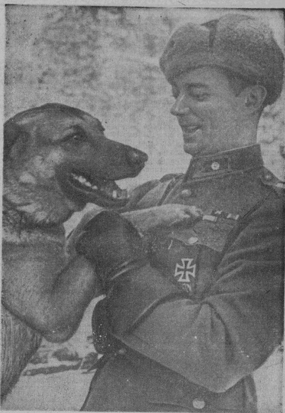
Войскам, сражающимся на дальнем Севере, большую помощь оказывают собаки, часто несущие службу связи, сторожевую и санитарную. На снимке — командир отряда финских пограничников со своим верным другом.

солдат и отважные финны доказали, что для них даже за Полярным кругом не было ничего невозможного.