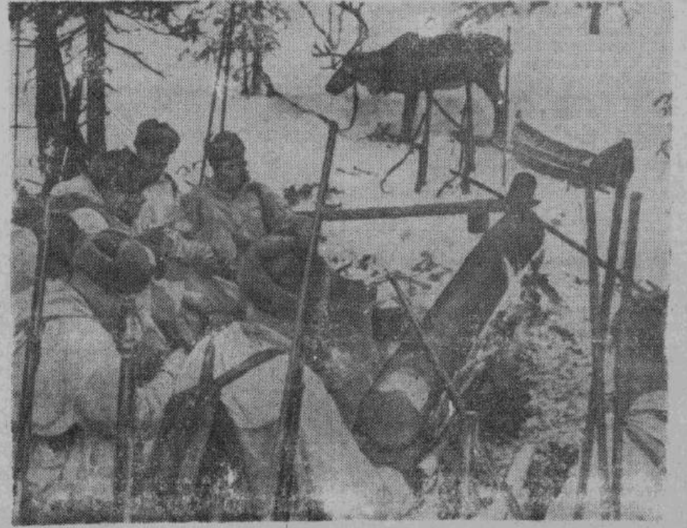
Солдаты, сражающиеся за Полярным кругом, большие мастера разводить огонь. На снимке — пограничники греются у костра, сложенного по индейскому образцу из двух бревен. На втором плане — северный огонь — обычное средство транспорта на этих широтах.

Одно советское соединение, воспользовавшись ночной темнотой, высадилось на немецкий берег в Нарвском заливе. Расположенная вблизи батареи германской береговой артиллерии обстреляла десантный отряд и потопила четыре дозорных и три десантных судна. Артиллерийским огнем подожжен небольшой грузовой пароход и повреждено несколько других судов. Высадившиеся части противника несколько раз тщетно пытались атаковать батарею, однако, были отбиты и понесли тяжелые потери. По-