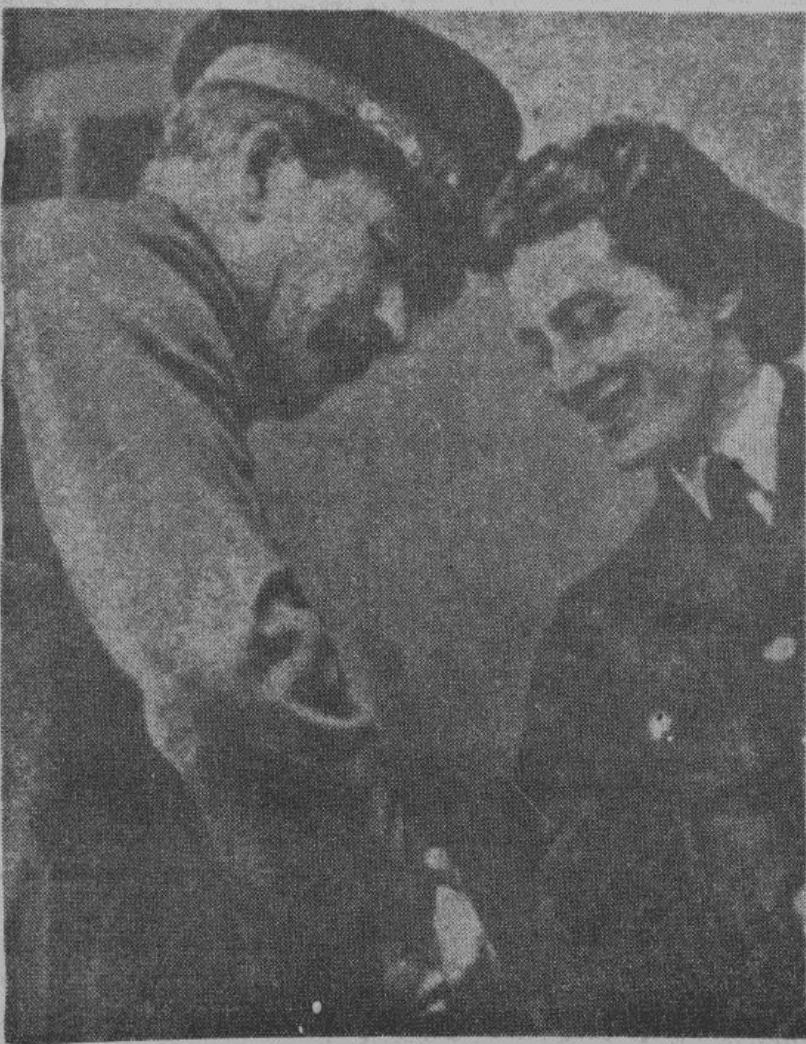
«Будет знакомым Иосиф Сталин — Сара Черчилль»

И по окончании Тегеранской конференции Черчилль прощался с «великим Сталиным» следующими словами: «Да благословит Вас Господь Бог».