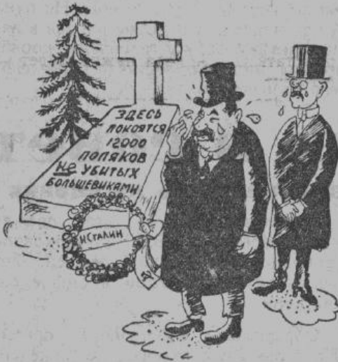
— Кто бы мог подумать, что умрут и те, кого мы закапывали живыми?

ностей типов, на Магнитостроях литературных и не литературных, печатных и вовсе не печатных и в сумме мелких и крупных слагаемых дают необозримые массивы великой советской Халтуры с большой буквы.