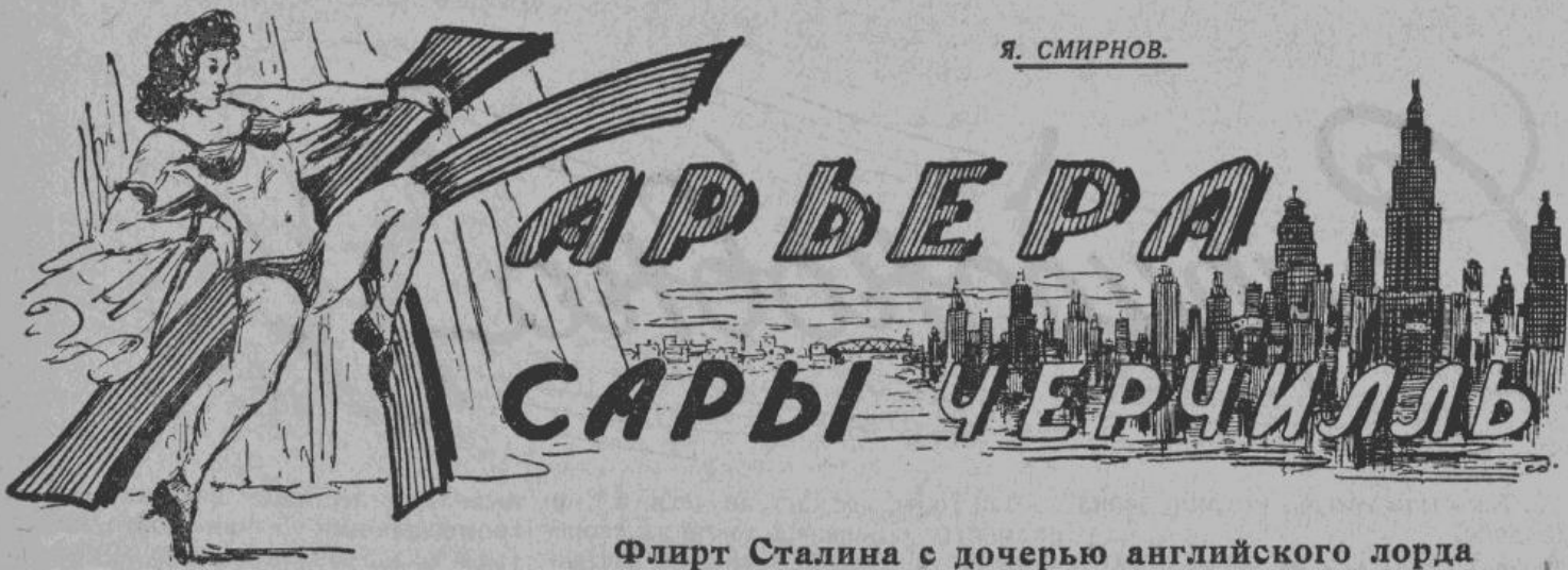
Флирт Сталина с дочерью английского лорда

В бурных событиях последнего времени незаметным прошел небольшой эпизод: знакомство и флирт Сталина с миловидной английской танцовщицей. Они познакомились на Тегеранской конференции. На снимке, дошедшем до нас сложными путями, фотограф запечатлел момент первой встречи. К последнему свиданию фотографа не допустили. Снимки получились бы, вероятно, не слишком официальными. Но и наше фото не лишено интереса. «Отец народов» в маршальской форме, сощурившись на подобие кота, трясет руку молодой пышноволосой англичанке.