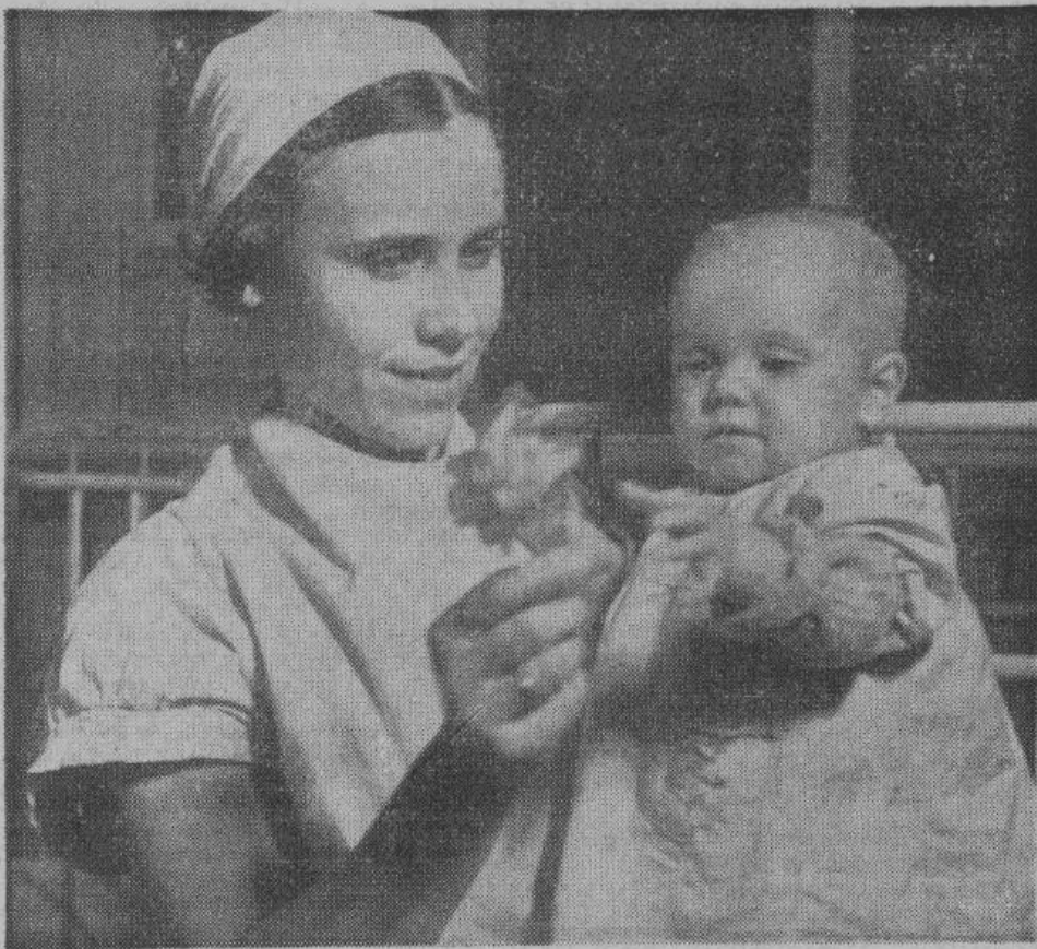
В Германии русские женщины и дети пользуются всеми правами и удобствами наравне с немцами. На снимке — русская работница, проводящая со своим ребенком отпуск в доме отдыха, находящемся в ведении организации «Мать и дитя».

На днях у западного побережья Бугенвилля 38 неприятельских самолетов и десять торпедных катеров напали на караван небольших японских торговых судов. Японским морякам, с помощью вступившей в бой береговой артиллерии, удалось потопить один неприятельский торпедный катер и тяжело повредить еще восемь. Два японских судна погибли. Караван благополучно достиг своей цели.