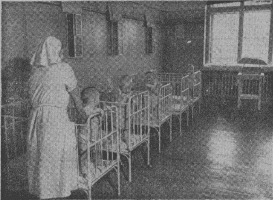
КОМНАТА САМЫХ МАЛЕНЬКИХ