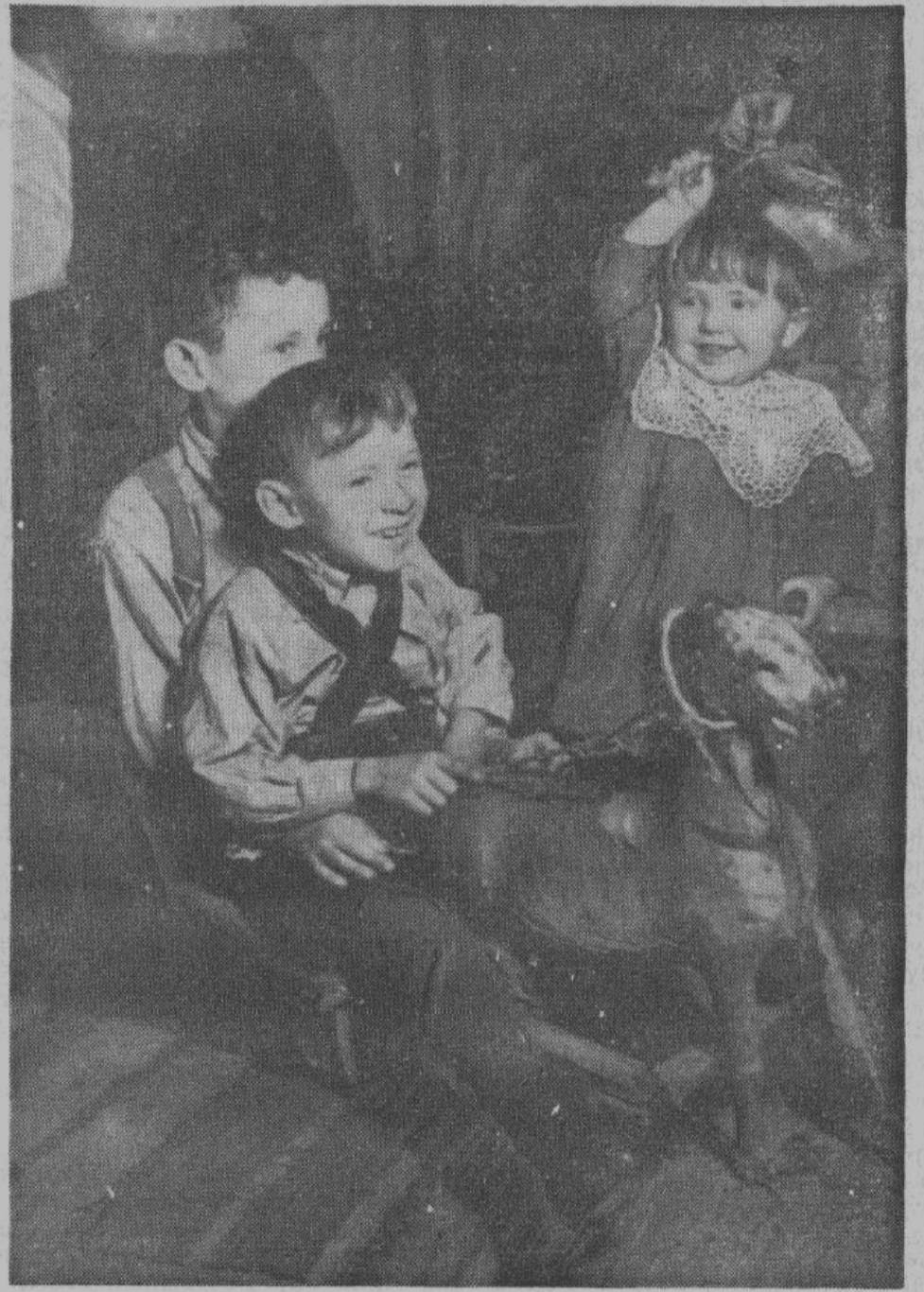
РАЗ, ДВА — ПОЕХАЛИ

Детям дается вся возможность забыть недавние ужасы войны и большевизма и их детство день ото дня становится светлее.