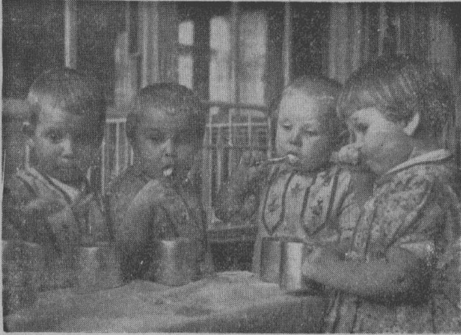
КАКОЙ ВКУСНЫЙ СЕГОДНЯ КИСЕЛЬ

отношение и живут теперь в тепле и довольстве.