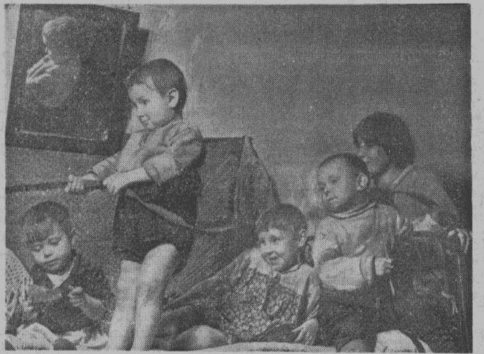
ПОСЛЕ ХОРОШЕГО ЗАВТРАКА МОЖНО ПОИГРАТЬ

Огорчает нас только то, что большинство из наших питомцев еще не имеет связи с родными и близкими. Но это — не беда, с течением времени надемся и это уладить.