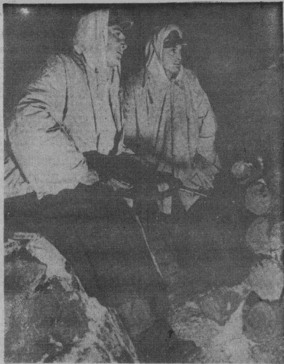
На передовом посту

Эта гнусность не может, конечно, осквернить памяти адмирала-героя. Память о нем не может быть запачкана ни похабными постановлениями севастопольского горкома, ни новейшим постановлением президиума Верховного совета СССР.