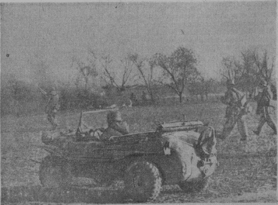
Под Житомиром. Мимо горящих и объятых пламенем советских тяжелых танков 34 немецкие гренандеры идут в контр-атаку.

Следующий номер газеты „ЗА РОДИНУ“ выйдет 11-го января