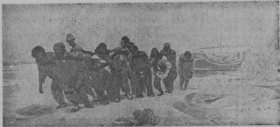
«Бурлаки» — картина И. Е. Репина