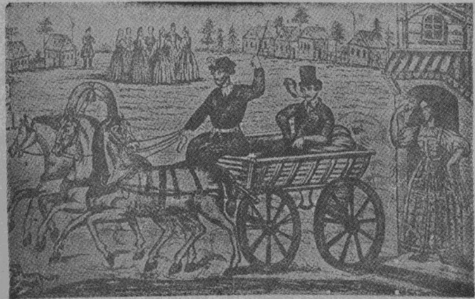
«Что ты жадно глядишь на дорогу...» Русская народная картина 1850—1860 годов.

Контрабанда вольфрама настолько усилилась, что Мадрид и Лиссабон оказались вынужденными согласовать свое законодательство по добыче этого металла и в то же время установить строгий контроль границы и всех горных тропинок. Благодаря строгому контролю, контрабанда вольфрама стала постепенно исчезать на благо обоих заинтересованных государств и к большой досаде Англии.