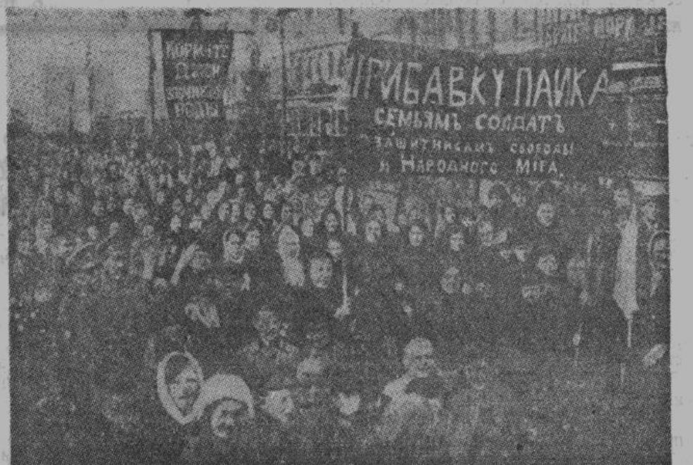
Едва только совершилась Февральская революция, как народ стал предъявлять Временному правительству требования. На снимке — демонстрация женщин, требующих прибавки к паюку семьям солдат.

дах, передачу земли крестьянам. Под демагогическими лозунгами: «Долой министров-капиталистов» и «Никакой поддержки временному правительству» развилась бешеная большевистская агитация. Совершенно ошалевшая от этой агитации толпа, состоявшая из солдат, не желавших идти на фронт, худшей части рабочих и отбросов интеллигенции, митинговала и демонстрировала день и ночь.