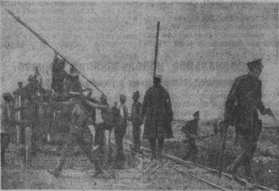
Июнь 1917 года. На фронте развал. Не желая сражаться, солдаты оставляют фронт. Английские офицеры пытаются угрозами и силой заставить русских солдат идти в наступление.

Неудачи на фронте, разложение армии, хозяйственная разруха, растущая угроза большевизма — побудили главнокомандующего армией генерала Корнилова выступить с целью взять власть в свои руки. Попытка не удалась. Большевики использовали ее, чтобы запугать колеблющихся «правой опасностью». Попытка временного правительства с помощью так называемого государственного совещания, опереться на общественные