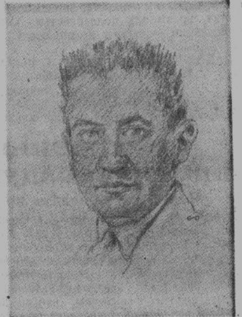
А. Ф. Керенский — военный министр и министр юстиции Временного правительства. Не сумев дать стране действительно сильной власти, бежал за границу, оставив русский народ во власти большевизма

Правда, в совете из 800 депутатов, большевиков было около ста, и огромное большинство совета воодушевлено было желанием поддерживать временное правительство. Но сам совет не был независимым учреждением, он находился под сильнейшим давлением улицы. А улица, которая непрерывно митинговала, все больше раздражалась войной и подпадала под влияние разнузданной и демагогической агитации большевиков. Большевики не скупились на посулы: они обещали мир, хлеб, свободу, рабочий контроль на фабриках и заво-