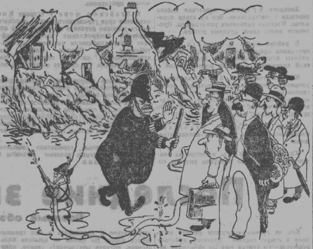
Черчилль: — Не волнуйтесь, господа! Все, что вы здесь видите, не больше, как последствия последнего турецкого землетрясения.

Черчилль усилил цензуру и запретил опубликовывать подробности последних налетов германской авиации на Лондон.