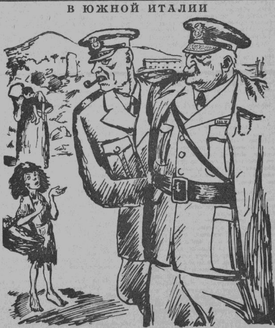
— Какая наглость! Этим людям мало того, что мы их освободили от фашизма. Они хотят еще хлеба.

Да, «многообразной и кипучей жизнью» живет тыл страны советов!