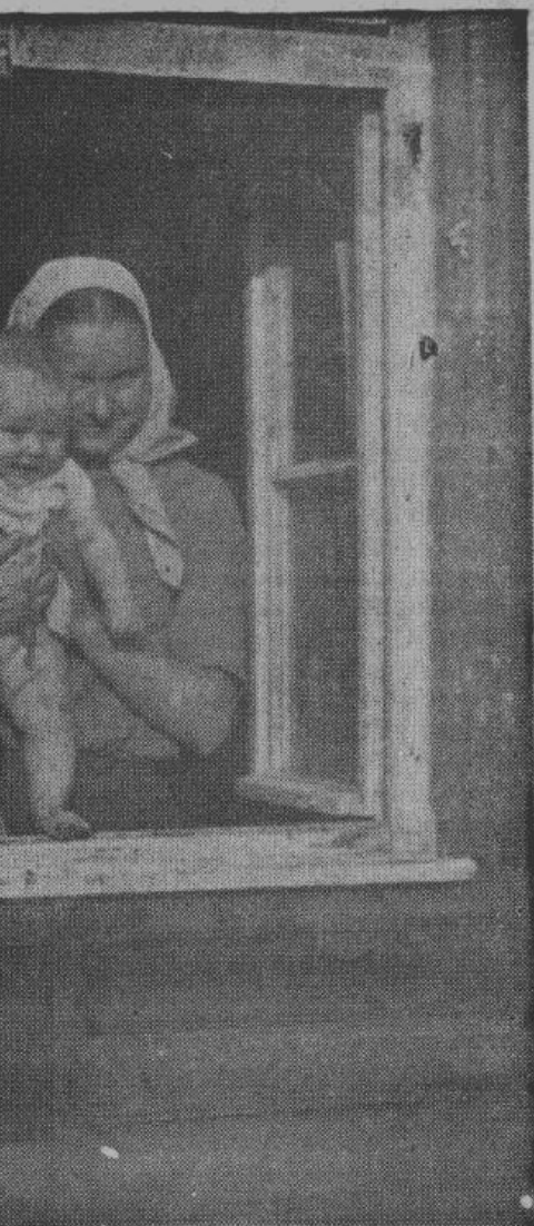
Русским рабочим и работницам, выехавшим на работу в Германию, предоставлены там все необходимые условия для нормальной семейной жизни. Много браков заключено вдали от родины; много новых русских ребят родилось уже в Германии. Они со своими матерями пользуются всемерной поддержкой германского правительства и самой доброжелательной опекой его. Как видно на снимке, один из новых граждан Новой Европы вполне одобрительно относится к ее порядкам

На базарах-толкучках стоят старухи и истощенные женщины, продающие последнюю смену белья или из-